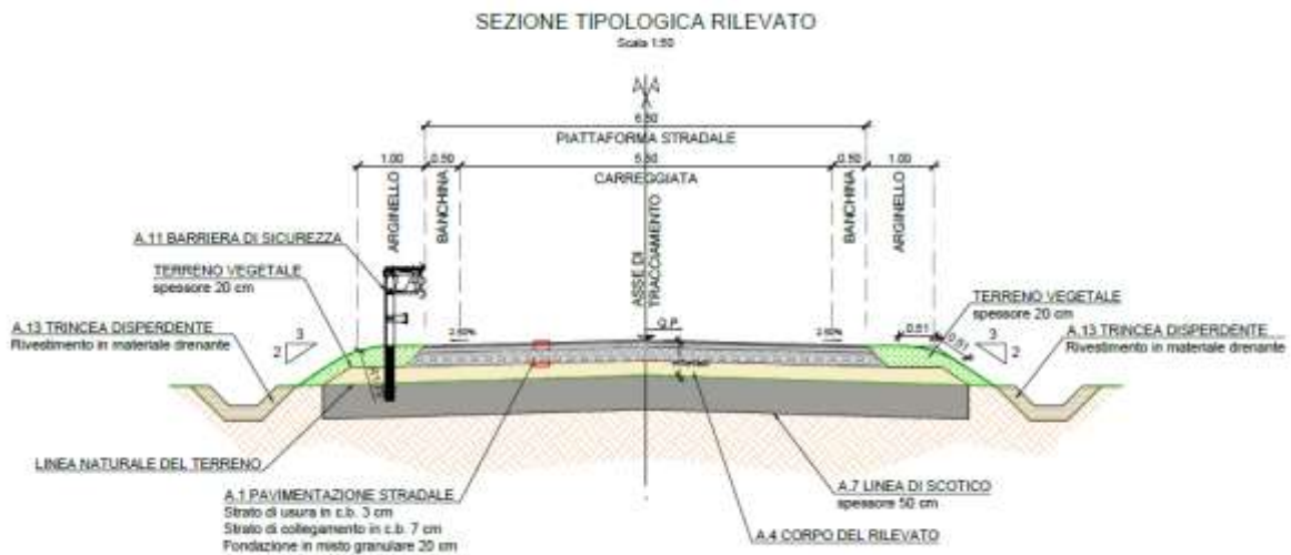
Figura 1: Sezione tipologica

La sezione si completa con un margine esterno della larghezza complessiva di 1 m in cui trovano collocazione le cunette per la raccolta delle acque meteoriche di piattaforma, gli arginelli e le barriere di sicurezza. Le sezioni sono caratterizzate da scarpate con pendenza di rapporto 2/3.