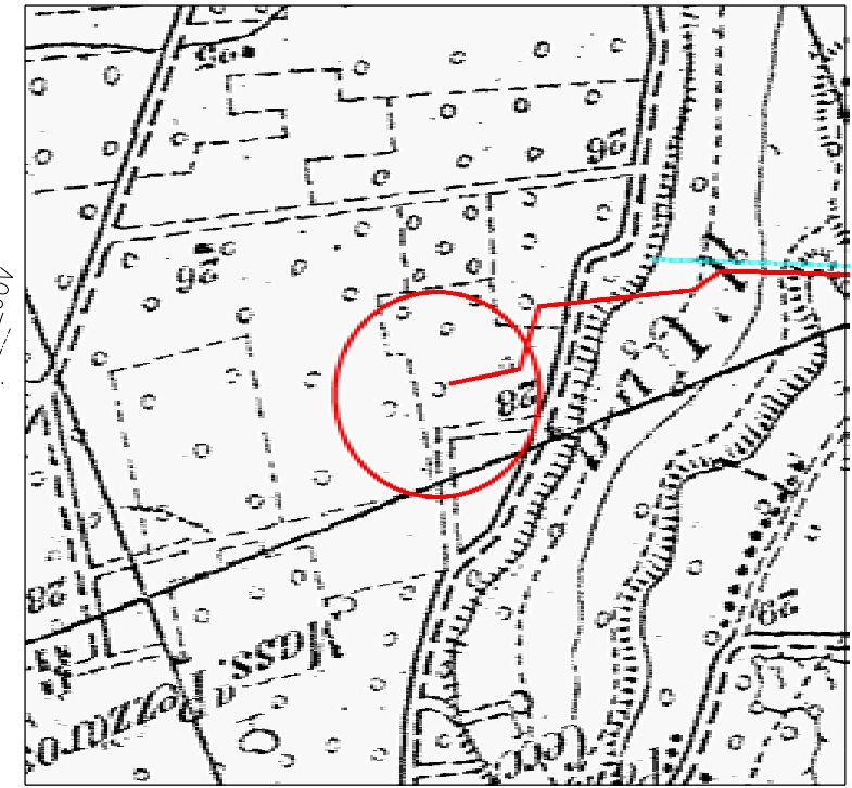
COROGRAFIA 1:10000 F. 202 IV S.O.