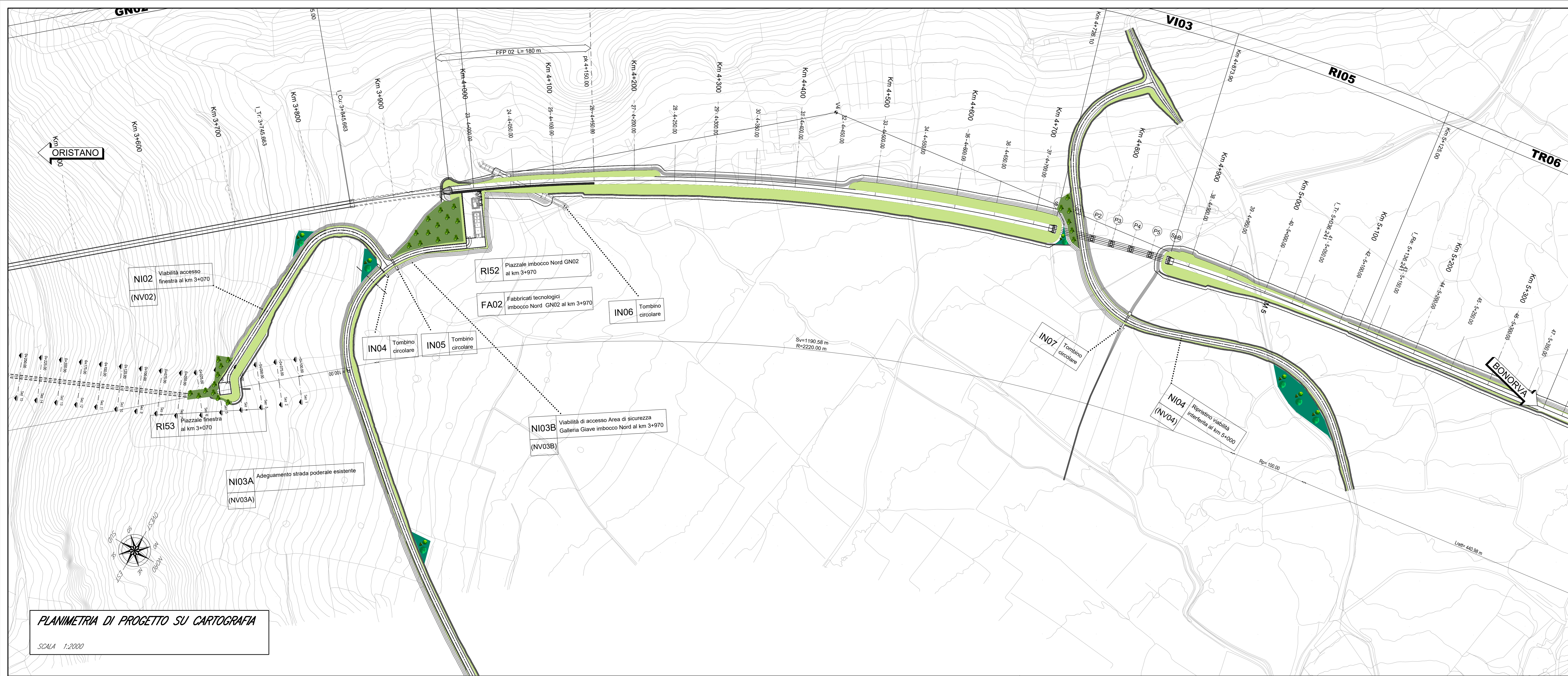
PLANIMETRIA DI PROGETTO SU CARTOGRAFIA SCALA 1:2000