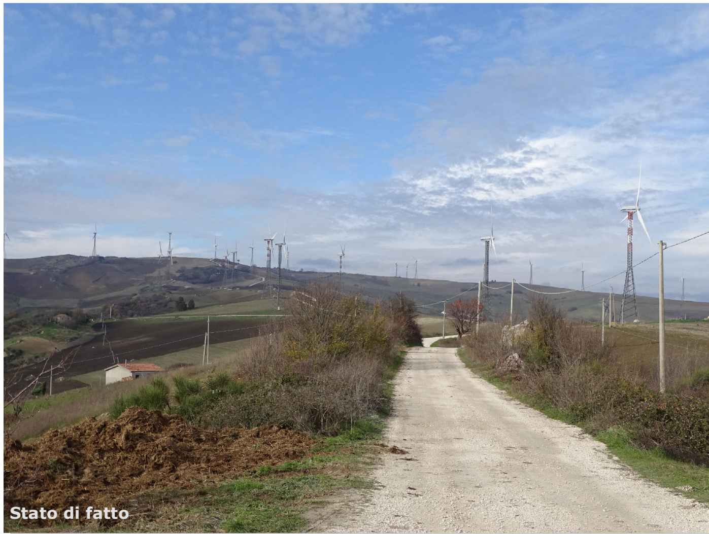
Stato di fatto