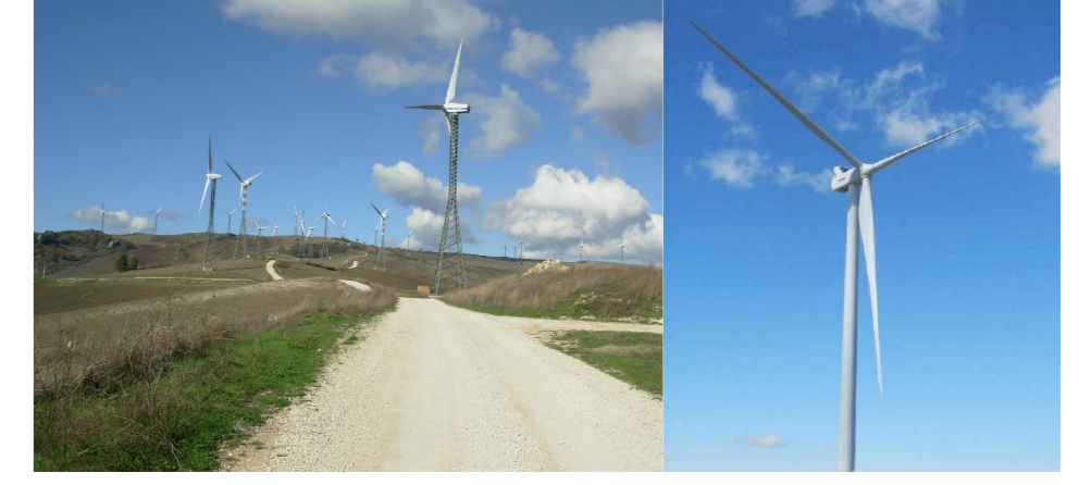
STUDIO DI IMPATTO AMBIENTALE

PROGETTO: POTENZIAMENTO DELL'IMPIANTO EOLICO MACCHIA VALFORTORE - MONACILIONI - PIETRACATELLA - S. ELIA A PIANSI