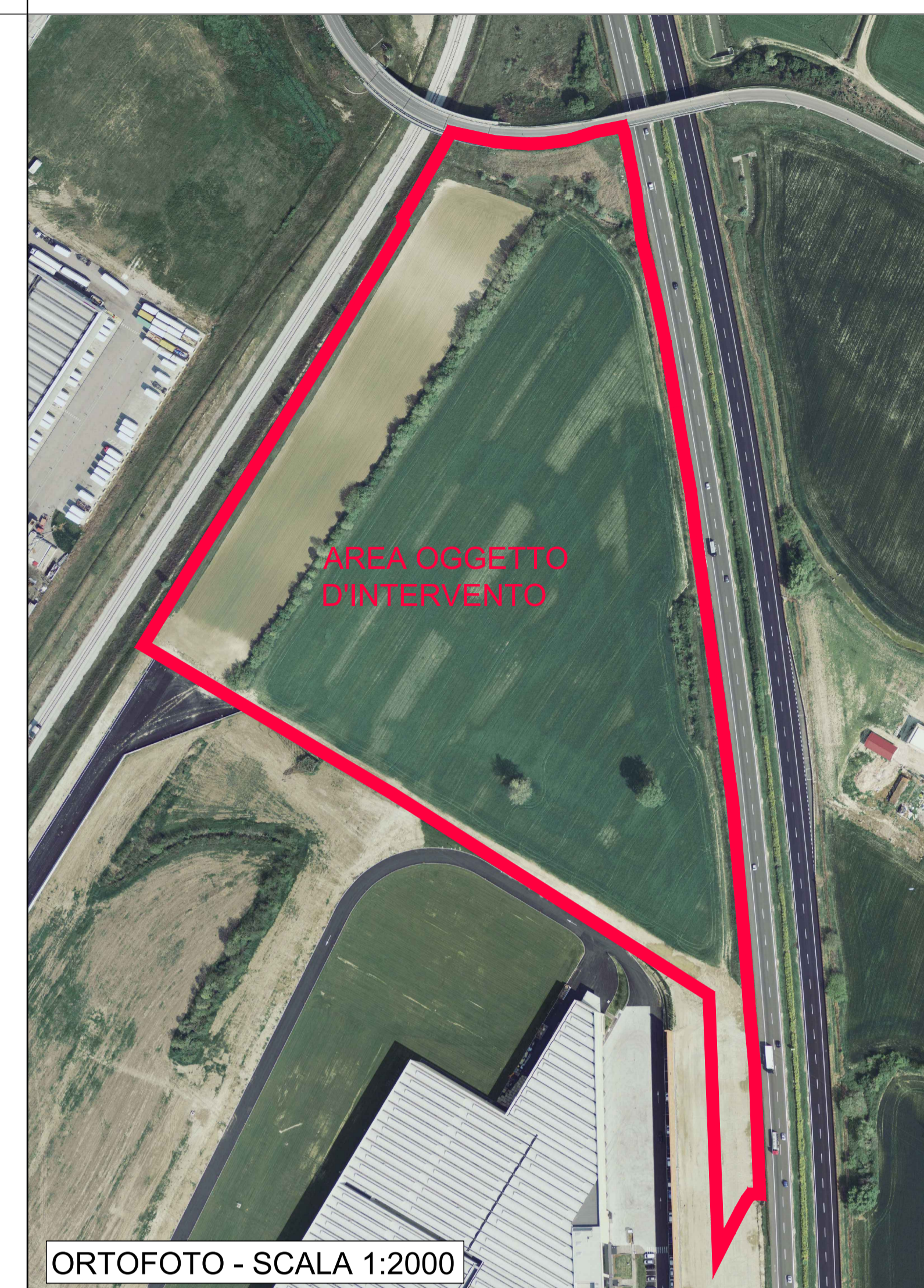
ORTOFOTO - SCALA 1:2000