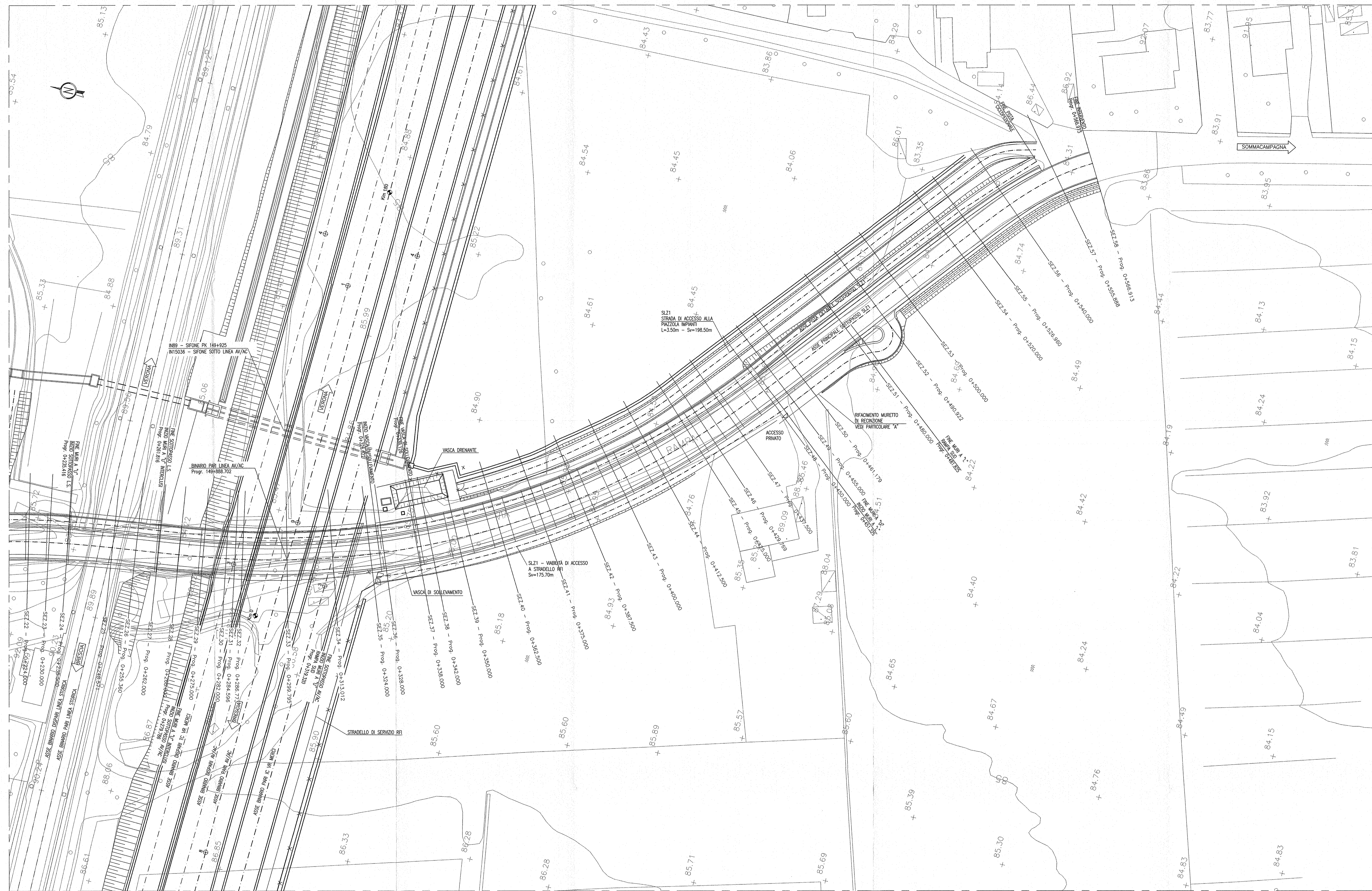
PARTICOLARE "A" - RIFACIMENTO MURETTO DI RECINZIONE