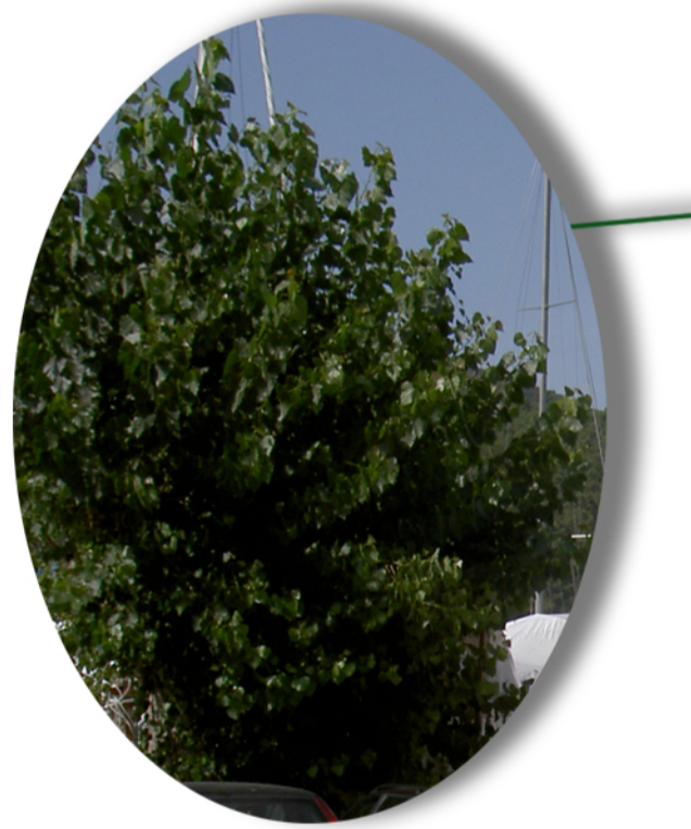
figlio comune (tilia x vulgaris)