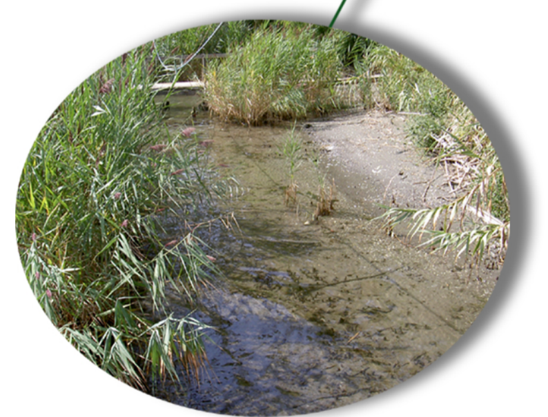
cannuccia di palude (phragmites communis)