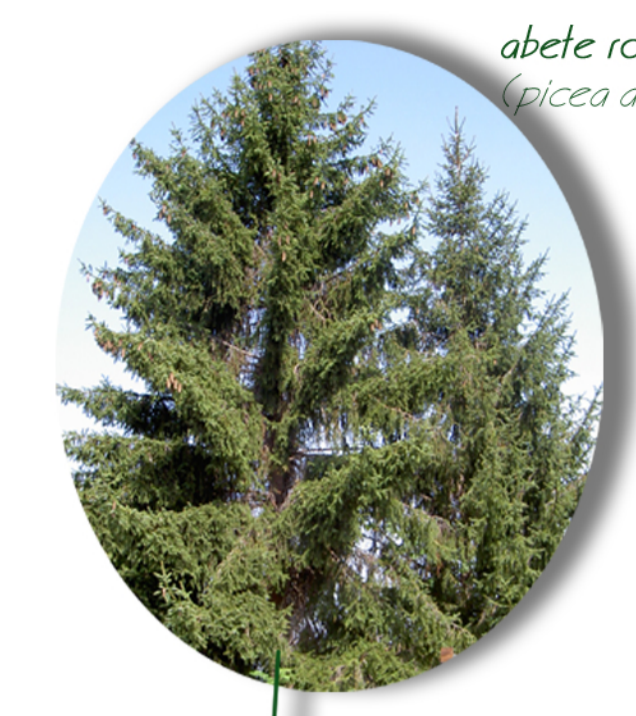
abete rosso (picea abies)