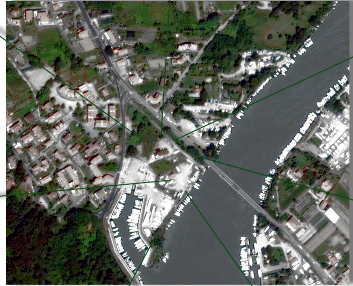
Analisi delle essenze esistenti nell'area di progetto