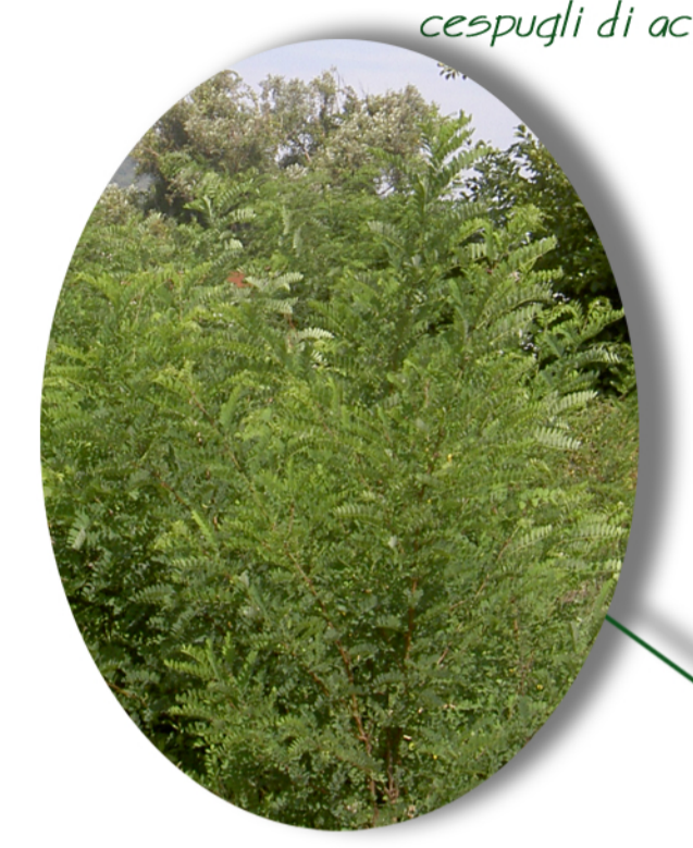
cespugli di acace