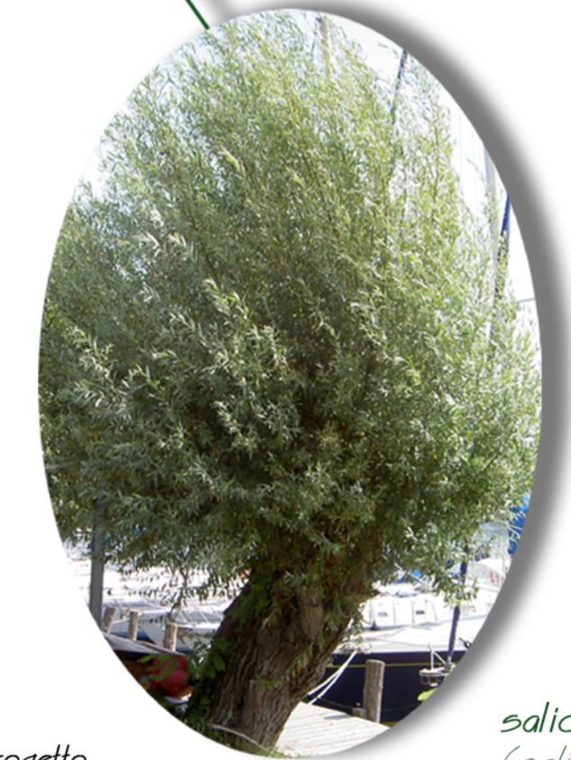
salice (salix alba)