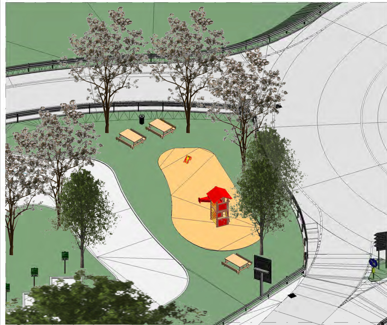
Assonometria area gioco 1 : 200

Miscuglio sementi per inerbimento (35gr/mq). Superficie totale inerbita 24217.38mq