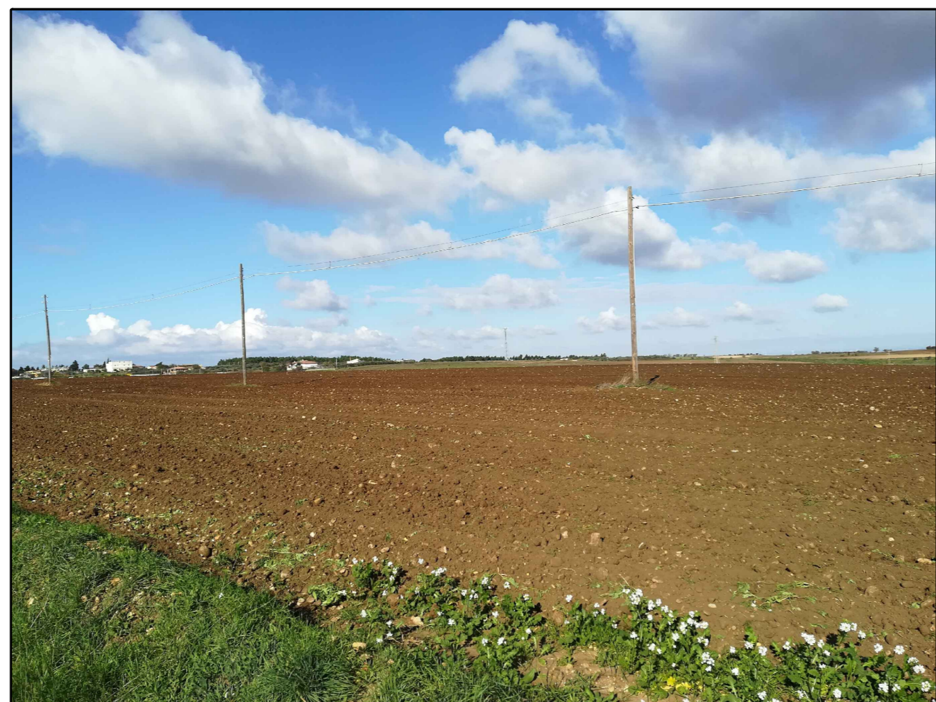
Scatto n. 2 ante operam