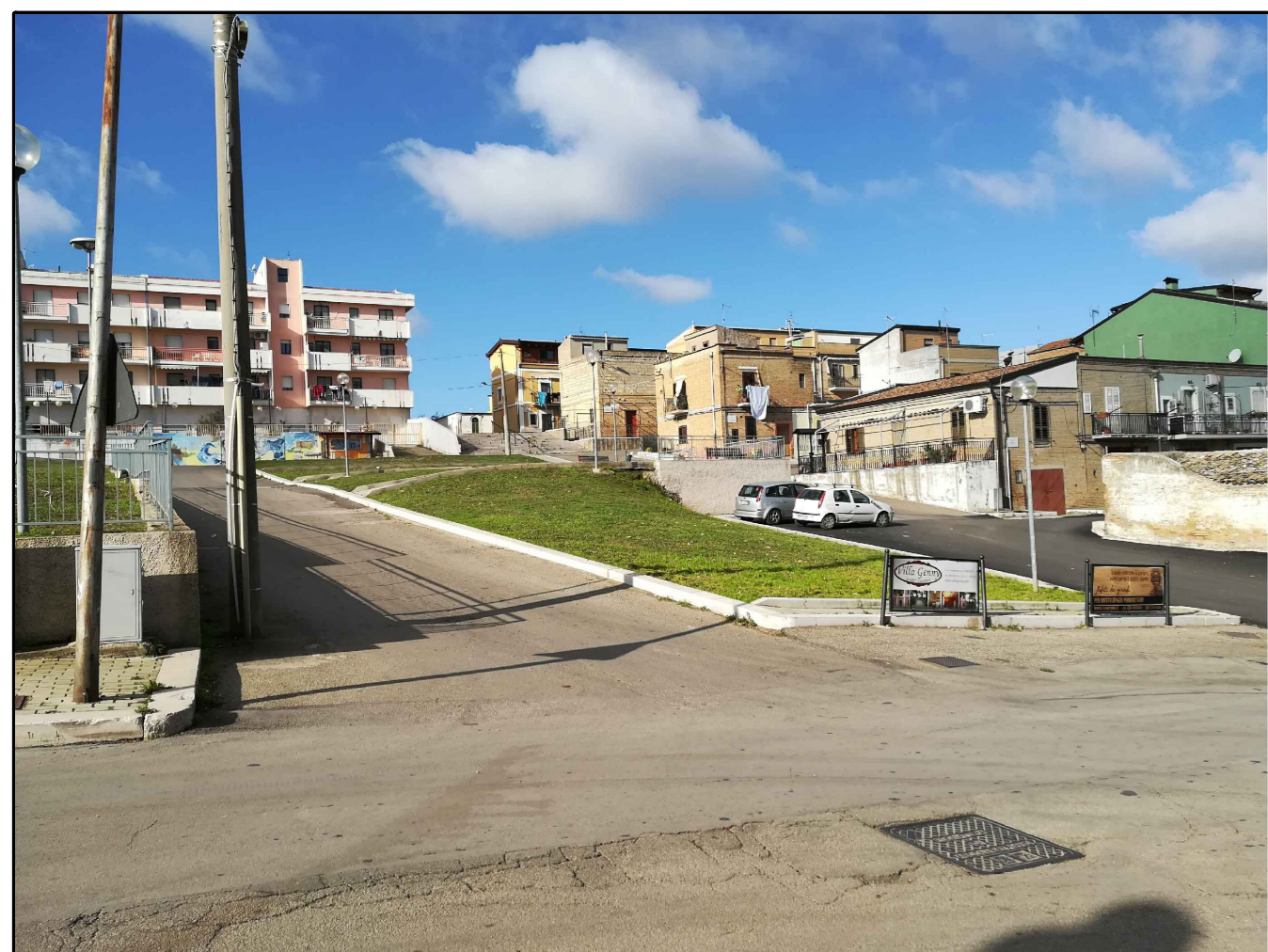
Scatto n. 1 ante operam