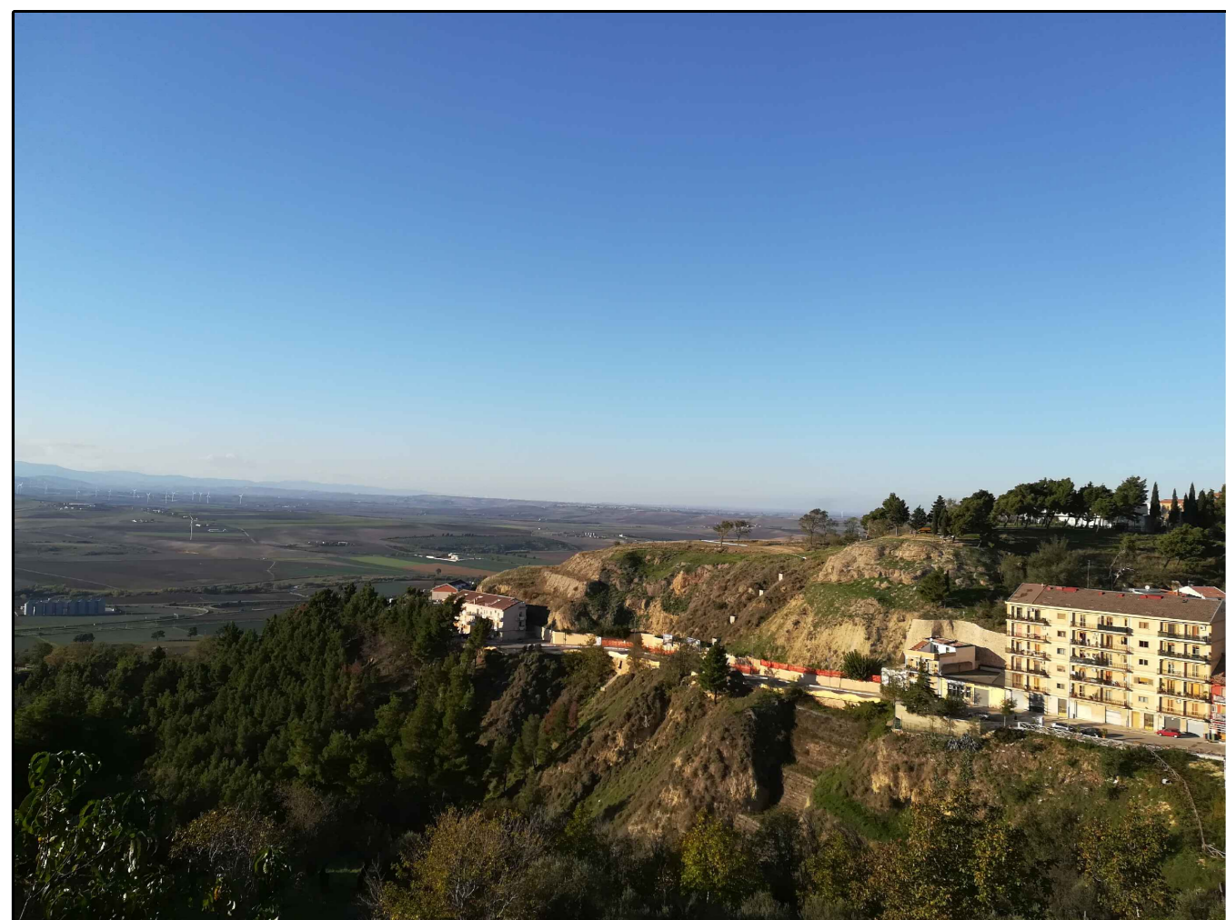
Scatto n. 5 ante operam