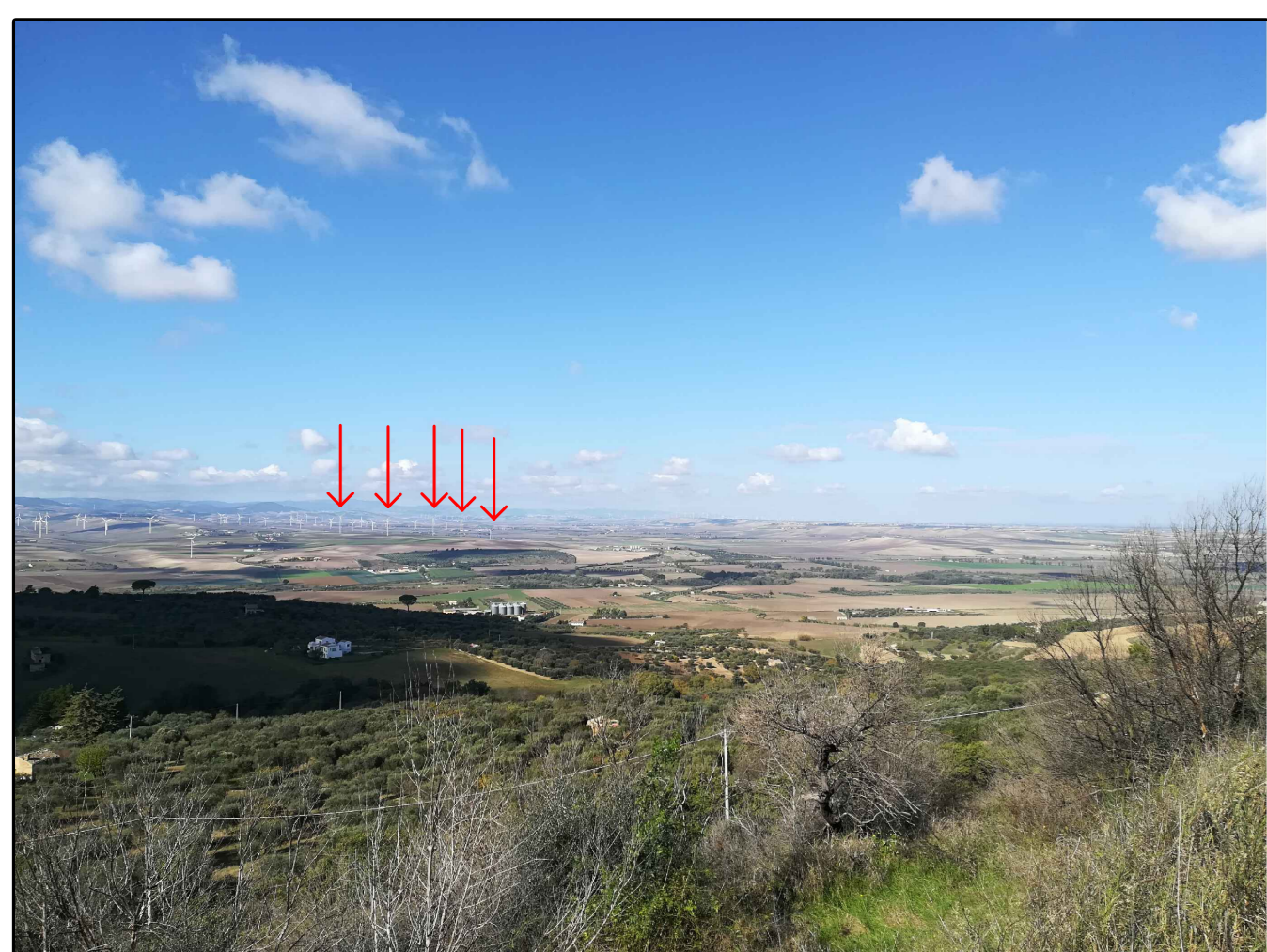
Scatto n. 6 post operam