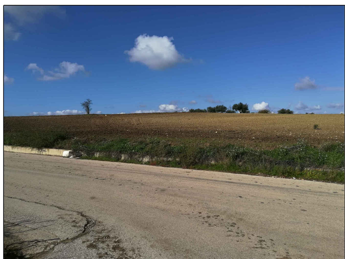
Scatto n. 7 ante operam