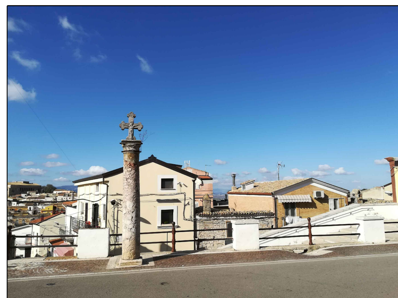
Scatto n. 4 ante operam