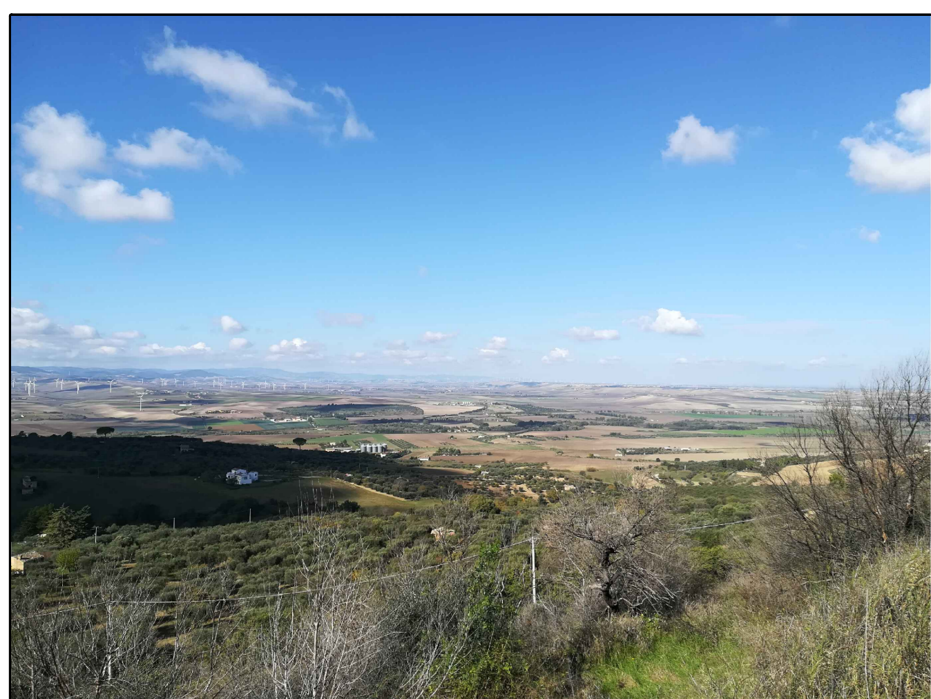
Scatto n. 6 ante operam