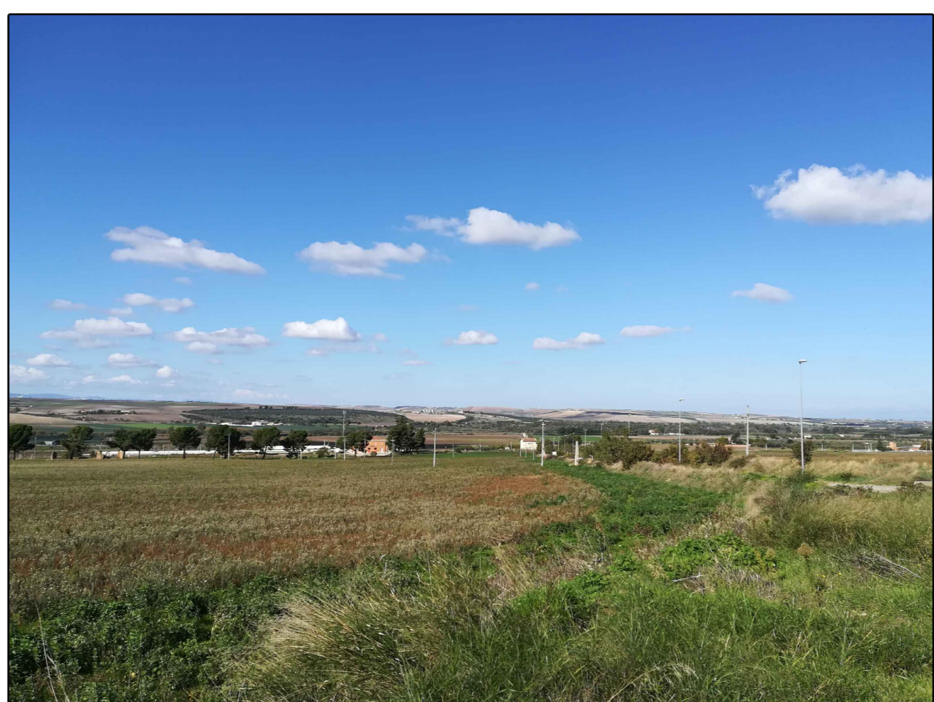
Scatto n. 8 ante operam