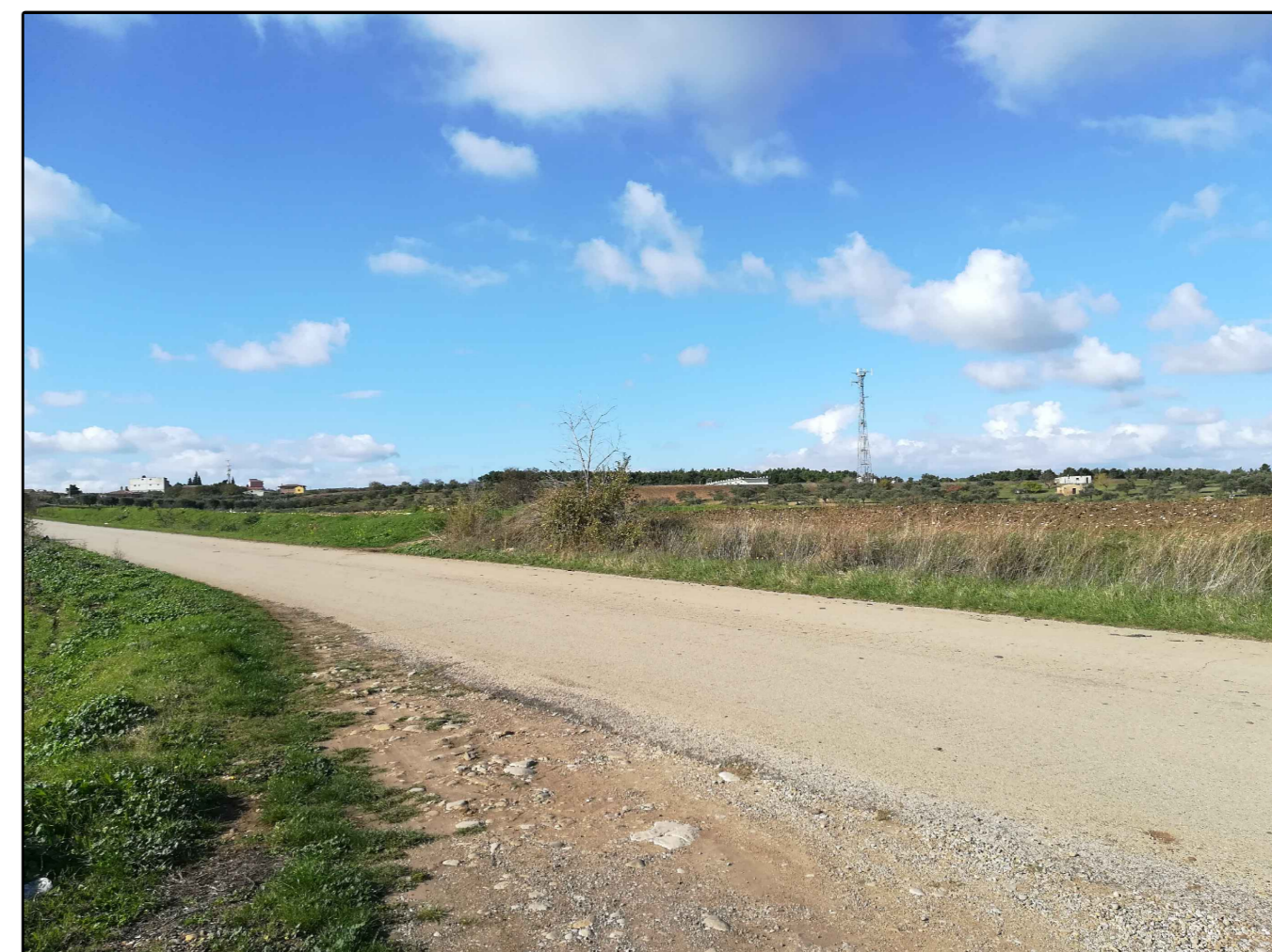
Scatto n. 3 ante operam