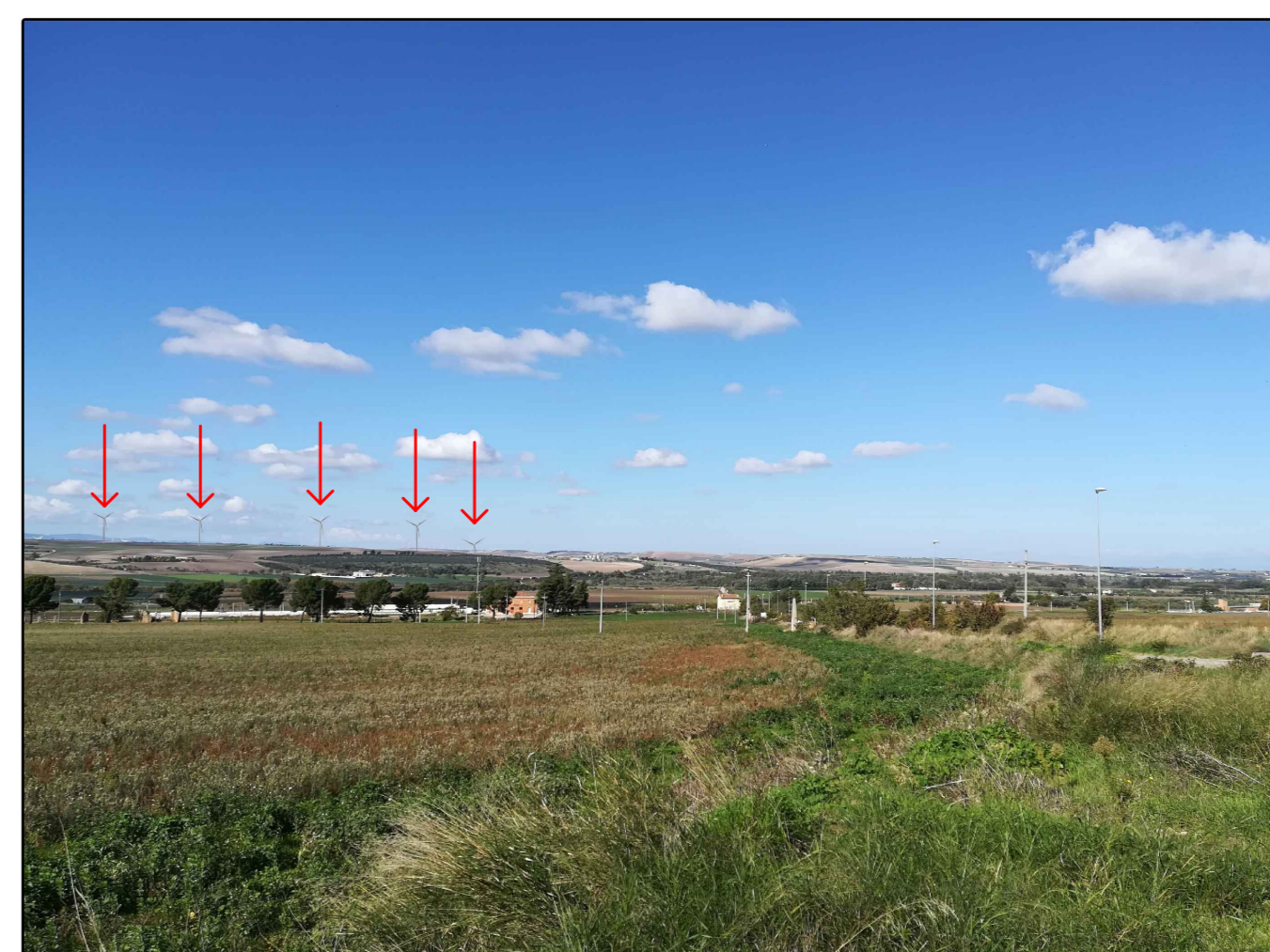
Scatto n. 8 post operam