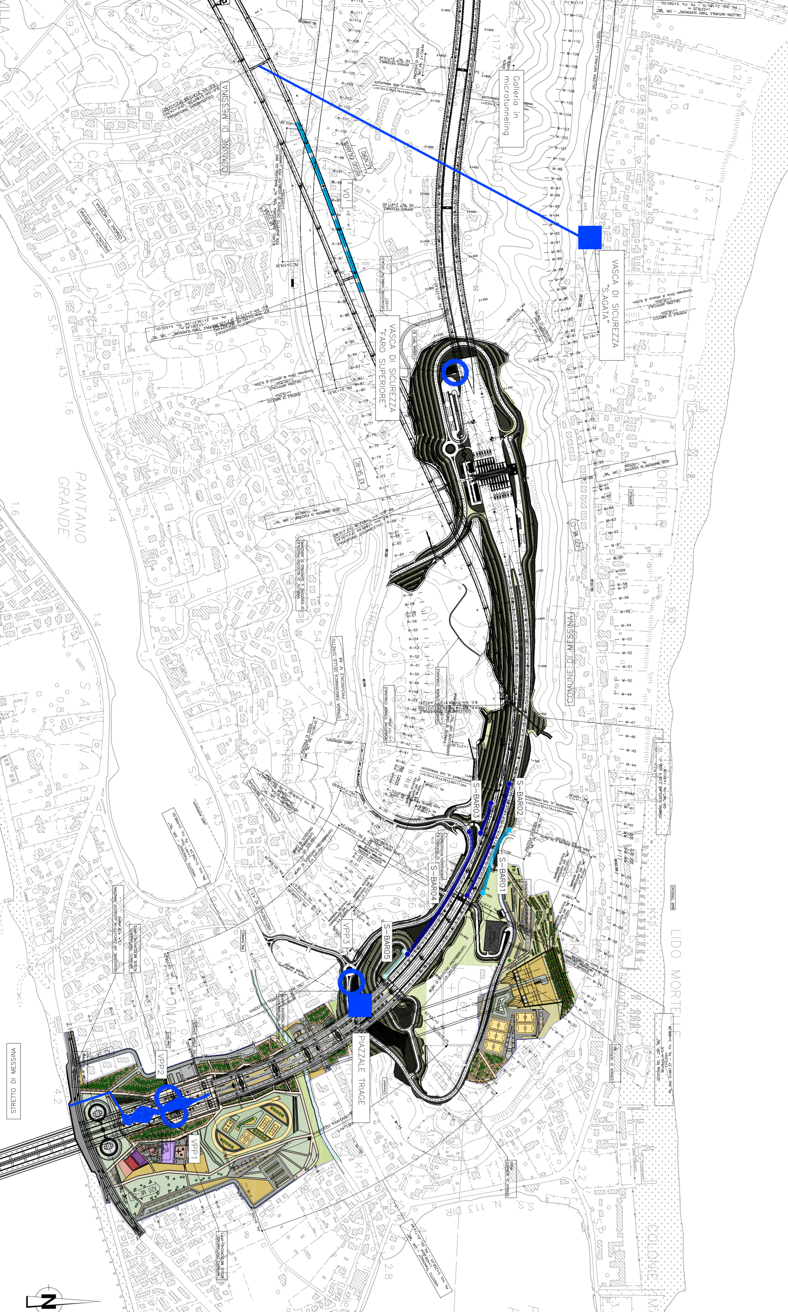
MITIGAZIONI DEL CANTIERE IN FASE DI COSTRUZIONE DELL'OPERA - SCALA 1:2000 CANTIERE S12 - FARO SUPERIORE