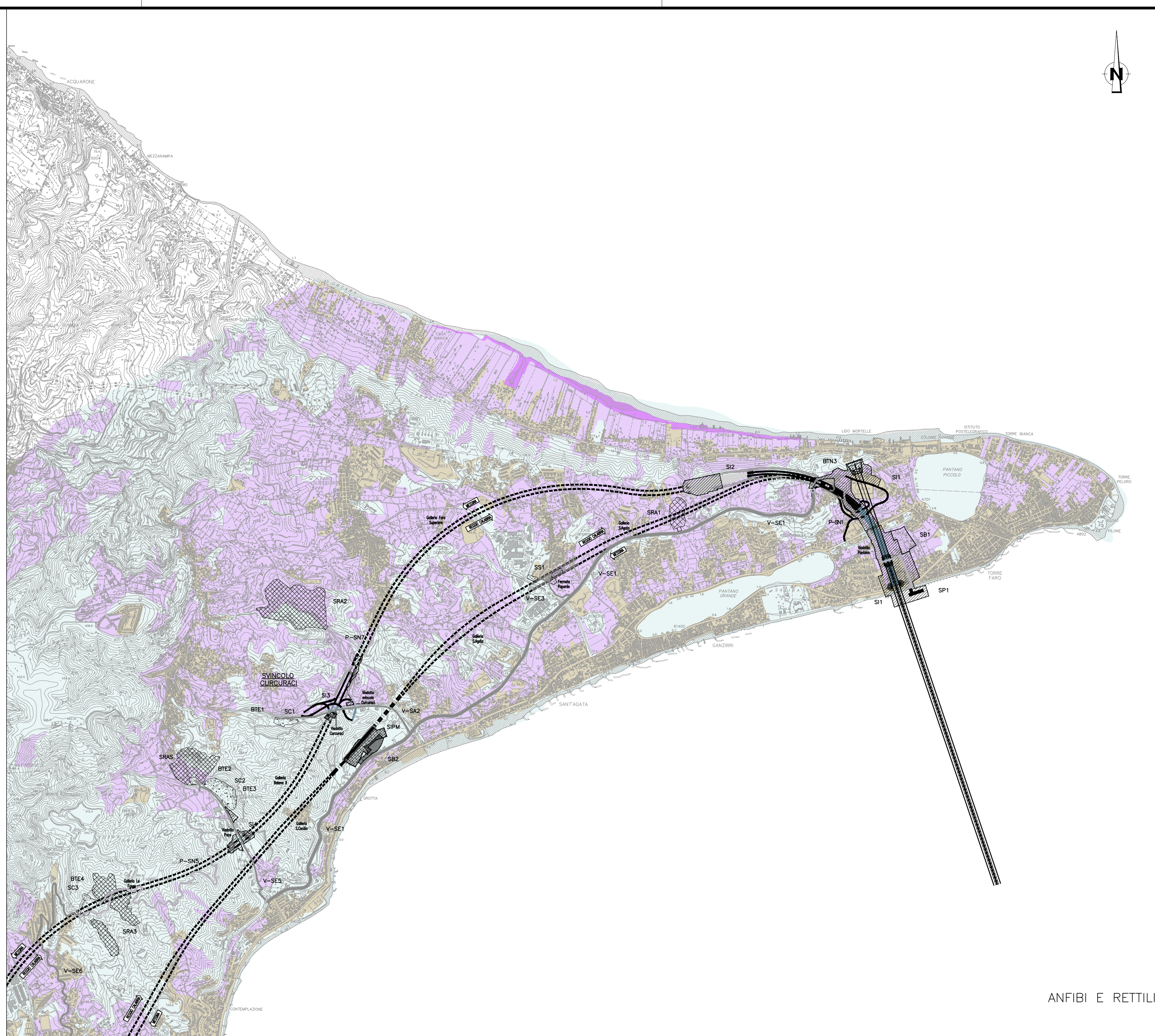
ANFIBI E RETILI