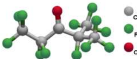
Figure 1: Struttura Chimica del Fluido FK-5-1-12

Il Fluido FK-5-1-12 costituisce una nuova classe di agenti chimici puliti. Essendo un Fluoro-chetone, combina l'eccellente effetto estinguente del gruppo di agenti puliti (ad es. halofluorocarboni HFCs oppure l'Halon 1301) con una vita media molto breve in atmosfera e pertanto un basso valore di GWP, dell'ordine di 1; esso, inoltre, non è sottoposto ad alcuna limitazione temporale per il suo impiego.