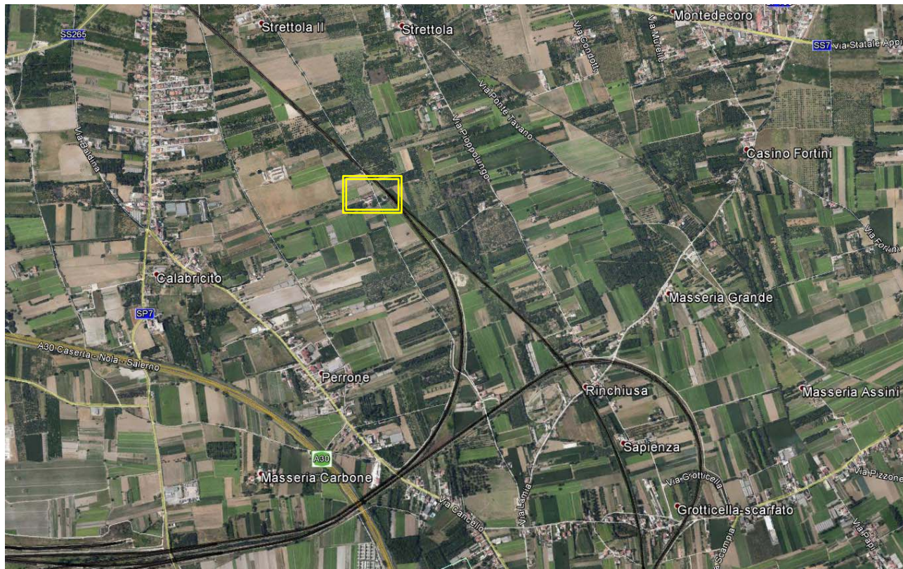
Localizzazione della sezione dei rilievi vibrazionali