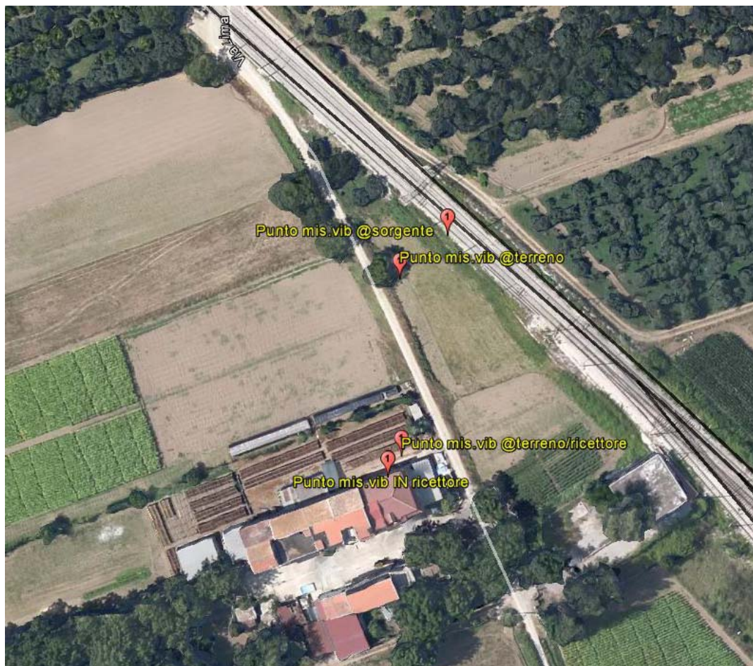
Localizzazione delle terne accelerometriche in corrispondenza della sezione dei rilievi vibrazionali

I valori dei livelli di accelerazione associati ai transiti dei convogli rilevati sperimentalmente si attestano su valori superiori a 70 dB lungo gli assi X e Y solo in corrispondenza delle terne poste in prossimità della linea ferroviaria, mentre lungo l'asse Z si attestano già a valori inferiori a 70 dB nei medesimi punti (valori ponderati secondo la Norma UNI 9614). A distanze maggiori (65m, in corrispondenza dell'edificio esaminato) i valori dei livelli di accelerazioni si attestano a circa 70 dB lungo gli assi X e Y ed a circa 55 lungo l'asse Z.