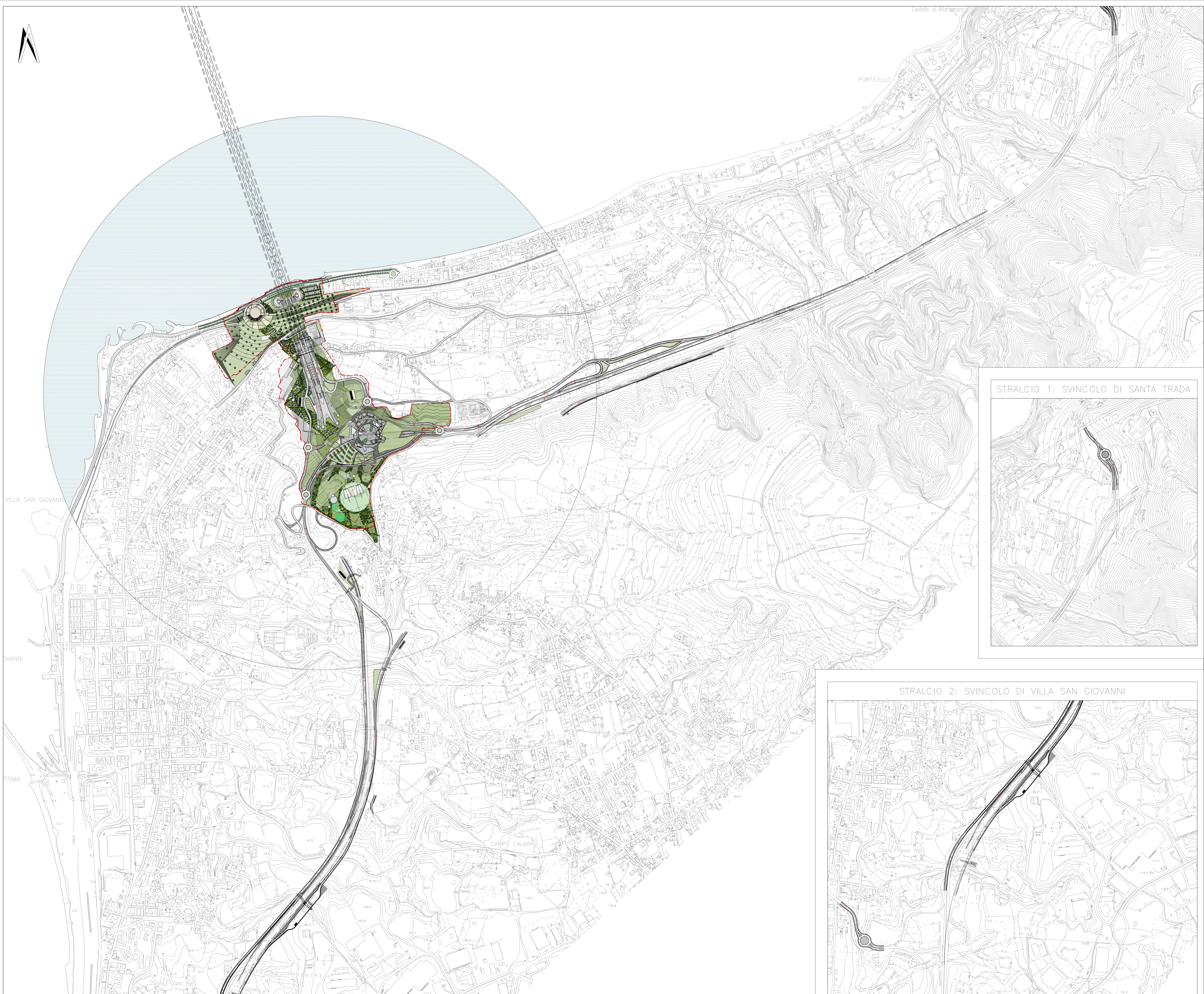
STRALCIO 1: SVINCOLO DI SANTA TRADA