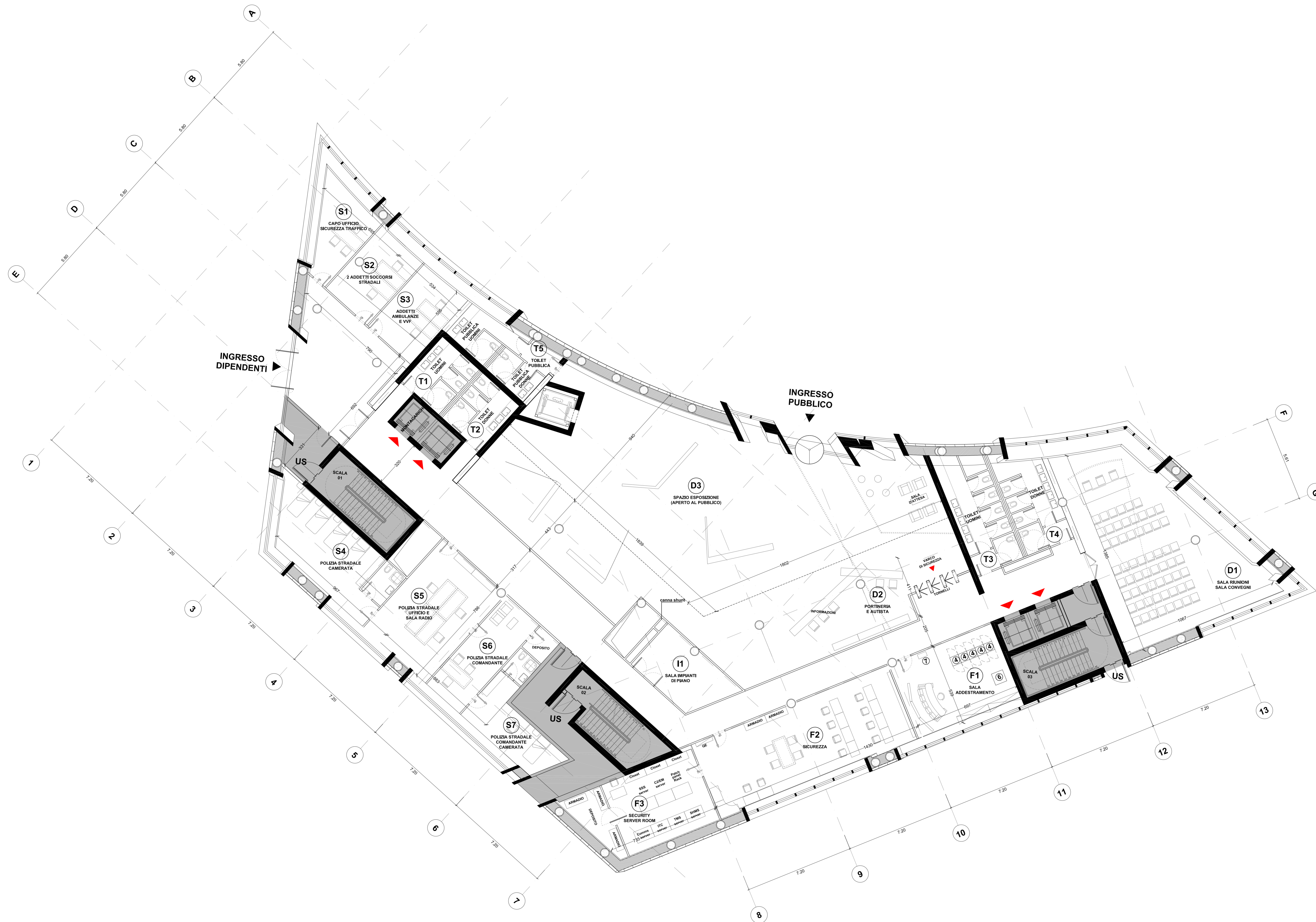
01 PIANTA PIANO TERRA (+100.60)