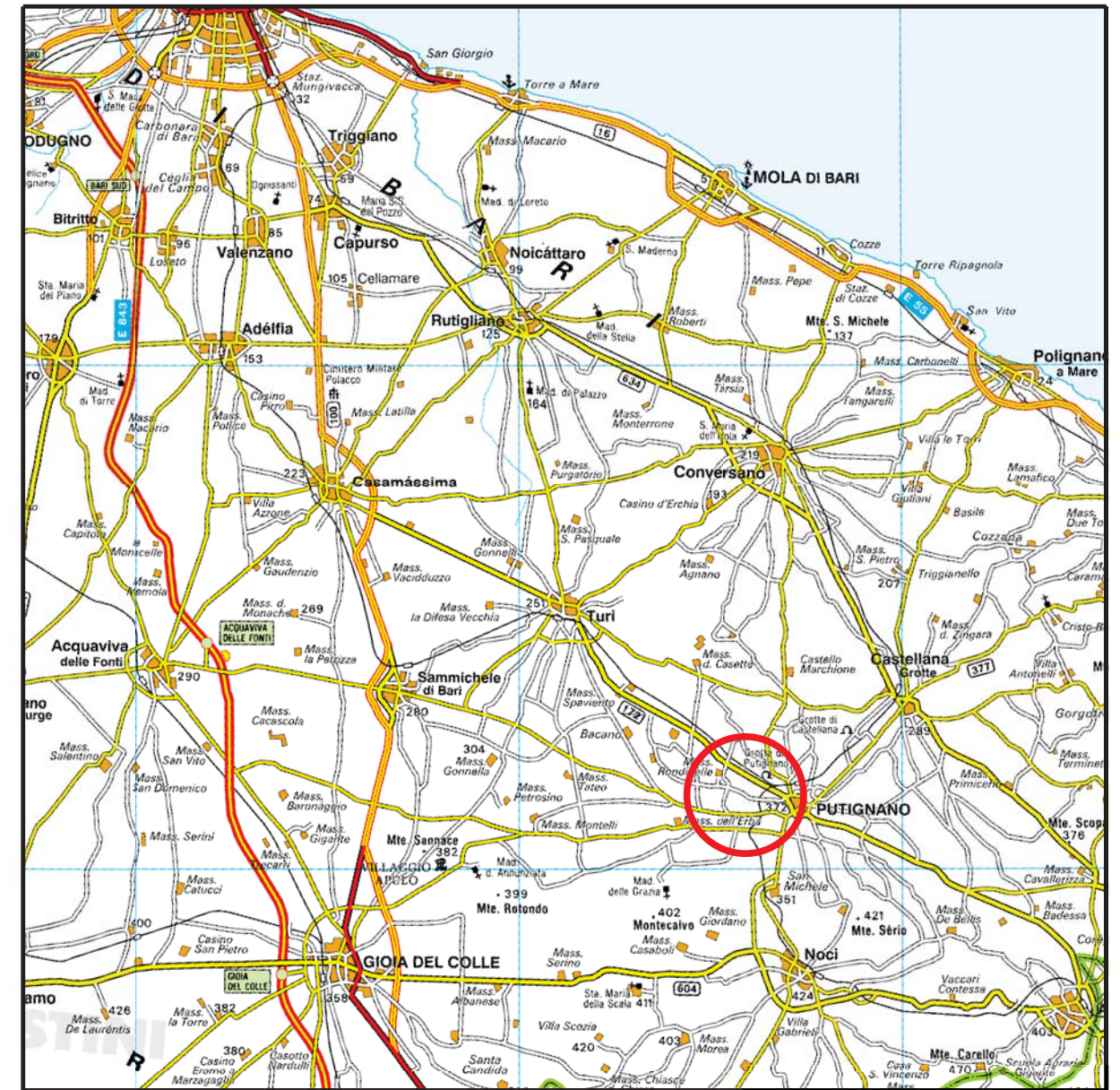
Cartografia IGM Scala 1:250.000