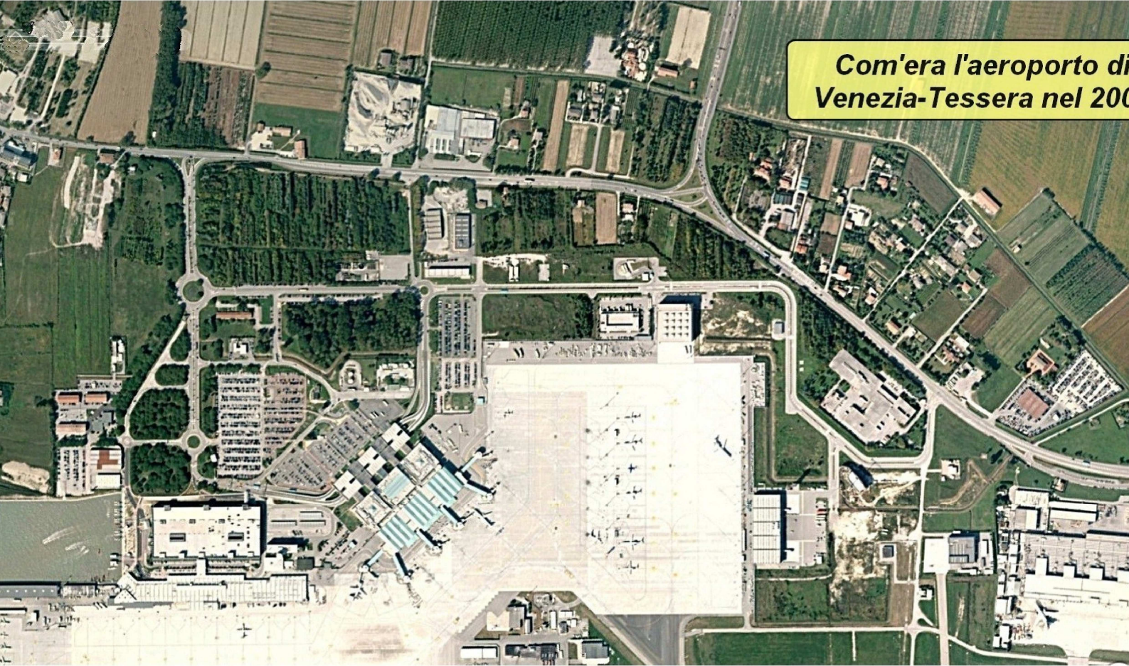
Immagine da Google Earth Pro

Com'era l'aeroporto di Venezia-Tessera nel 2000