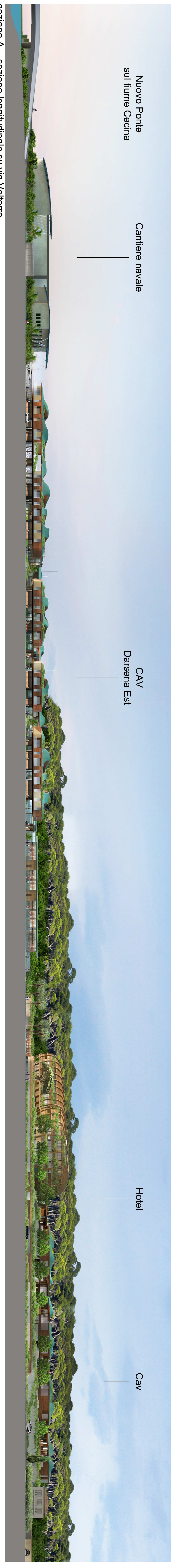
sezione A - sezione longitudinale su via Volterra