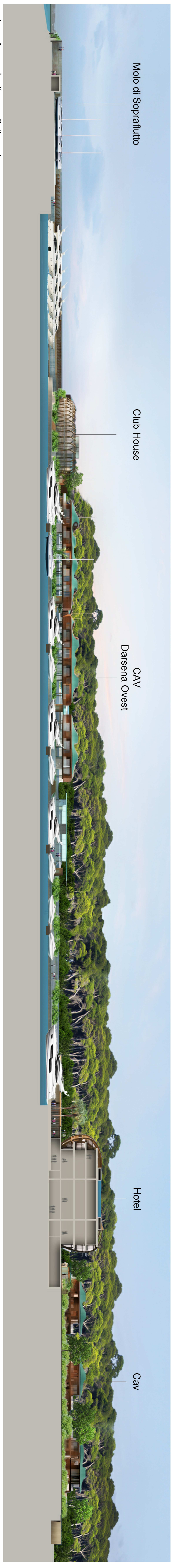
sezione A - molo di sopraflutto e darsena