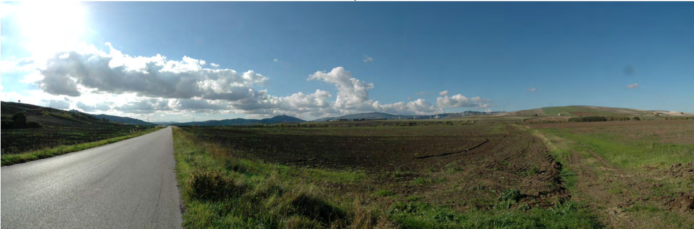
Punto di presa 5