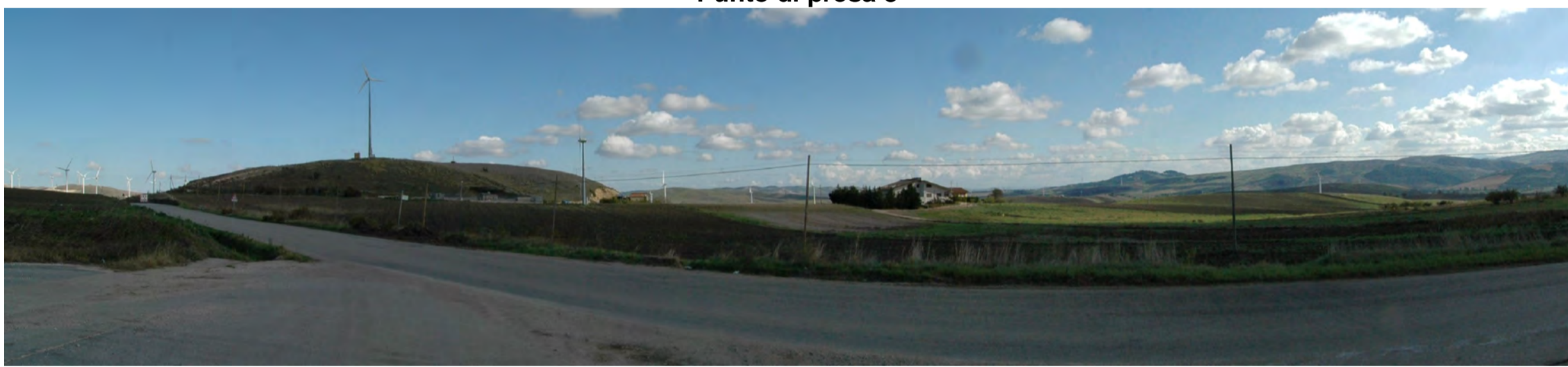
Punto di presa 9