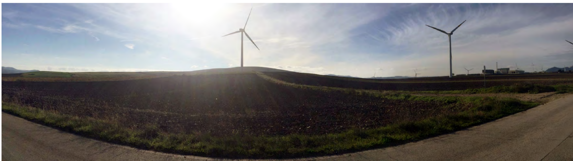
Punto di presa 11