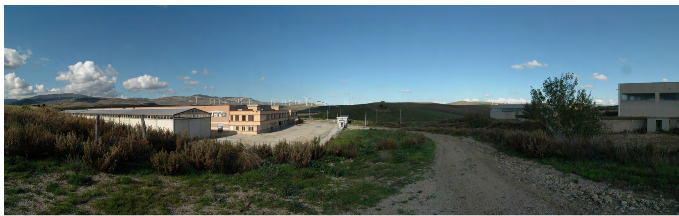
Punto di presa 7