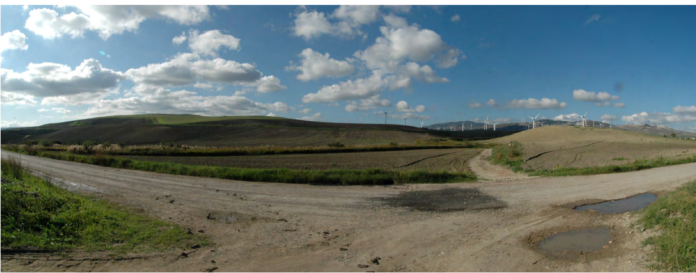
Punto di presa 1