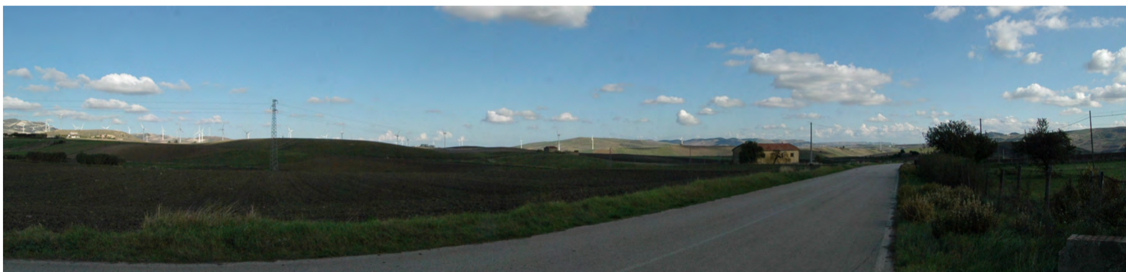
Punto di presa 10