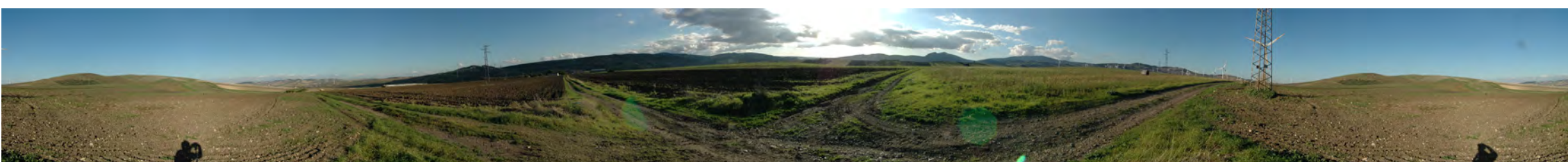
Punto di presa 6