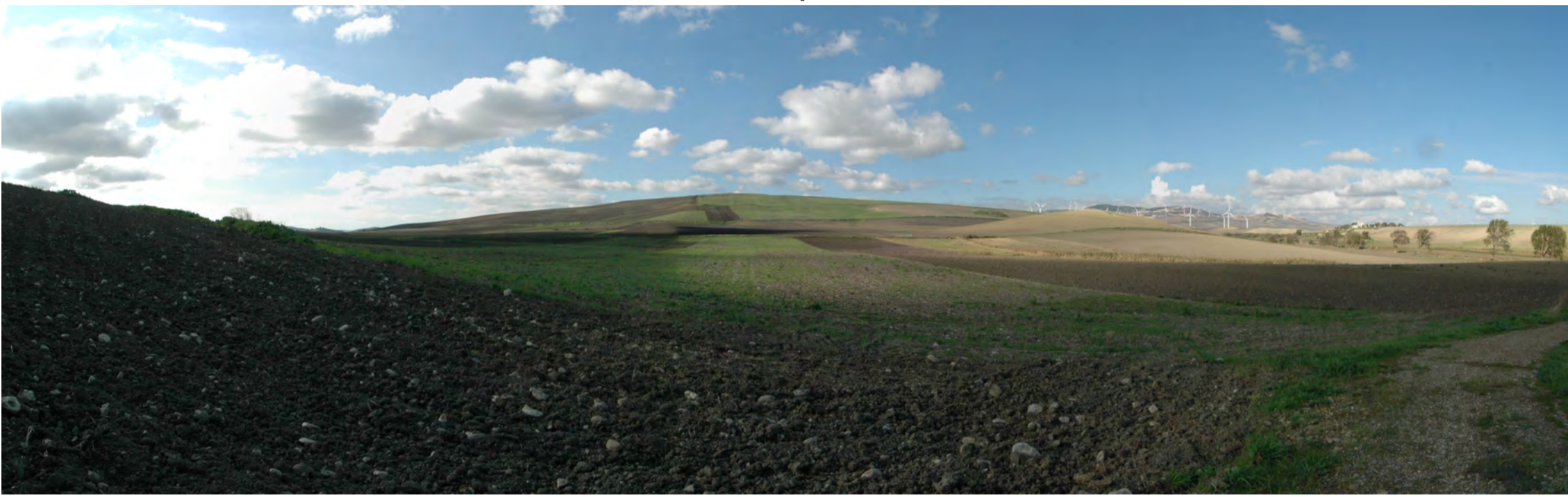
Punto di presa 2