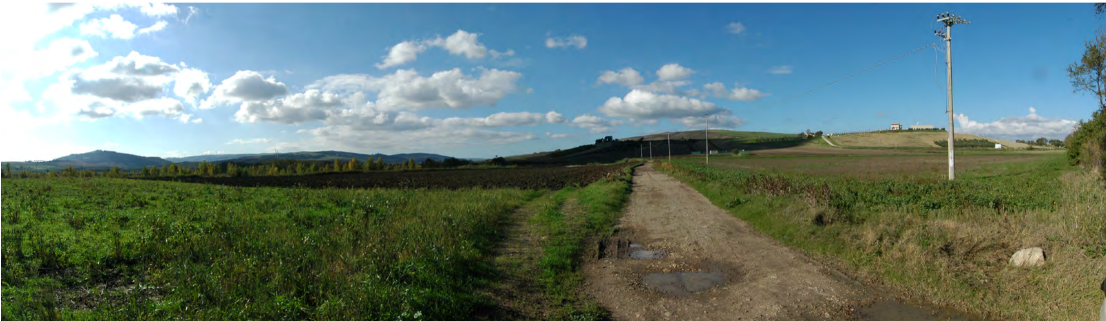
Punto di presa 3