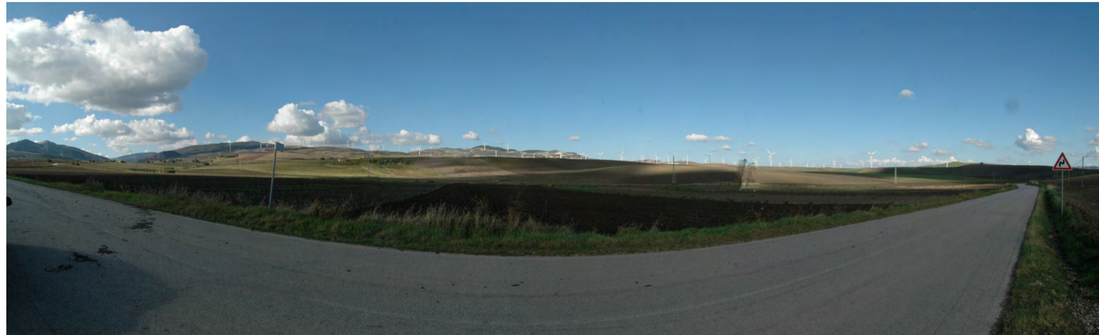
Punto di presa 8