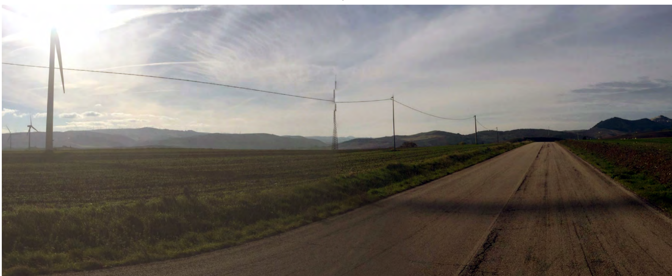
Punto di presa 12