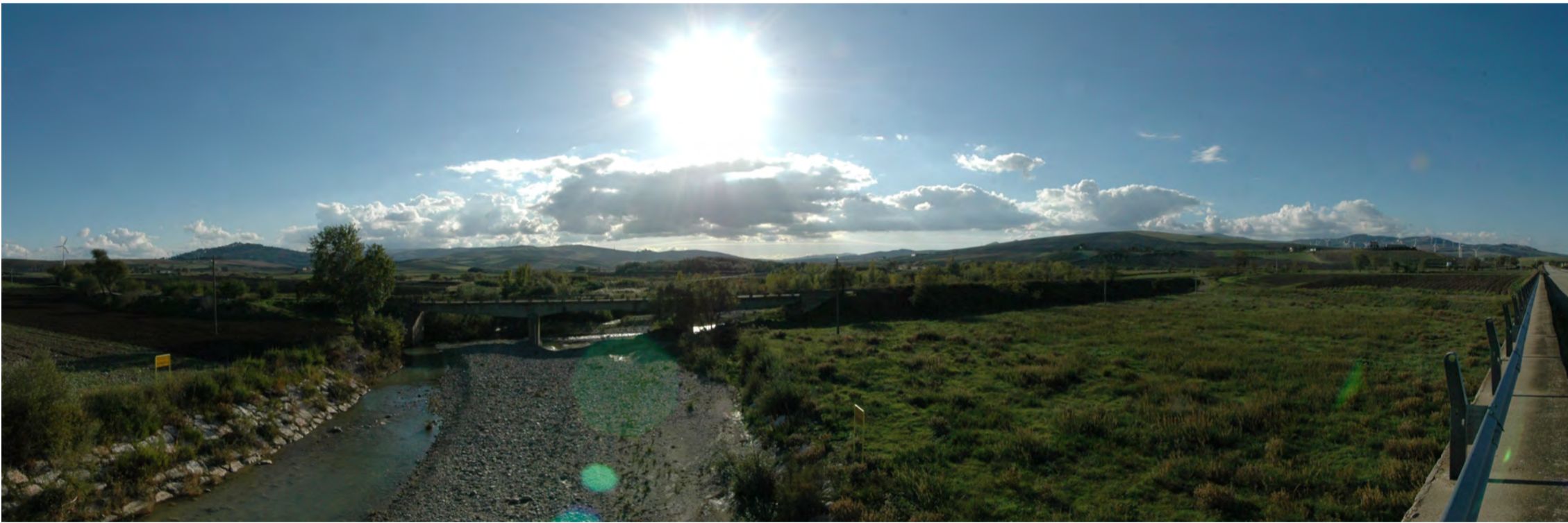
Punto di presa 4