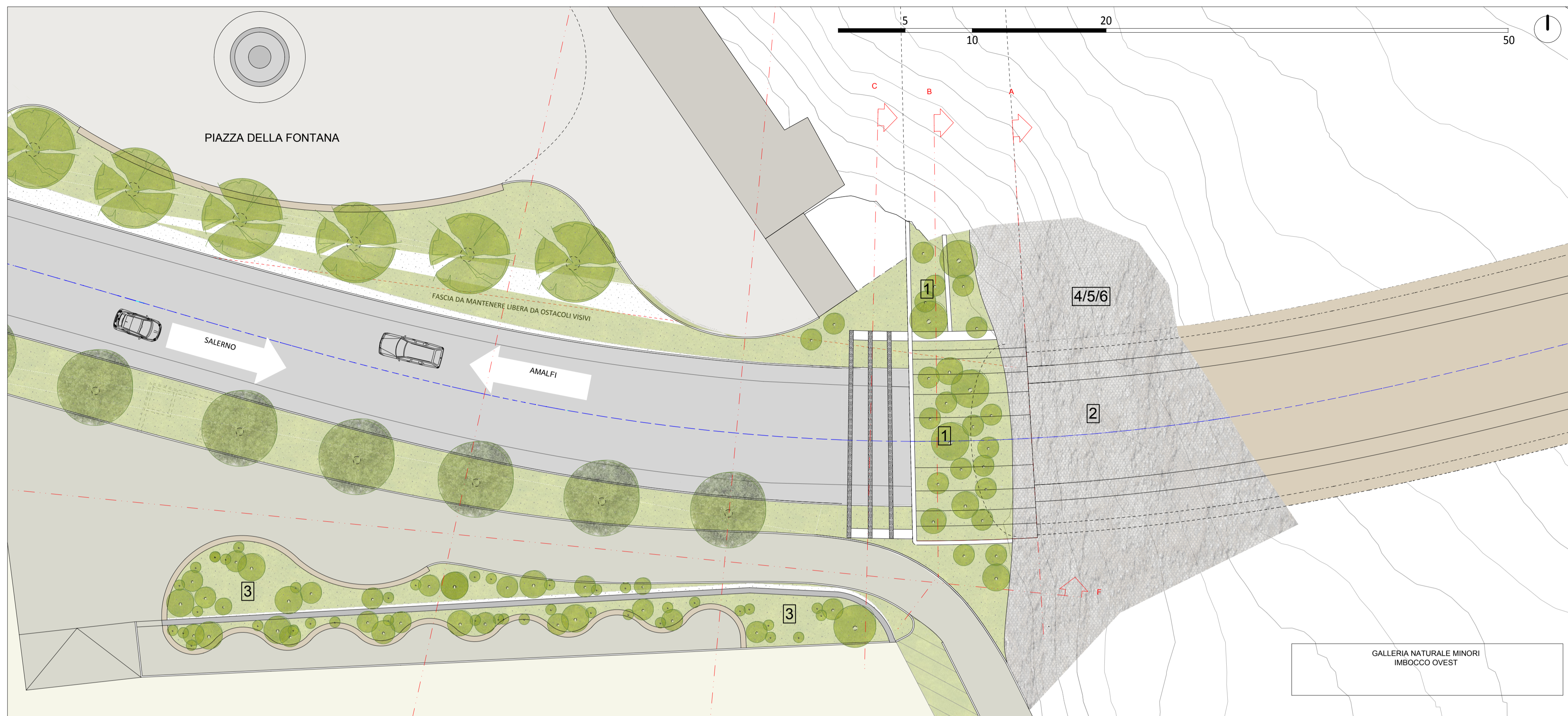
PLANIMETRIA PROGETTO IMBOCCO GALLERIA MINORI - SCALA 1:200