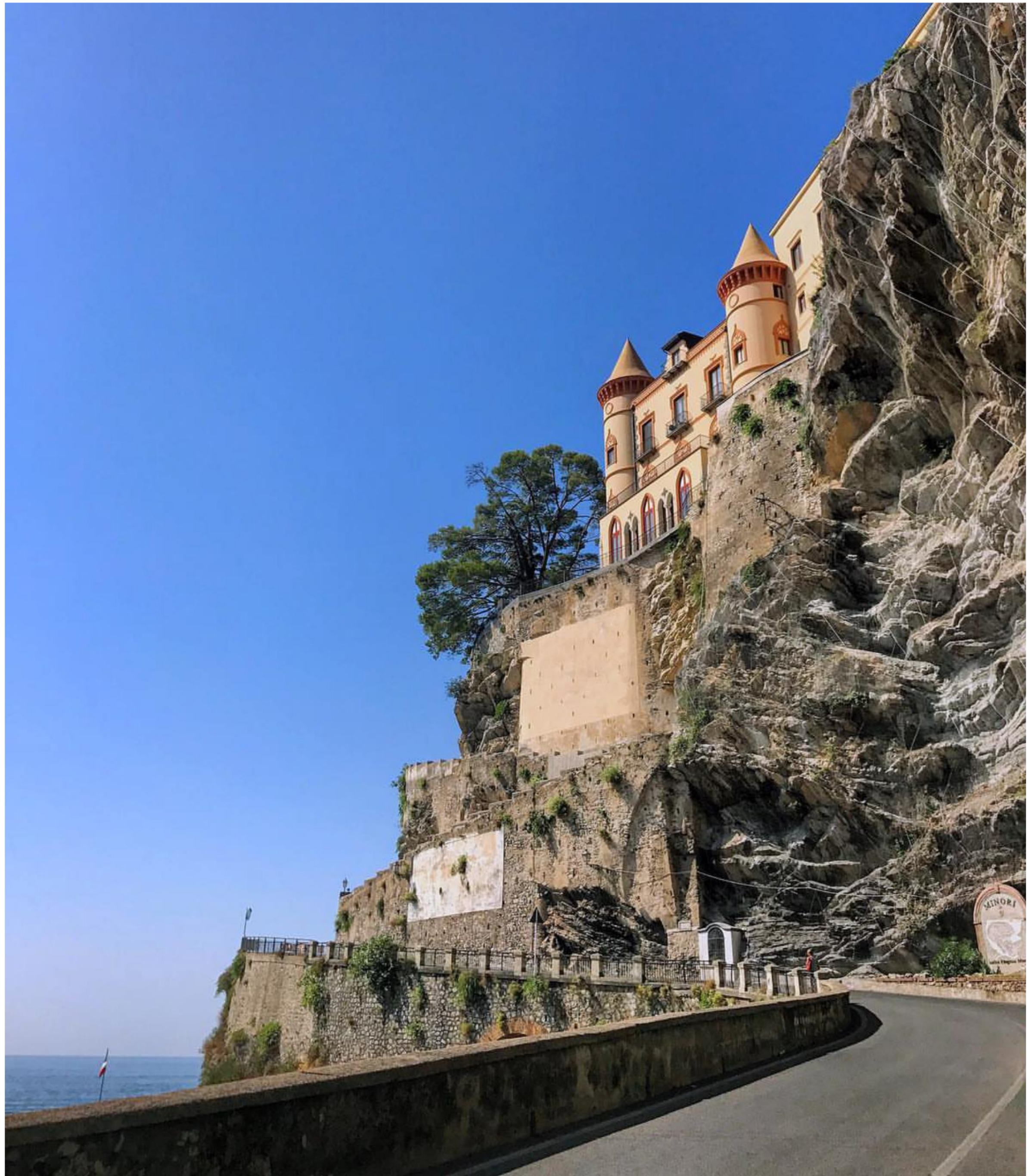
Fotoinserimento ciclo-pedonale - Anteoperam (1)