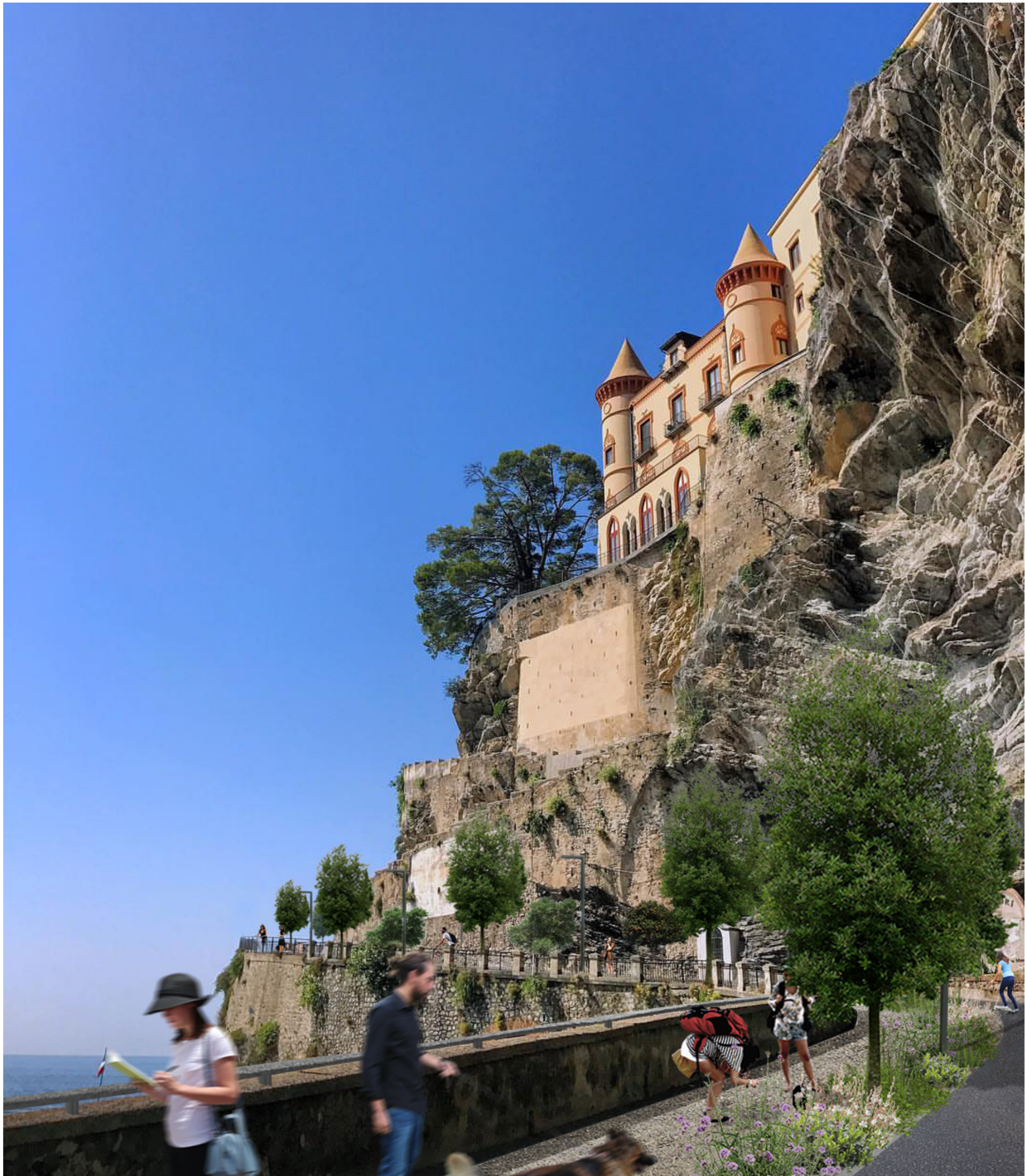
Fotoinserimento ciclo-pedonale - Postoperam (1)