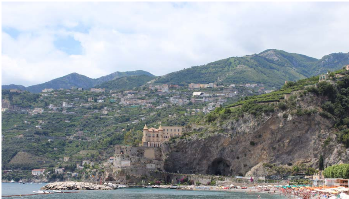
Foto 2 – UR1. Veduta del costone orientale dove è previsto l'ingresso della galleria di Minori. Si nota l'apertura della Grotta dell'Annunziata, sulla destra, ed il castello di Miramare che ha inglobato la torre di Mezzacapo, sulla sinistra.