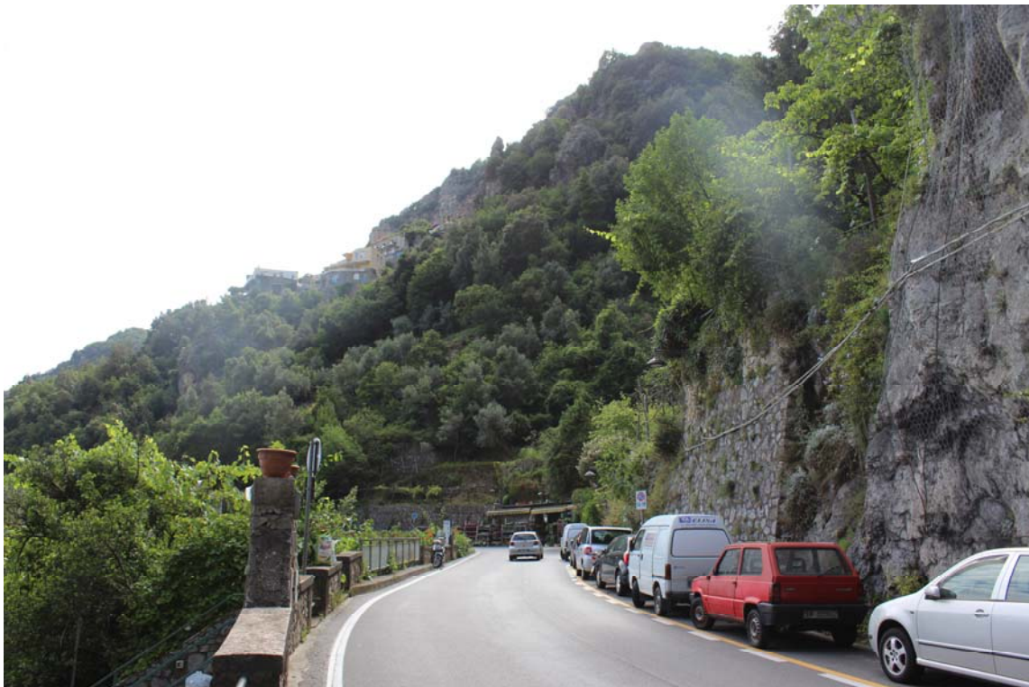
Foto 4 – UR 1. Veduta del punto di accesso della galleria di Minori.