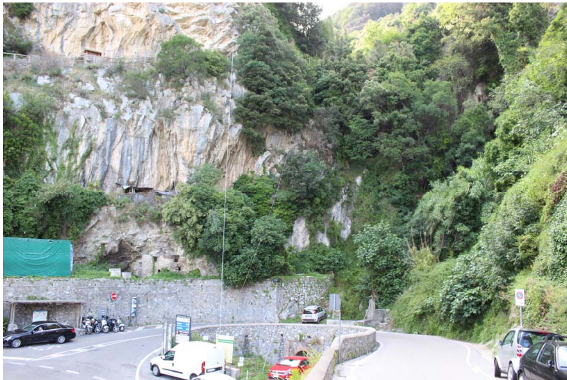
Foto 5 – UR1. Veduta del punto di uscita delle gallerie verso il centro abitato di Minori.