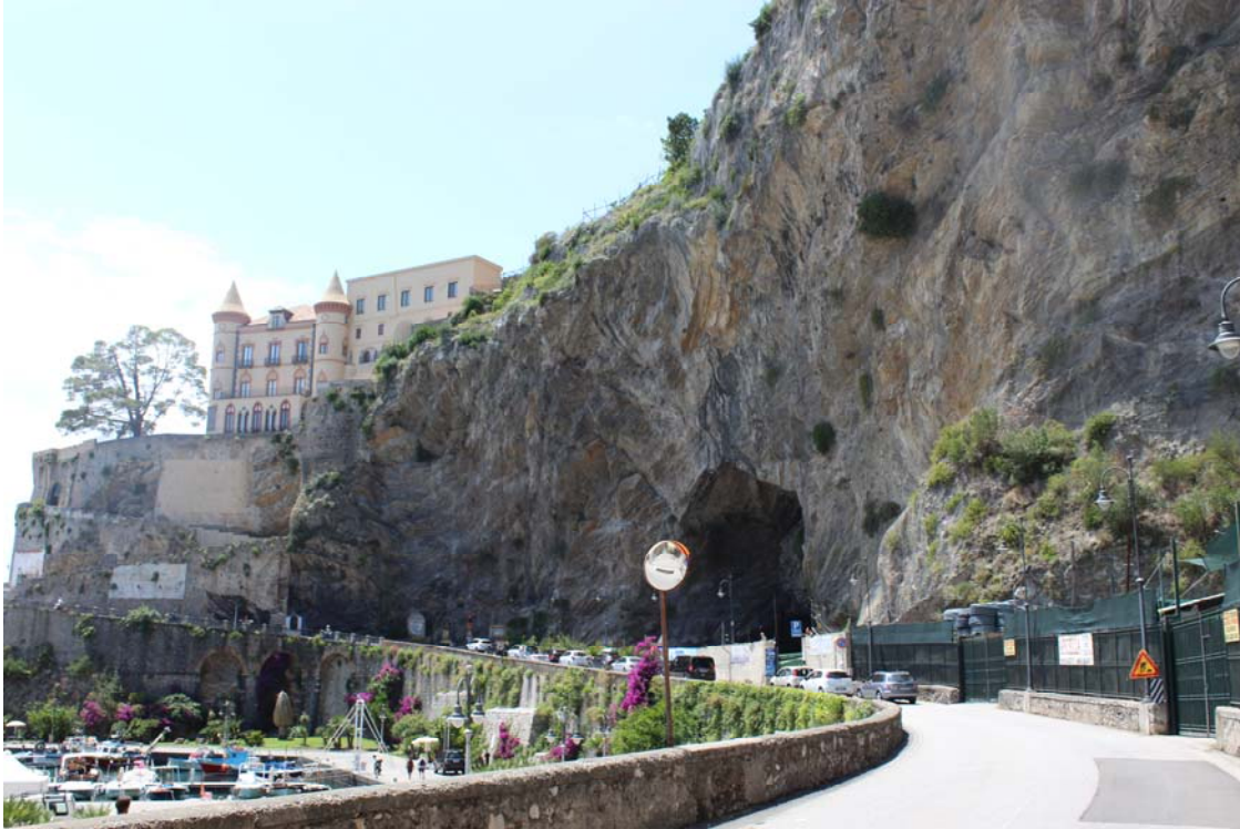
Foto 3 – UR1. Veduta dell'accesso alla Grotta dell'Annunziata (Presenza archeologica n. 17) dalla S.S. 163