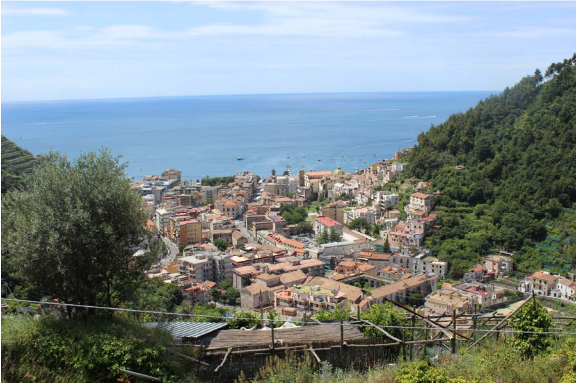
Foto 1 – Veduta del centro urbano di Maiori dal Castello di S. Nicola di Thoro Plana.