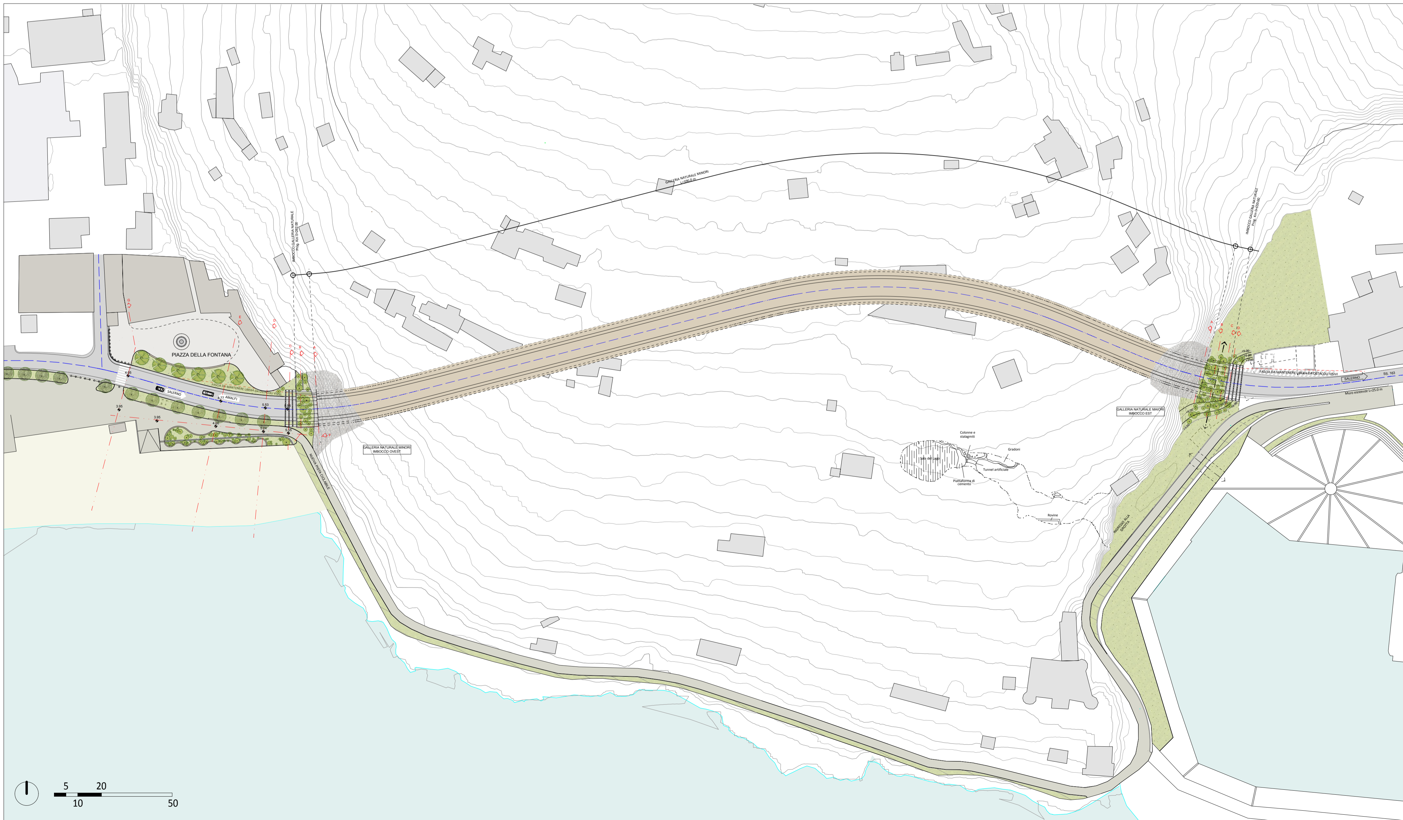
PLANIMETRIA GENERALE PROGETTO - SCALA 1:1000