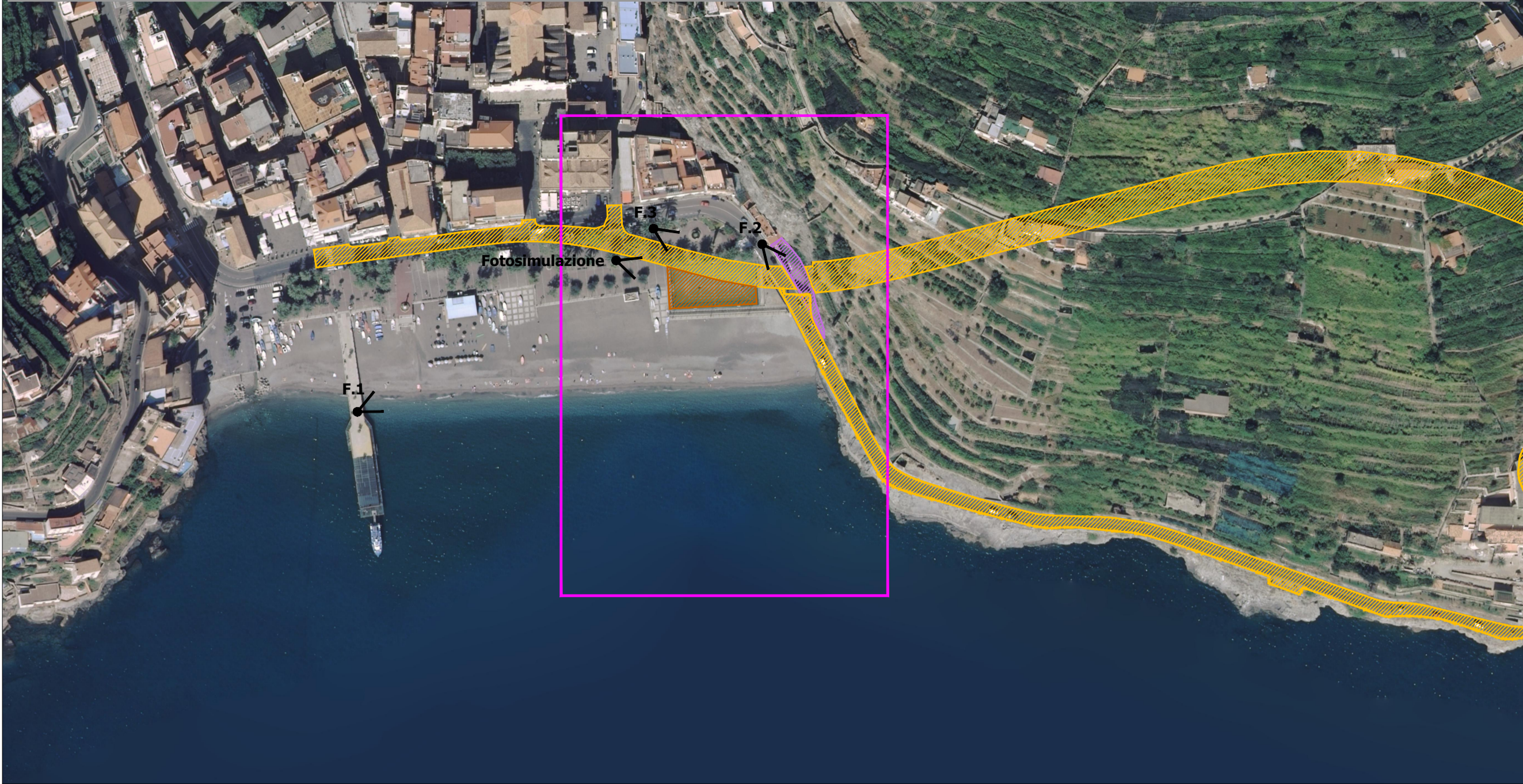
Planimetria su ortofoto con ubicazione aree di cantiere - Scala 1:2.000