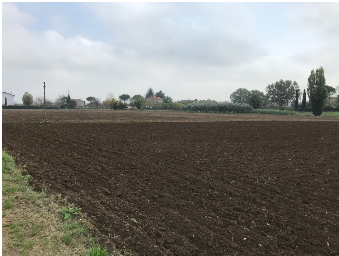
Figura 18 - UR14