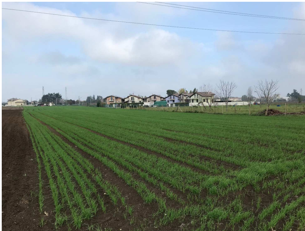
Figura 10 - UR08