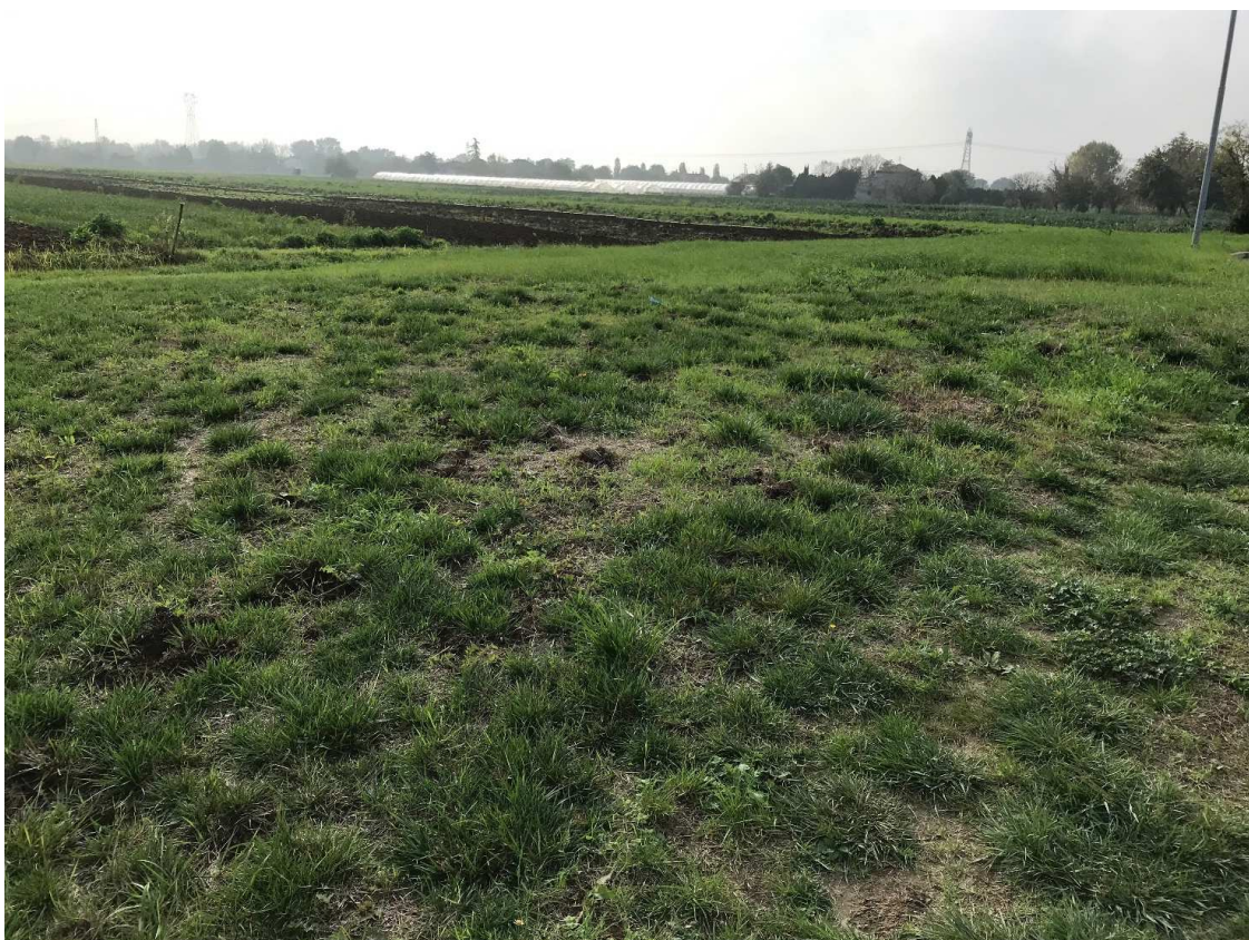
Figura 5 – UR03