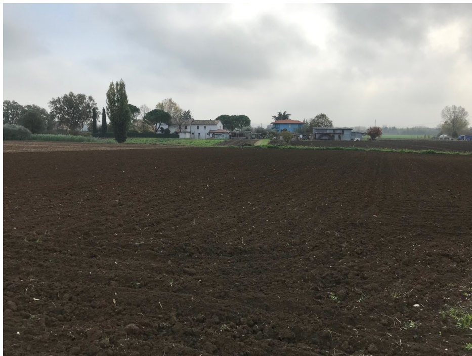
Figura 9 - UR07_2