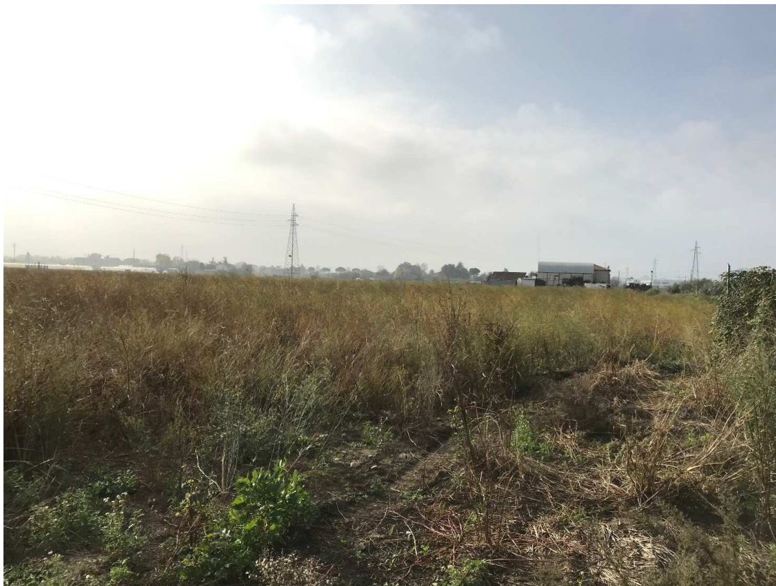
Figura 20 - UR16