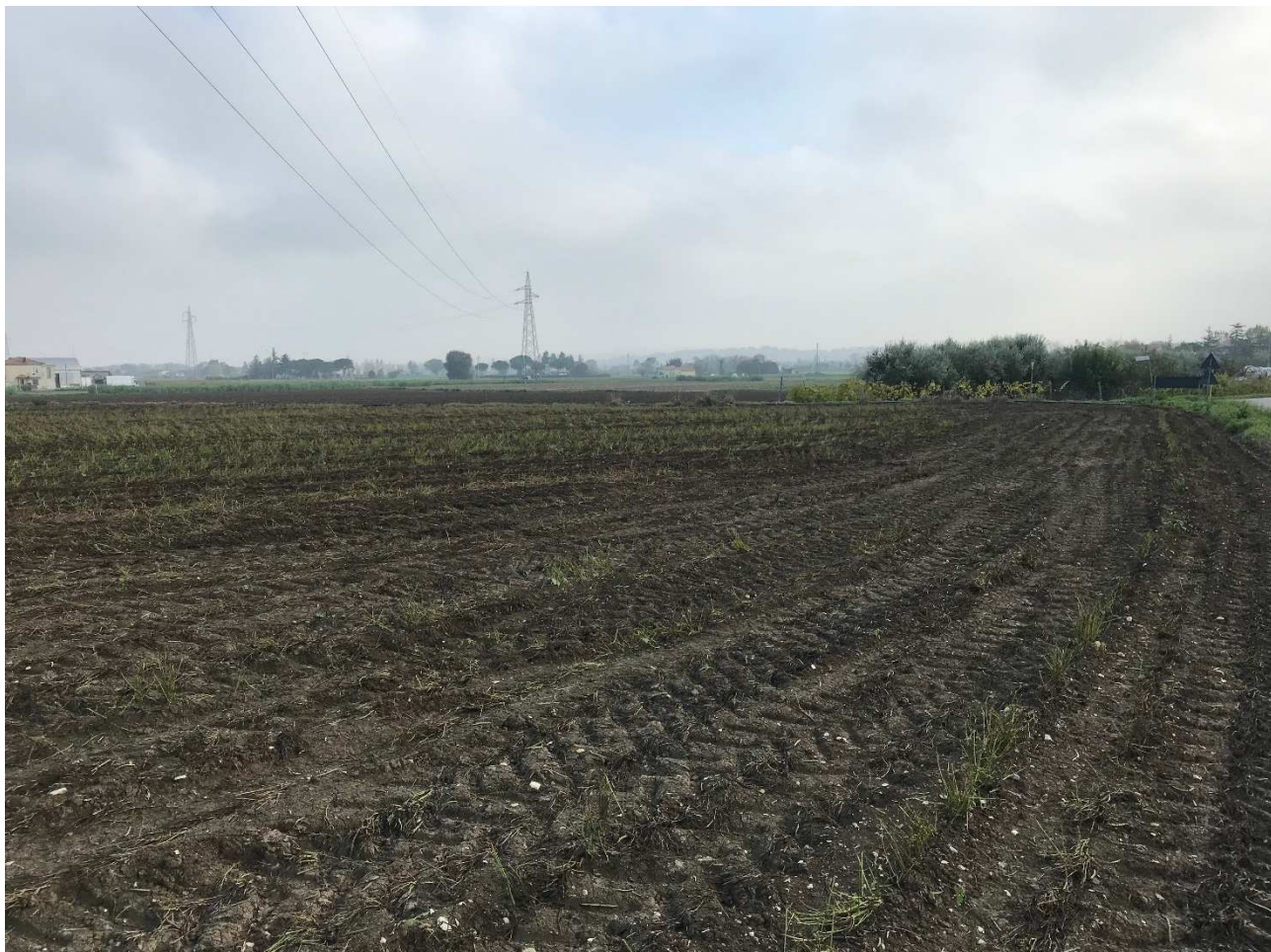
Figura 12 - UR09_2