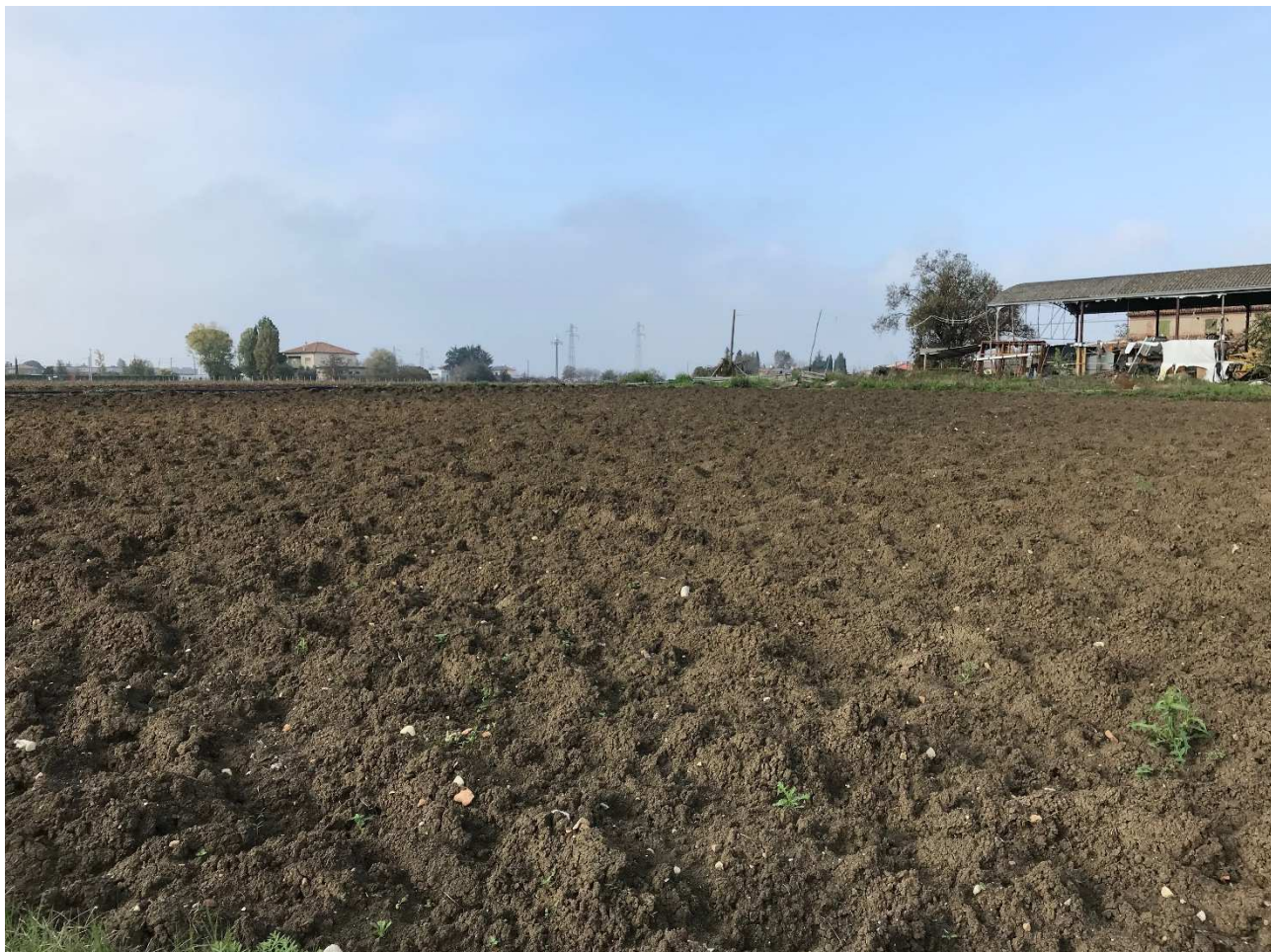
Figura 15 - UR11_2