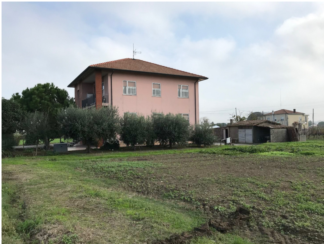
Figura 16 - UR12