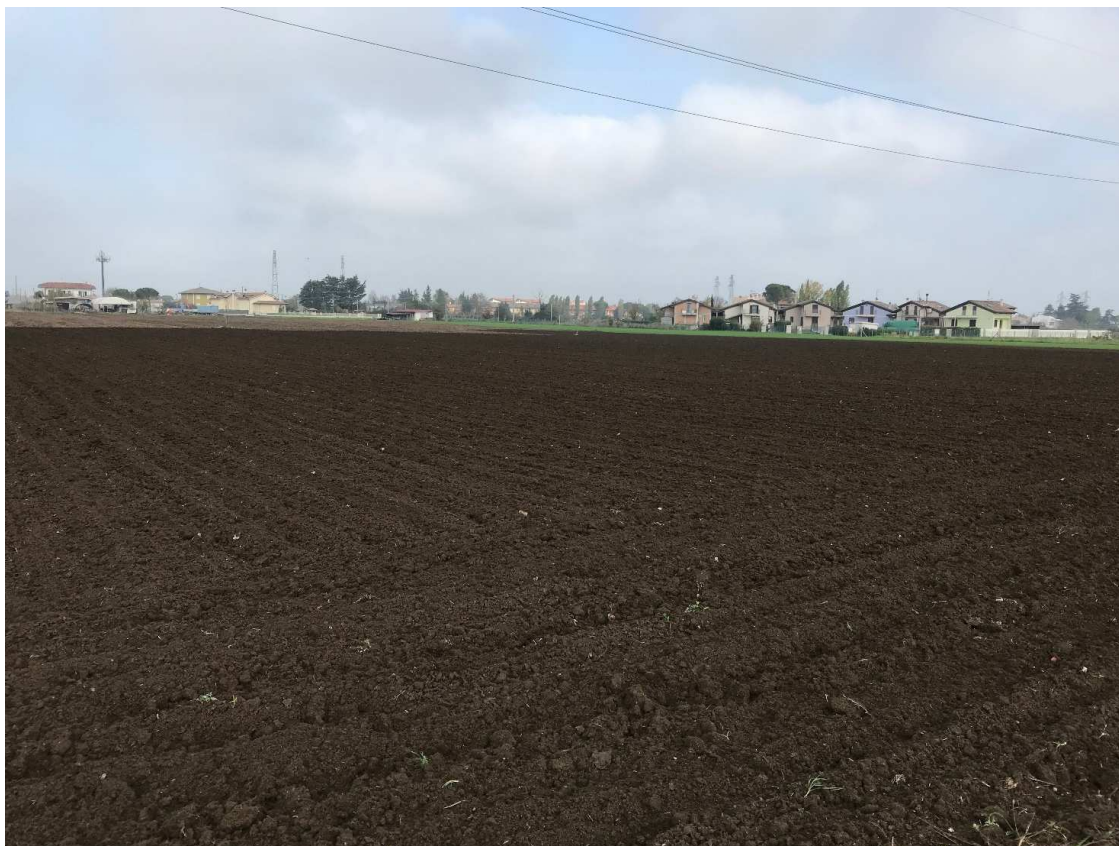
Figura 8 - UR07_1