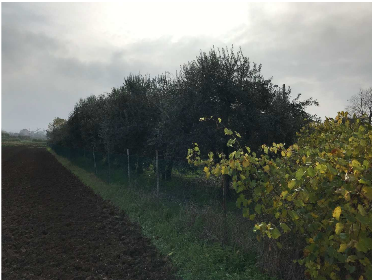
Figura 13 - UR10