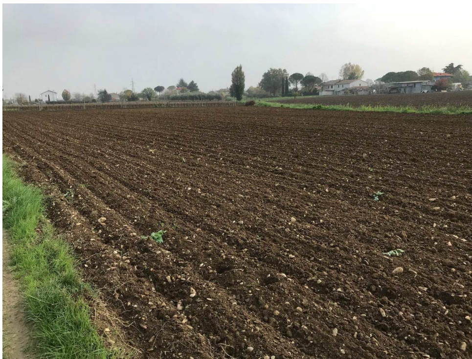
Figura 4 - UR02_2