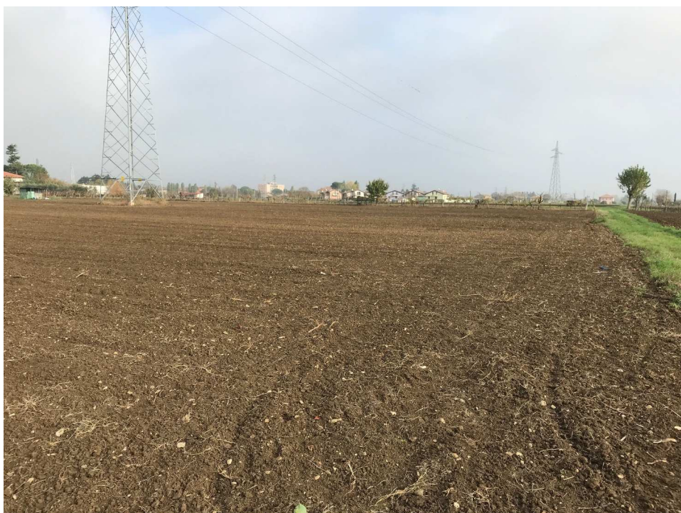
Figura 2 – UR01_2