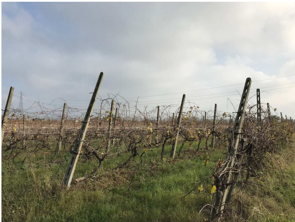
Figura 21 - UR17