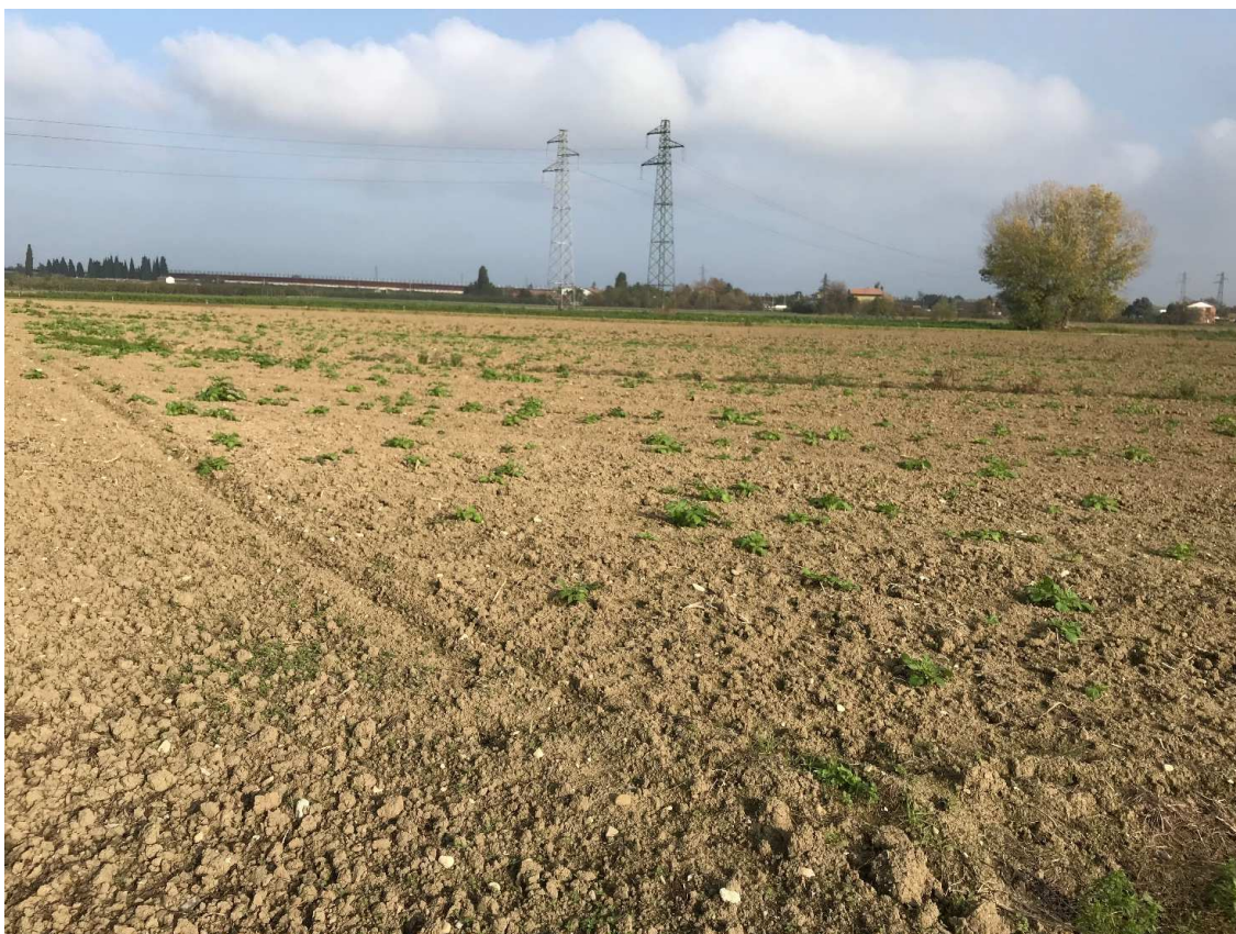
Figura 23 - UR19