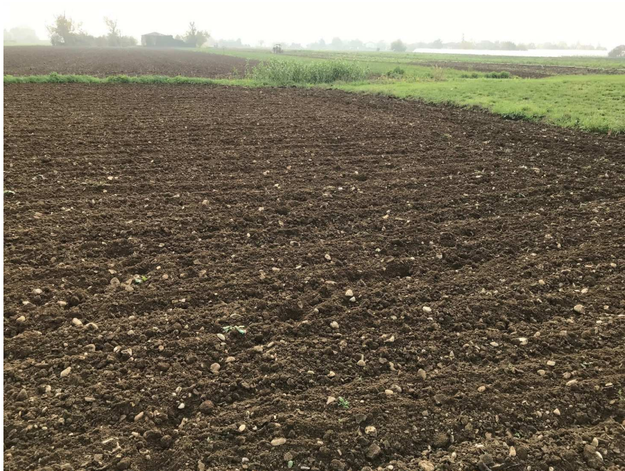
Figura 3 - UR02_1