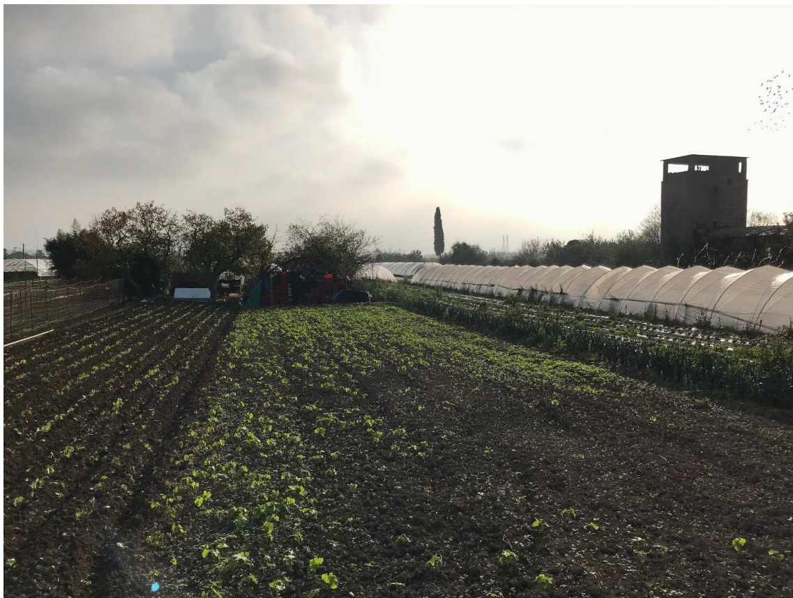
Figura 24 - UR20