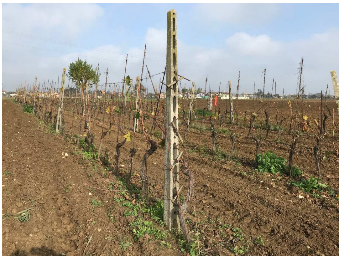
Figura 7 - UR06