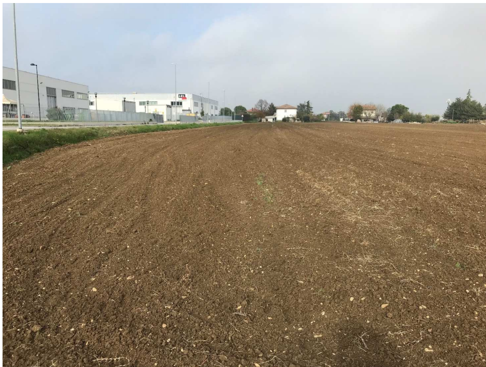
Figura 1 – UR01_1