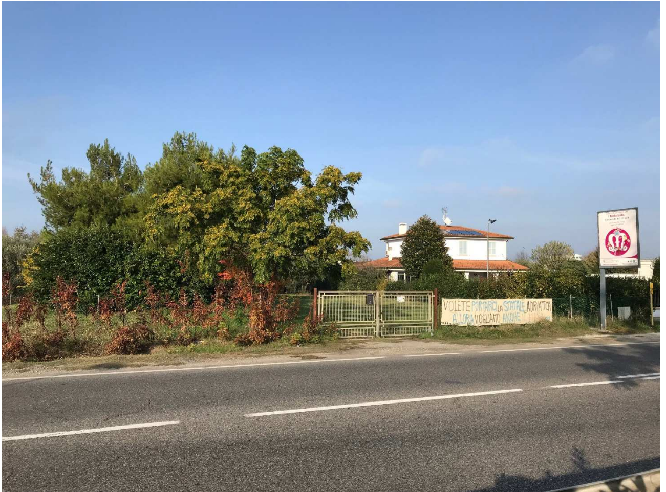
Figura 27 - UR23