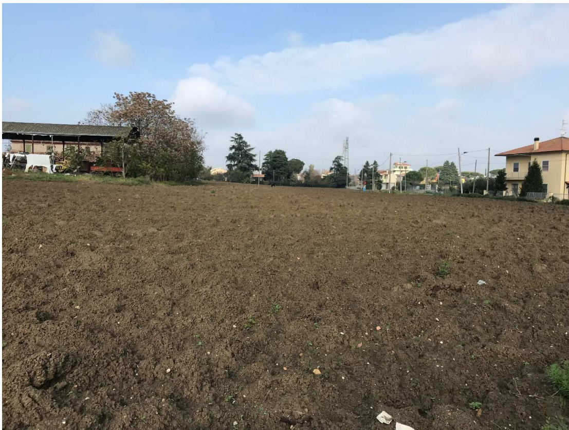
Figura 17 - UR13