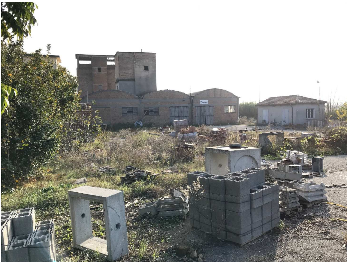
Figura 26 - UR22