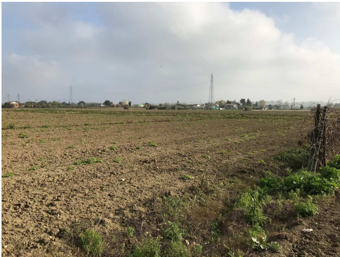
Figura 25 - UR21