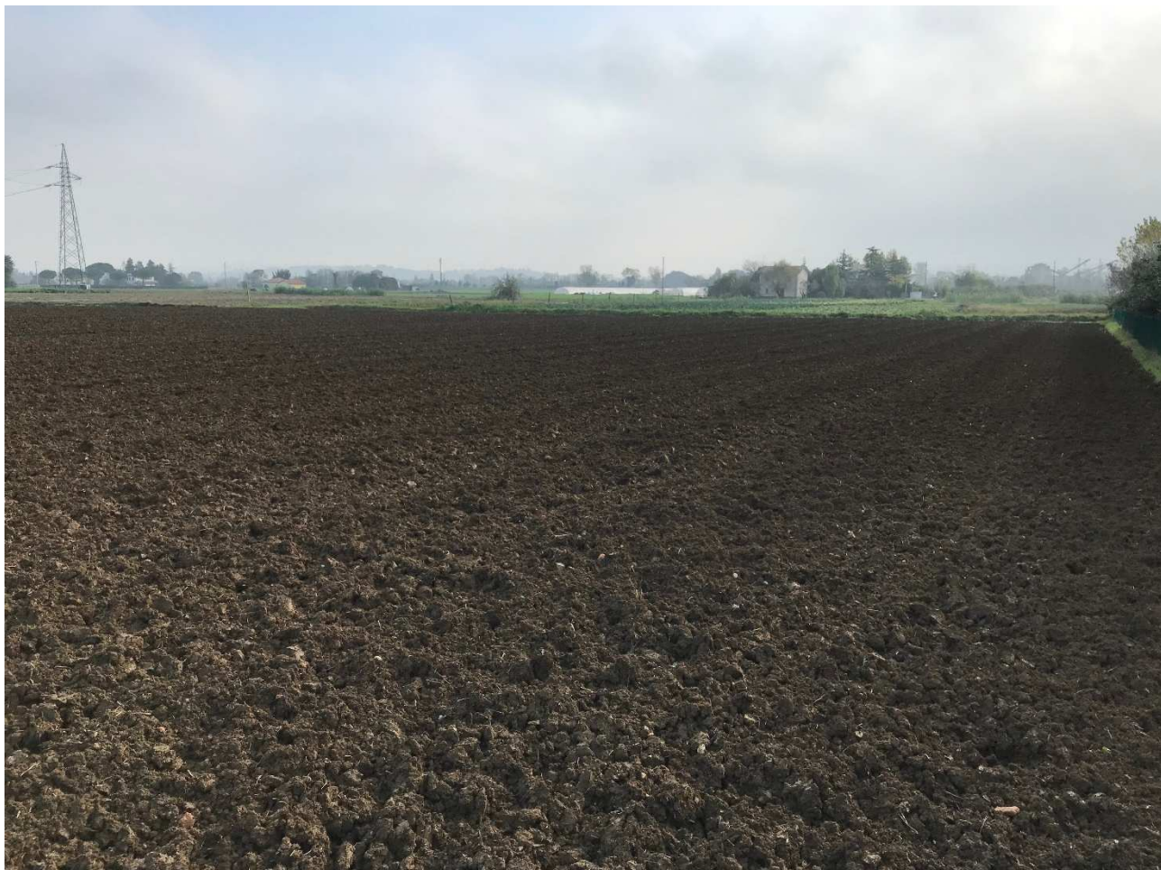
Figura 14 - UR11_1