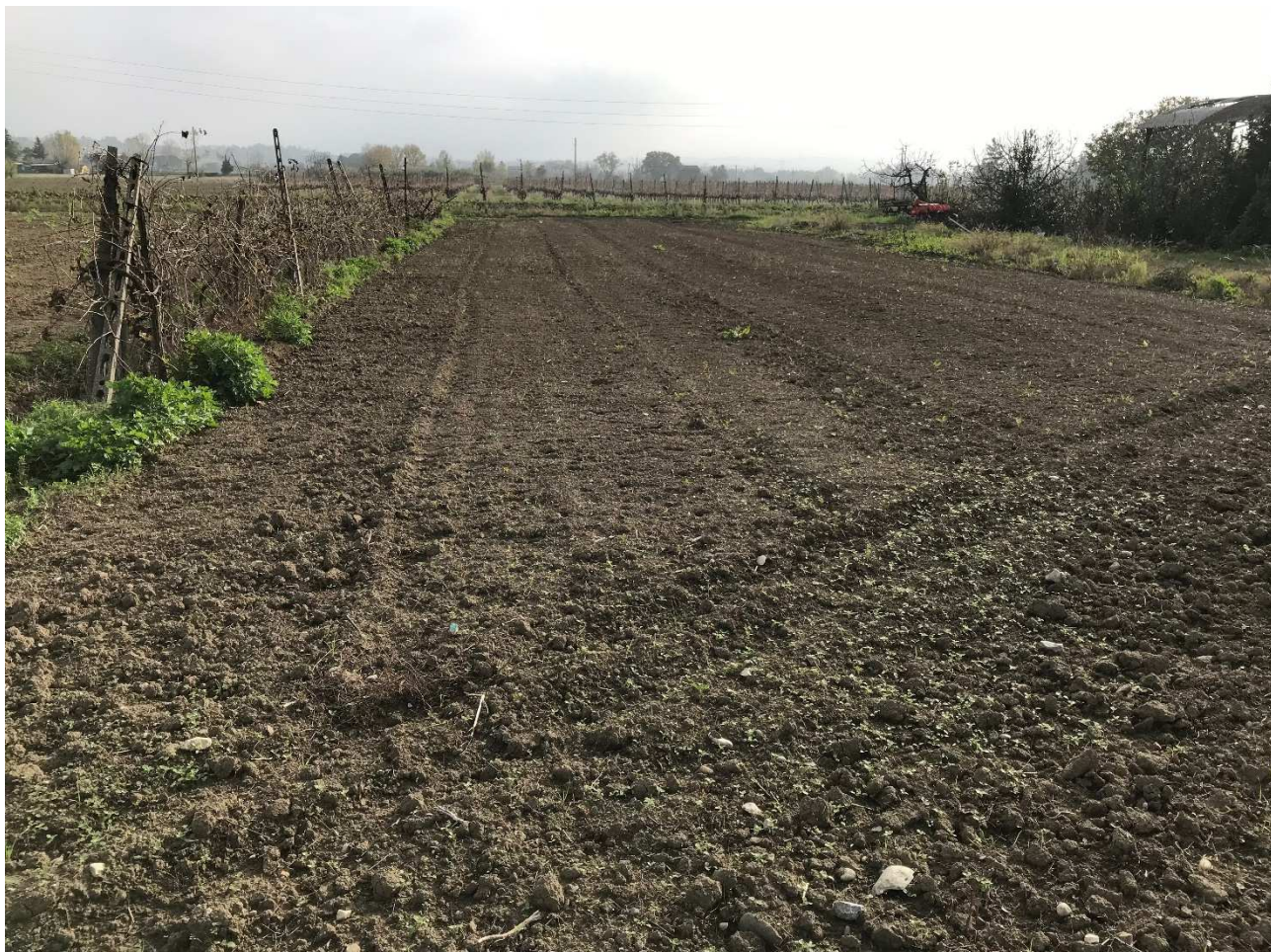
Figura 22 - UR18