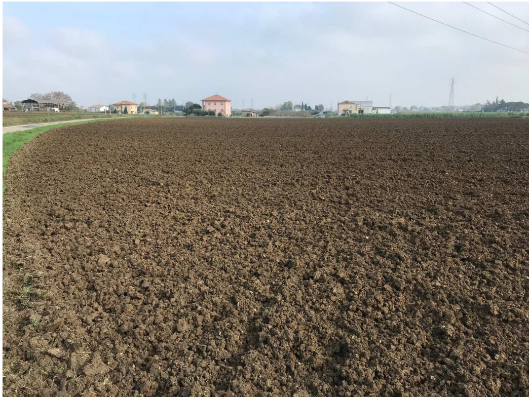
Figura 19 - UR15