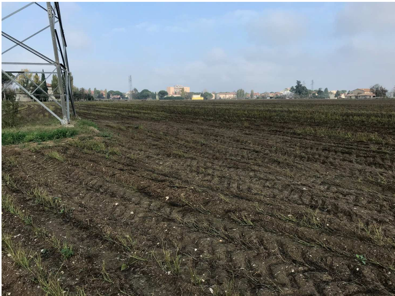
Figura 11 - UR09_1