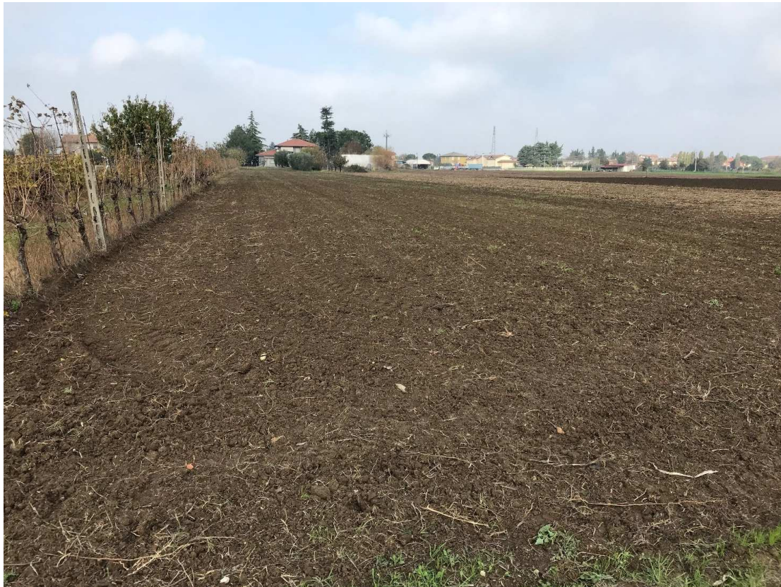
Figura 6 - UR04_05