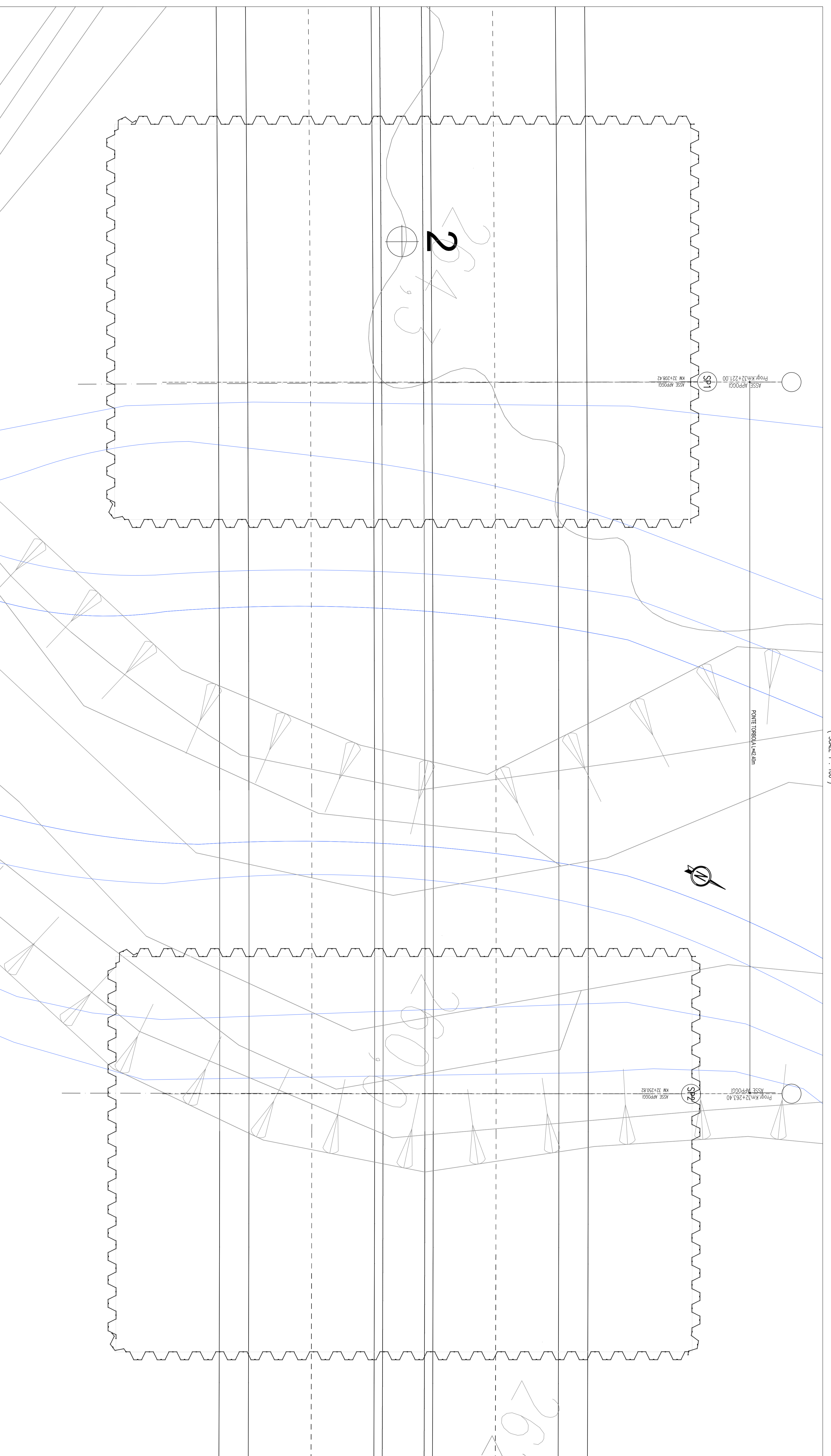
SEZIONE LONGITUDINALE ( SCALE 1 : 100 )