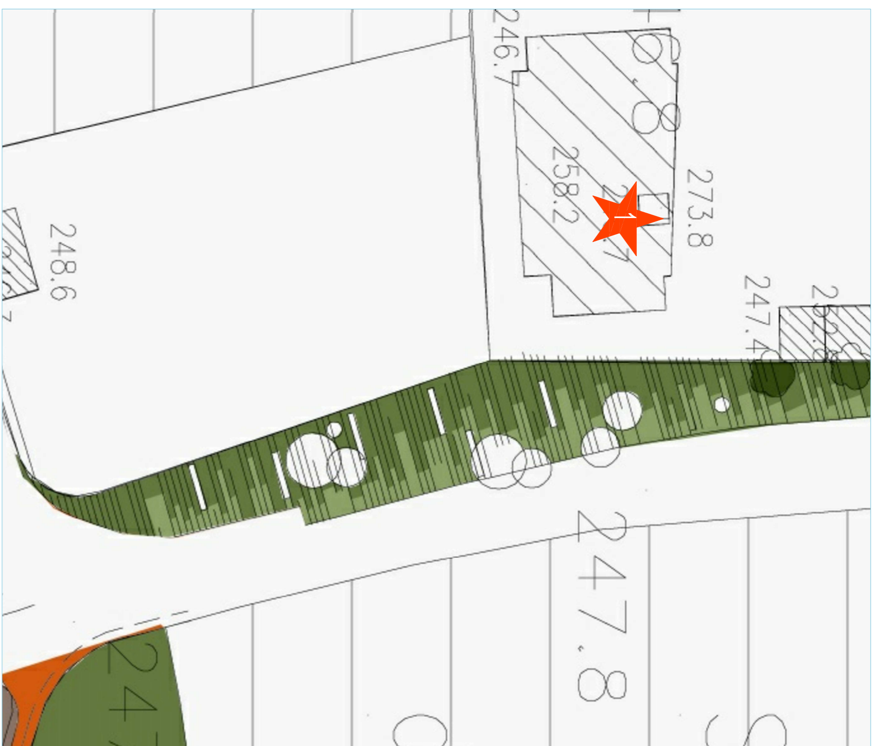
Chiesa di San Giorgio de Campis 1500