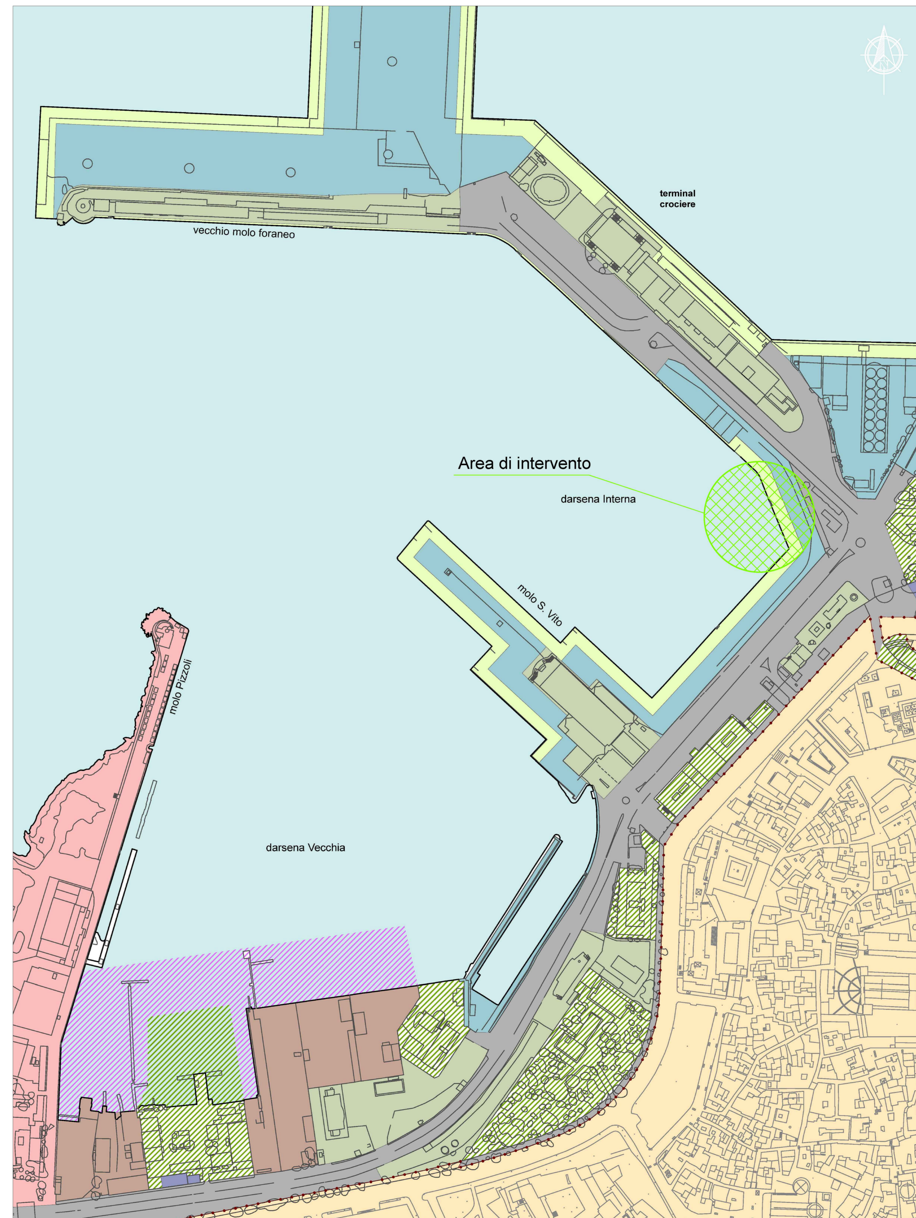
piano di utilizzo delle aree demaniali (PUA)