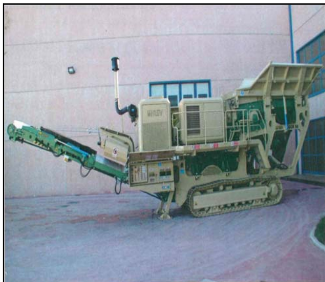
Figura 6: Sistema di demolizione CGR 98