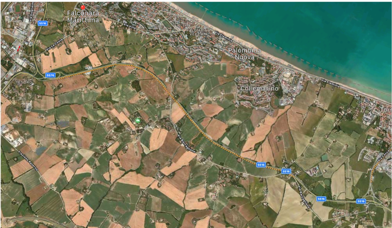
Figura 1: Vista aerea dell'area di studio

L'insieme delle opere di adeguamento ed ampliamento SS16, rappresentano l'area oggetto di intervento riportata negli elaborati di progetto esecutivo (planimetria area di cantiere T00-GE01-CAN-SC01) ed in particolare nella relazione di cantierizzazione T00-CA00-CAN-RE01. Per le modalità di svolgimento delle operazioni di scavo e demolizione all'interno del programma di esecuzione delle opere, si rimanda al cronoprogramma di cantiere (T00-CA00-CAN-CR00).