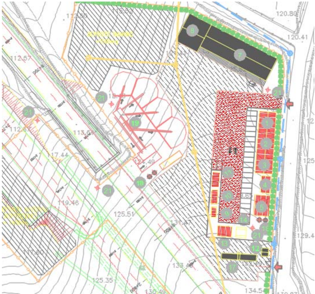
Figura 3: Area frantumazione 19 cantiere operativo n.1

In Figura 4 è riportata l'area di stoccaggio temporaneo delle terre da scavo sottoposte a trattamento con calce per il successivo reimpiego (area 16 cantiere base).