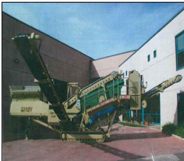
Figura 7: Sistema di vibrovagliatura GSV 35/S