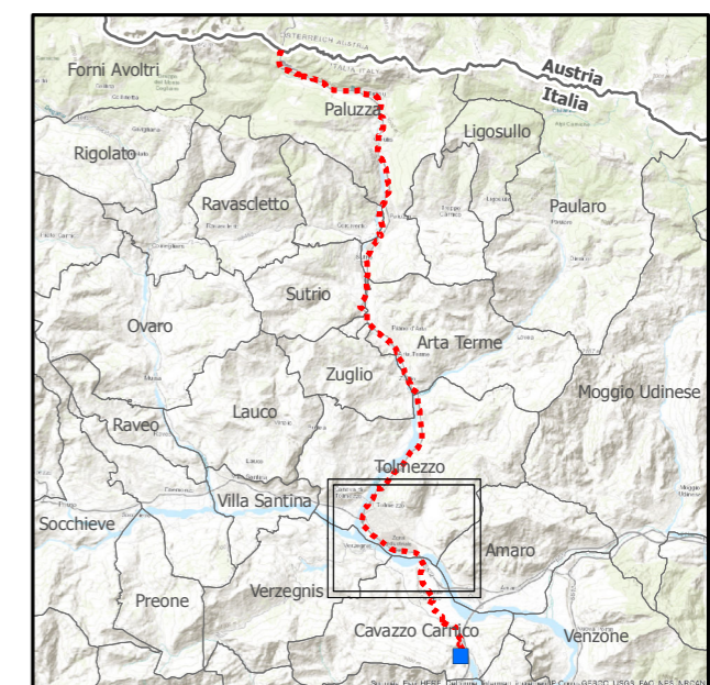
Pianta chiave in scala 1:400.000