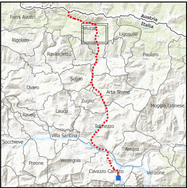
Pianta chiave in scala 1:400.000