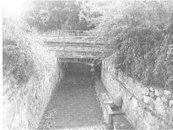
Denominazione Bene Impalcato al Km 292+706 Comune TAORMINA Didascalia Vista da Nord/Ovest