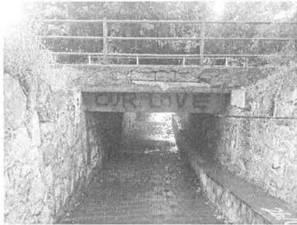
Denominazione Bene Impalcato al Km 292+706 Comune TAORMINA Didascalia Vista da Nord/Ovest