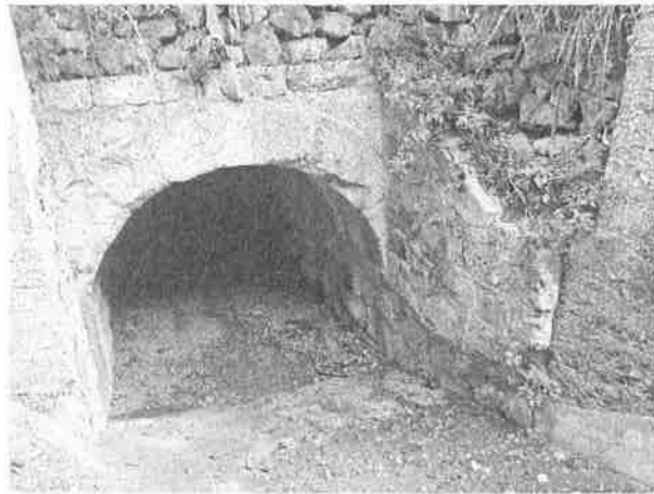
Denominazione Bene Tombino ad arco Km 319+507 Comune MESSINA Didascalia Vista da Nord