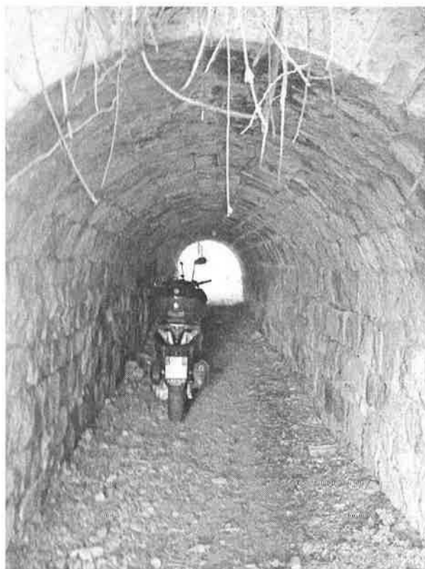
Denominazione Bene Tombino ad arco Km 319+507 Comune MESSINA Didascafia Vista da Sud/Est