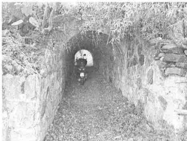
Denominazione Bene Tombino ad arco Km 319+507 Comune MESSINA Didascalia Vista da Sud/Est