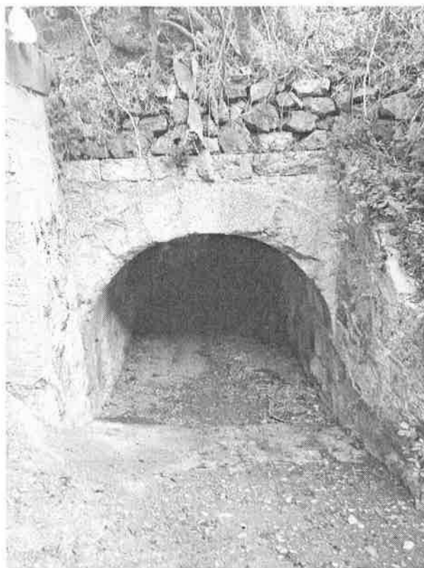
Denominazione Bene Tombino ad arco Km 319+507 Comune MESSINA Didascalia Vista da Nord/Ovest