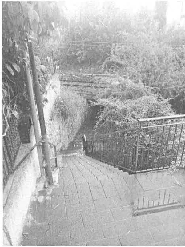
Denominazione Bene Impalcato al Km 292+706 Comune TAORMINA Didascalia Vista d'insieme