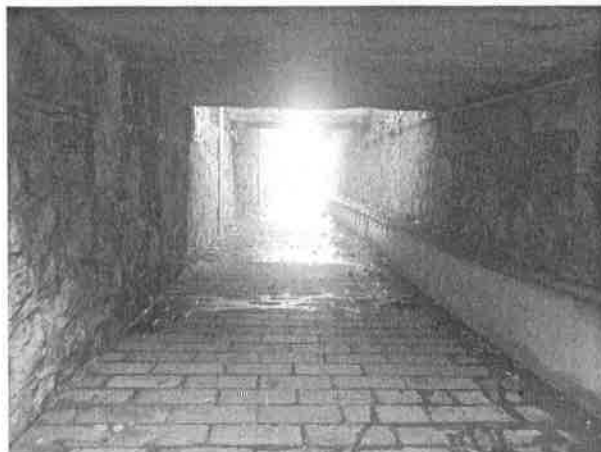
Denominazione Bene Impalcato al Km 292+706 Comune TAORMINA Didascalia Vista dell'interno