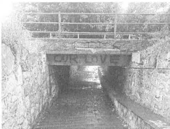
Denominazione Bene Impalcato al Km 292+706 Comune TAORMINA Didascalia Vista da Nord/Ovest