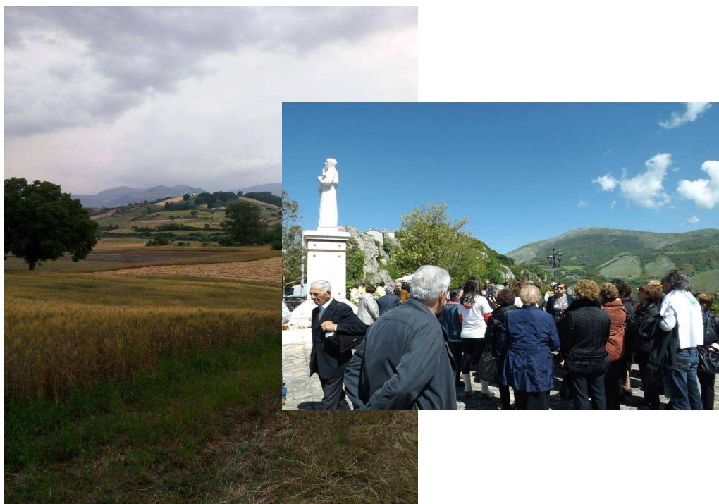
Figura 1 Area archeologica San Basilio

Tra i numerosi corsi pratici e teorici in programma ogni anno presso l'Unitre, il corso di Storia Locale mira a far conoscere ai partecipanti di varie fasce d'età, la storia, la cultura e le opere presenti nel territorio, rendendoli consapevoli della bellezza del luogo in cui vivono e delle potenzialità di sviluppo turistico-economico della città.