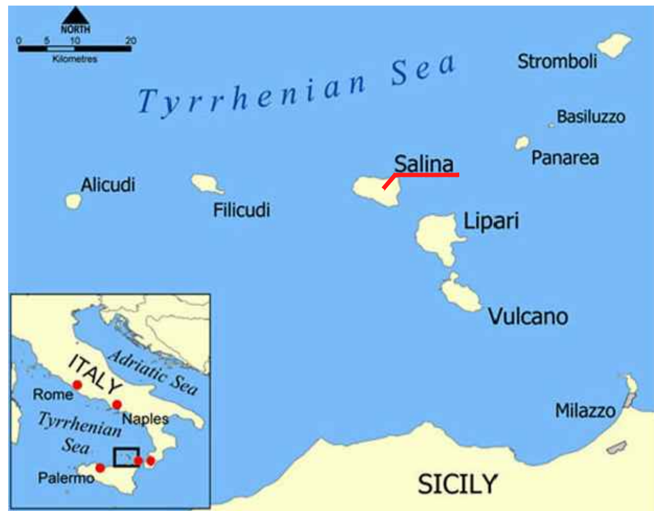
INQUADRAMENTO COROGRAFICO - Scala 1:500.000