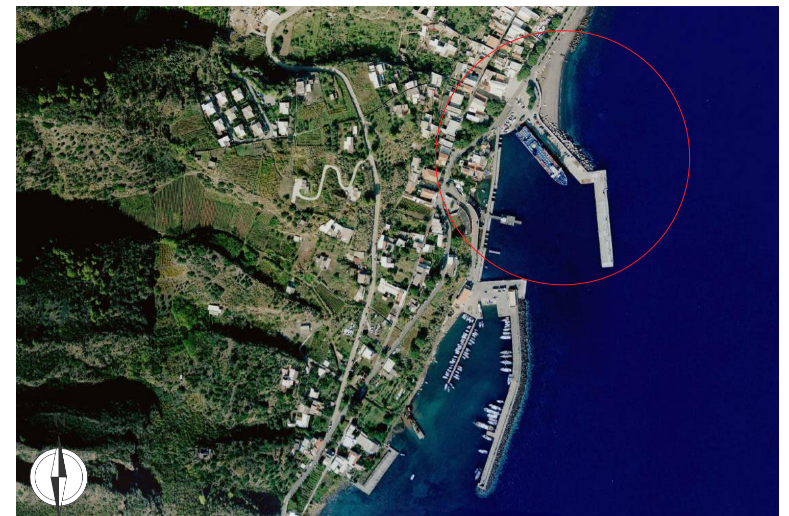
AEROFOTO- Scala 1:5.000