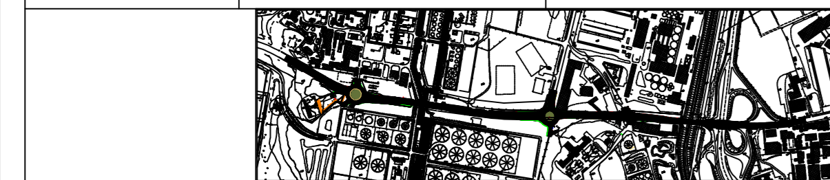
TAVOLA 0 5.s UBICAZIONE E ALLESTIMENTO CANTIERE PRIMARIO