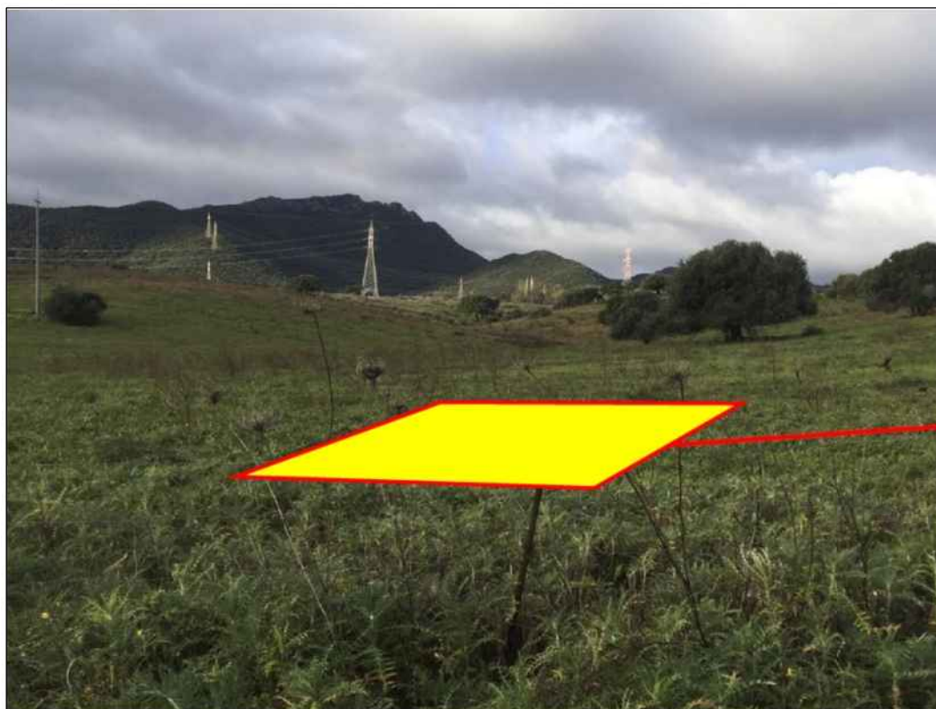
Panoramica del tratto terminale della condotta, in Comune di Sarroch