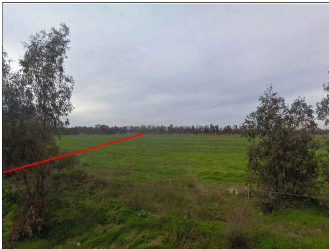
Panoramica del tracciato nel Comune di Uta