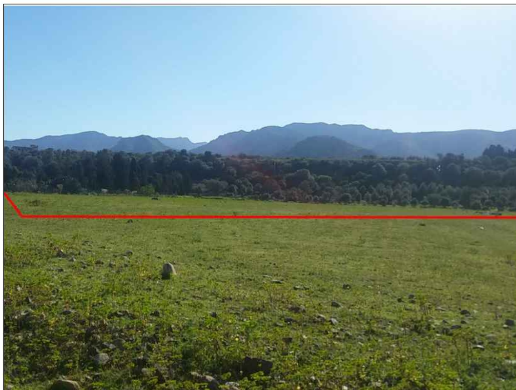
Attraversamento in terreni destinati al pascolo, in Comune di Uta