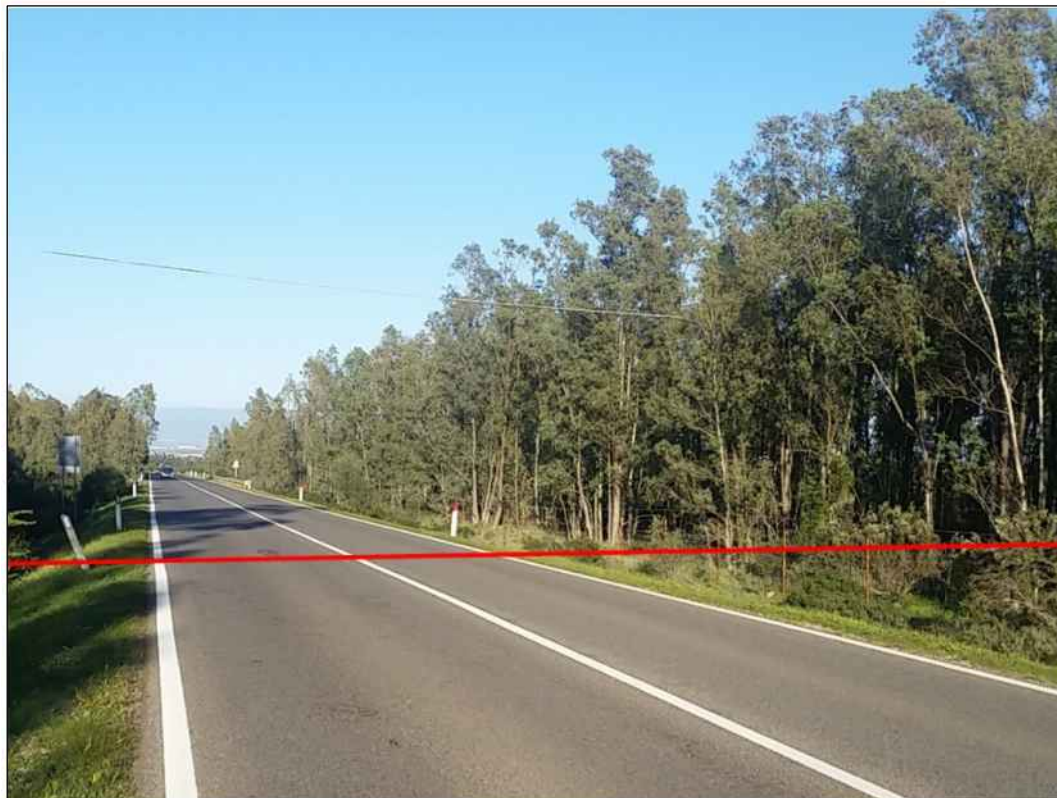
Attraversamento della S.P. n.2 nel tratto iniziale del tracciato, in Comune di Uta