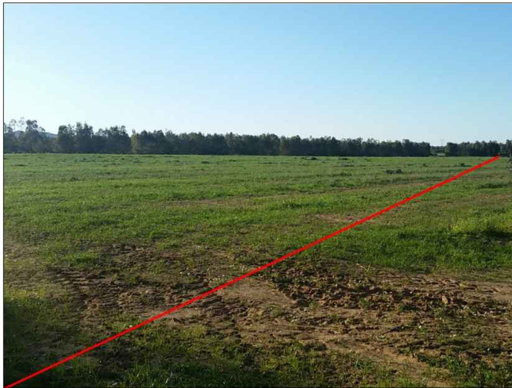
Attraversamento di prati-pascoli in Comune di Uta