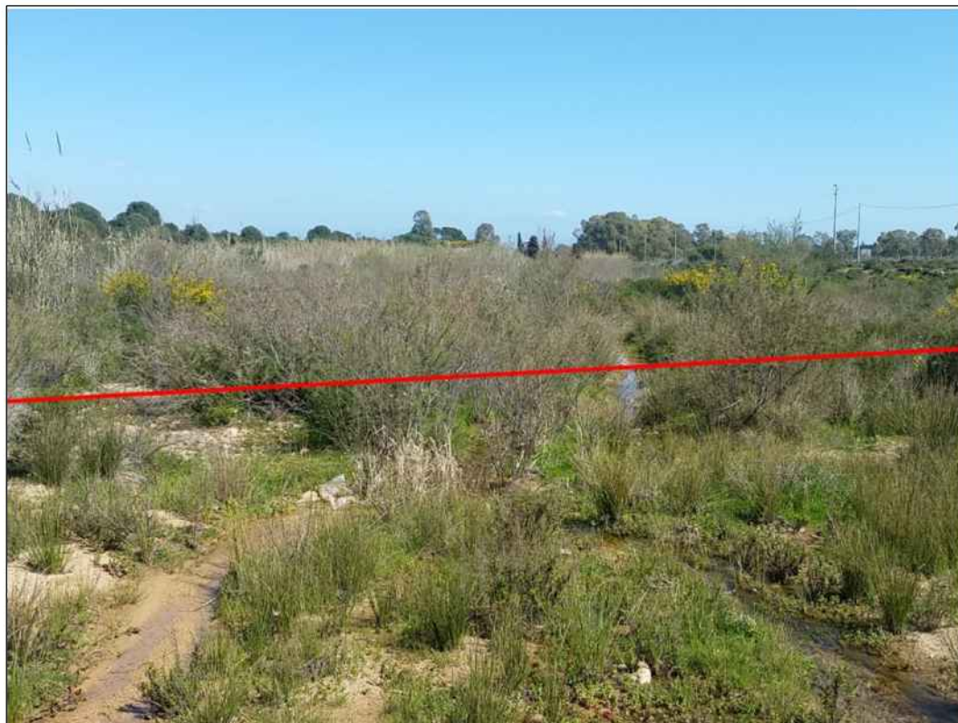
Attraversamento del Riu Baccalamanza, in Comune di Capoterra