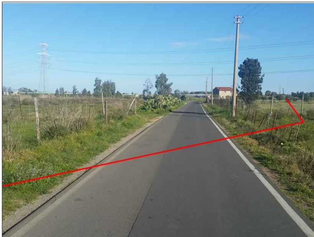
Attraversamento strada comunale in vicinanza del Riu di Santa Lucia, in Comune di Capoterra