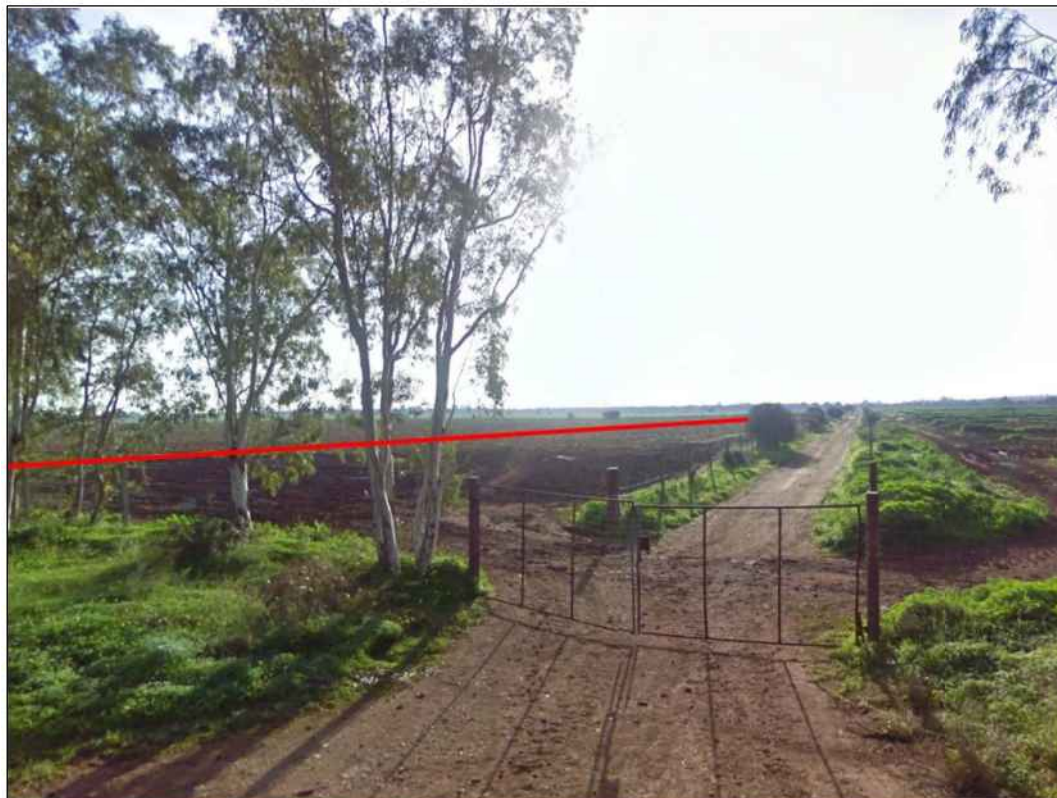
Attraversamento di seminativi, in Comune di Uta