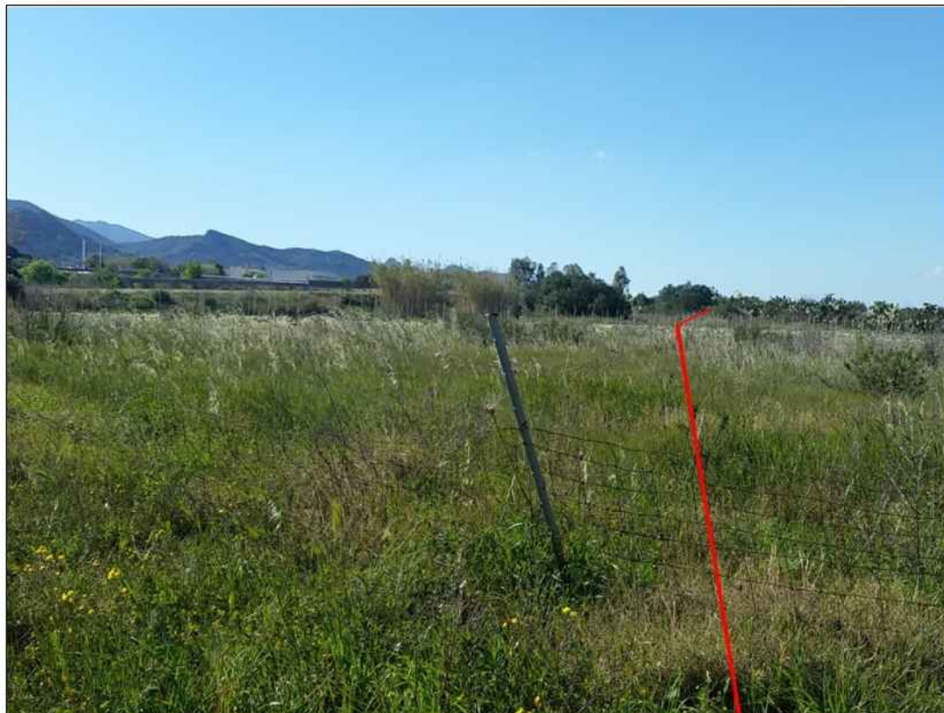
Percorrenza del tracciato in prossimita' della localita' Is Marginus, in Comune di Capoterra