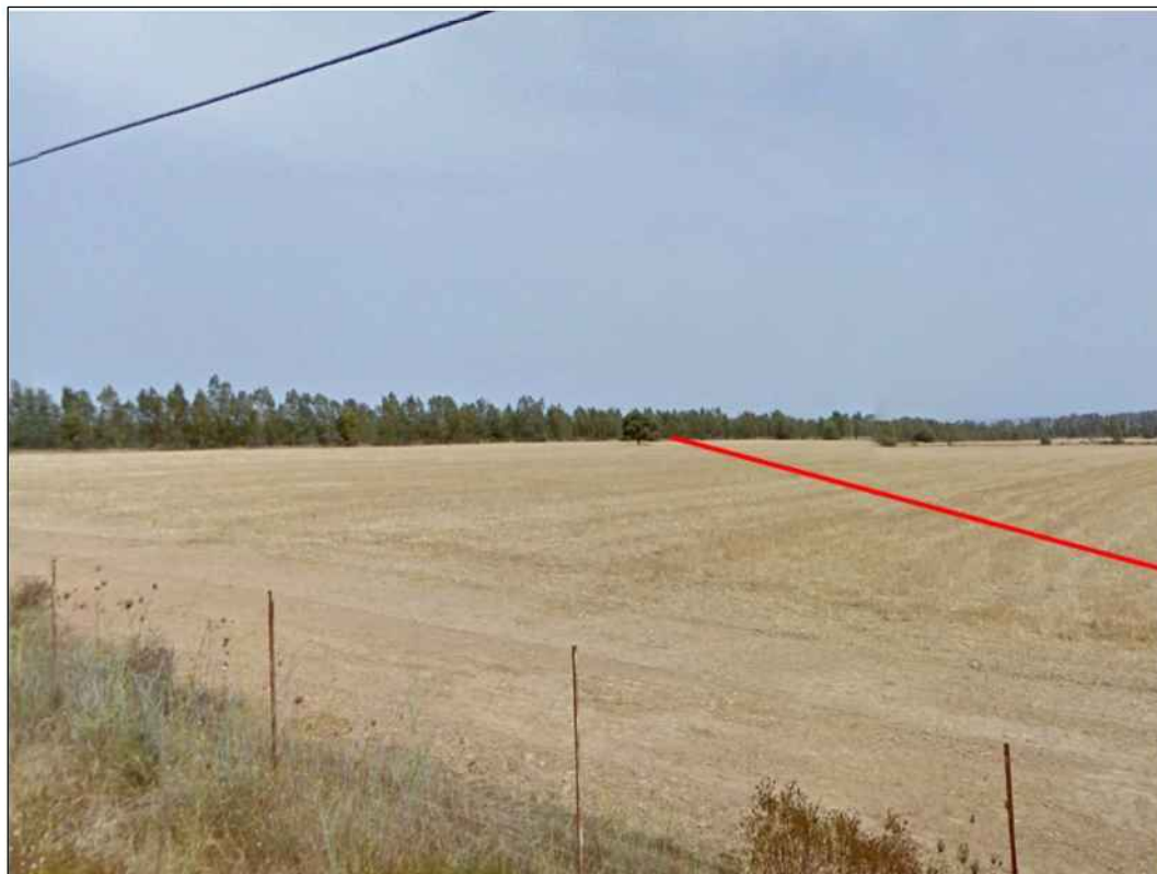
Percorrenza di seminativi in prossimità del Rio Gora Acqua Frisca, in Comune di Uta