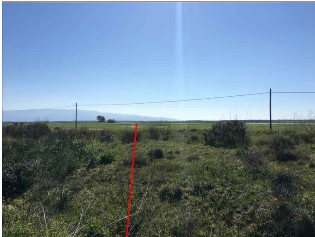
Panoramica del tracciato nel tratto iniziale in corrispondenza della zona umida, in Comune di Santa Giusta