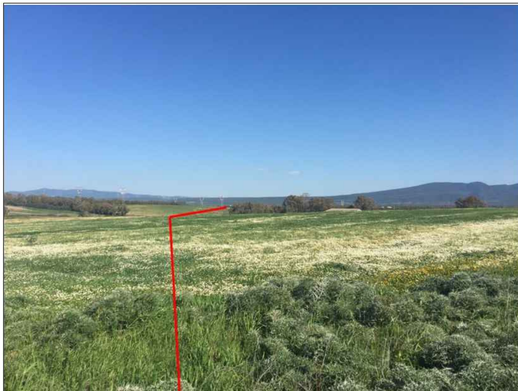
Panoramica del tracciato a nord del Canale Adduttore Tirso Arborea, in Comune di Santa Giusta