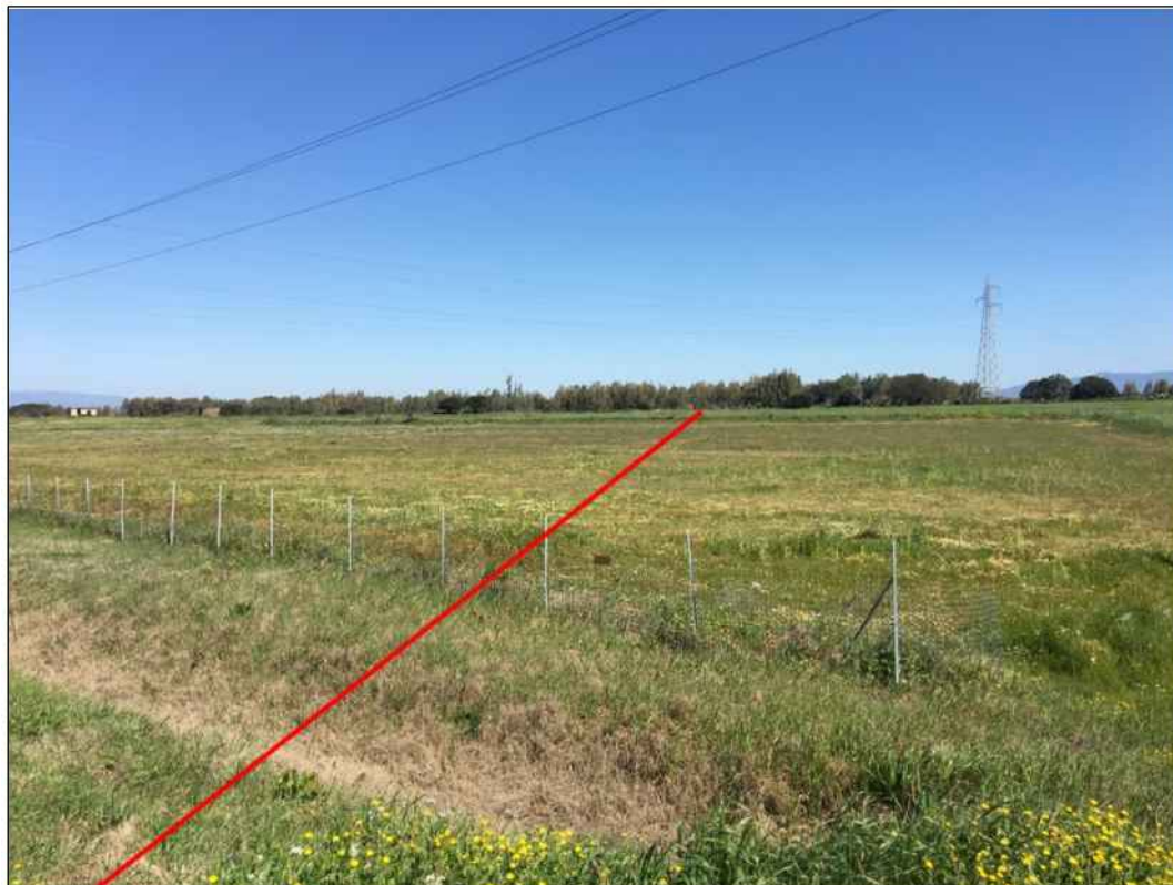
Percorrenza della condotta in prossimità della S.S. 131 Carlo Felice, in località Santu Amenteddu, in Comune di Santa Giusta