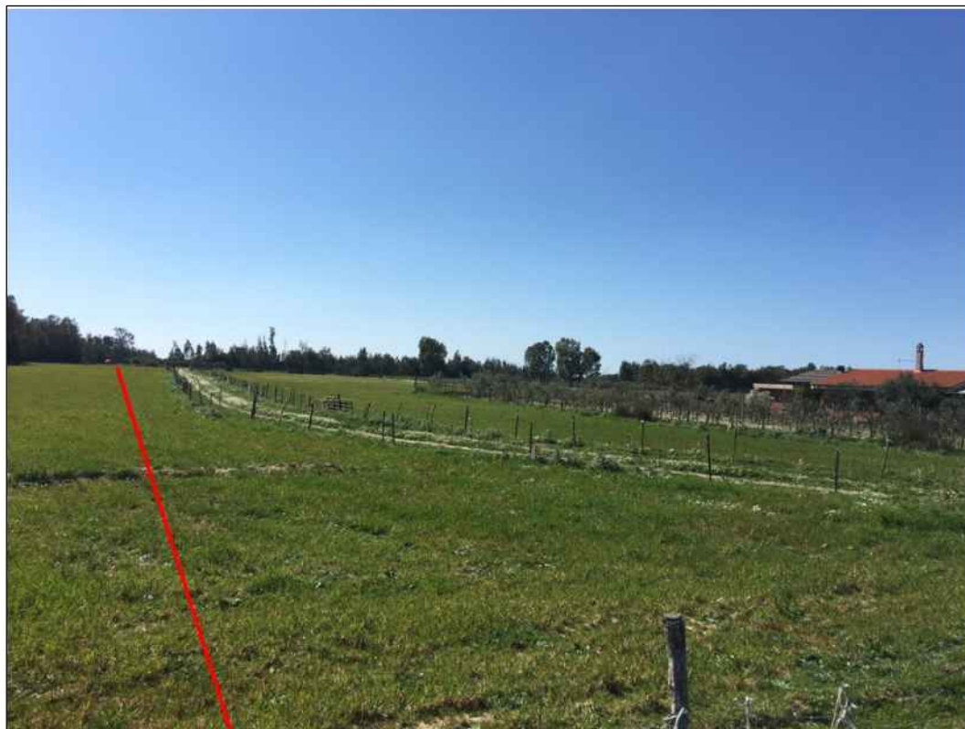
Tracciato in terreni destinati al pascolo, in Comune di Santa Giusta