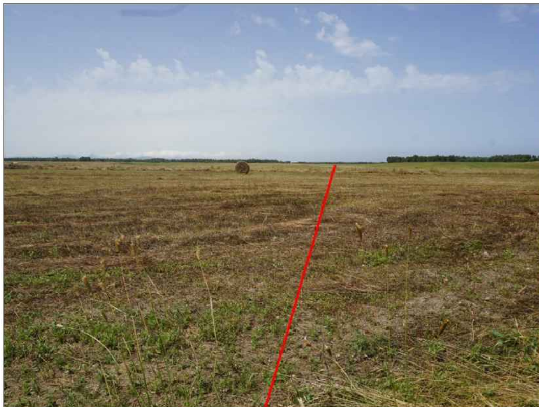
Panoramica del tracciato a nord-ovest del centro abitato di Tiria, in Comune di Palmas Arborea