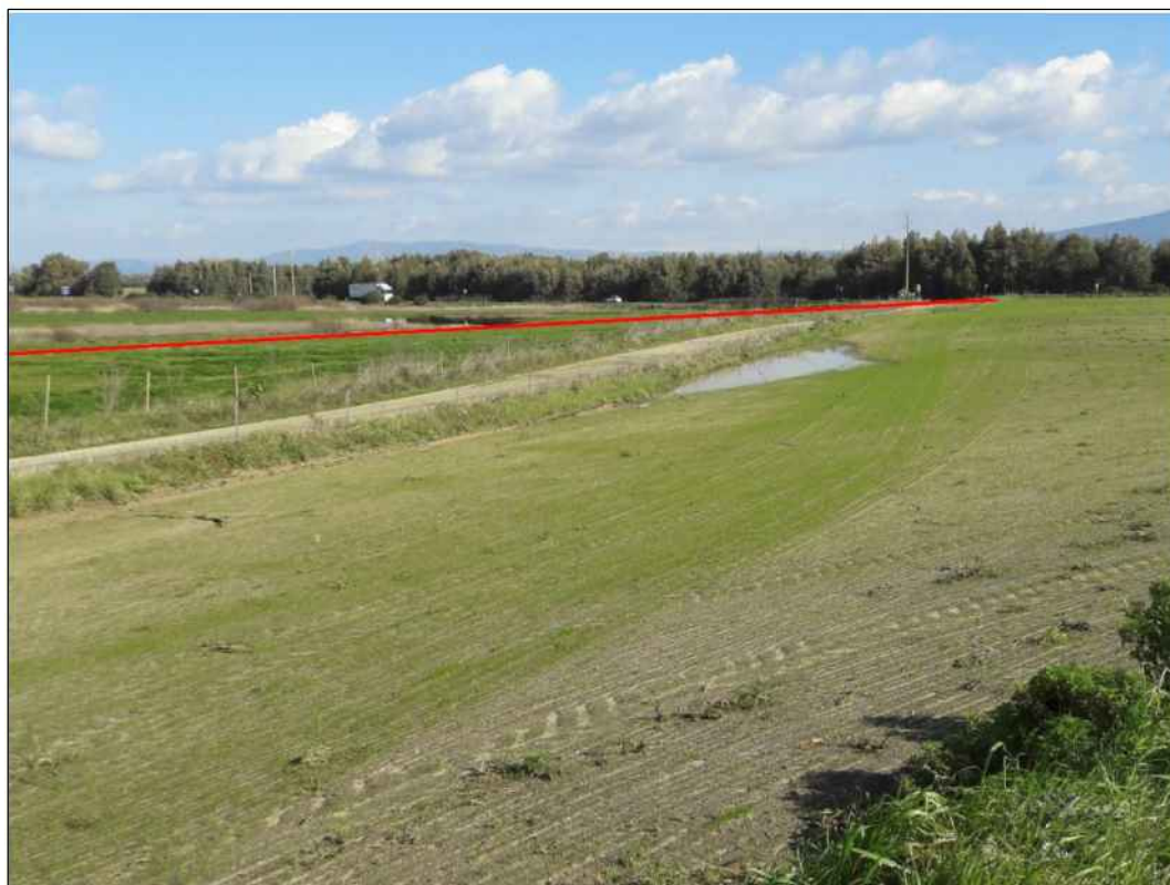
Panoramica del tracciato nel Comune di Santa Giusta