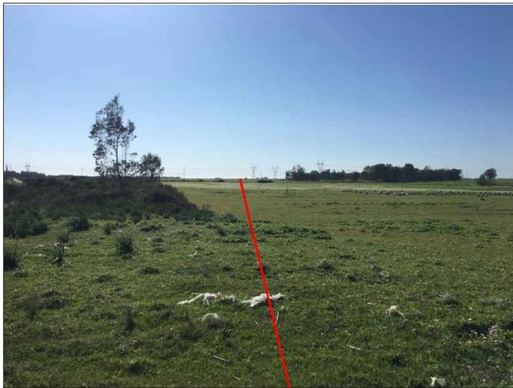
Percorrenza della condotta in terreni destinati al pascolo in prossimita' del Canale Adduttore Tirso Arborea, in Comune di Palmas Arborea