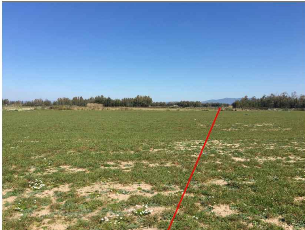
Percorenza in localita' Straccosis, in Comune di Santa Giusta