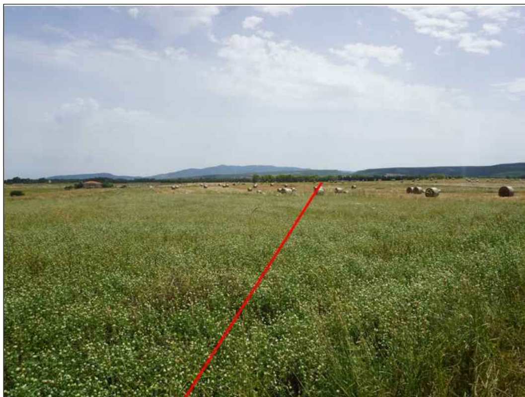
Panoramica del tratto finale del tracciato in seminativi, in Comune di Oristano