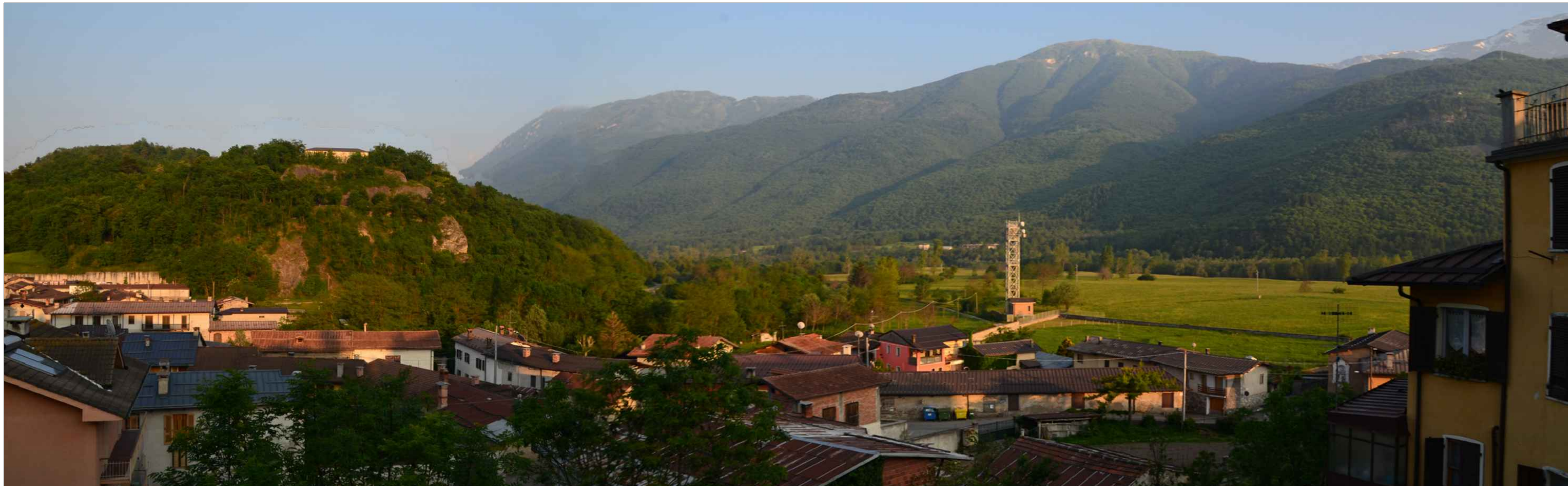
STATO DI PROGETTO MITIGATO