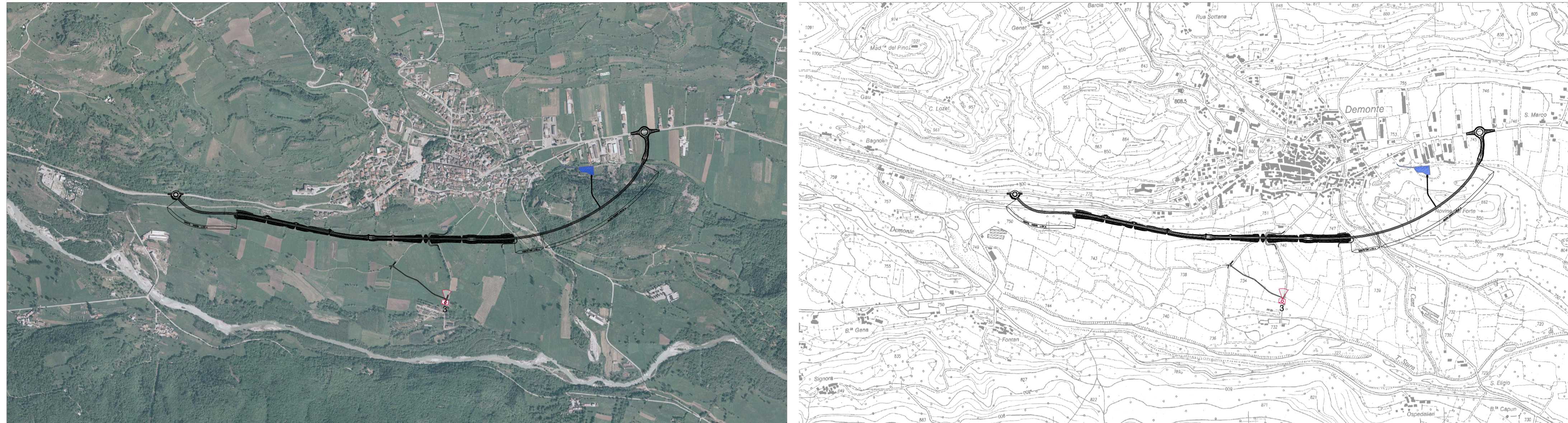
RIPRESA 3 - VISTA DEL PODIO, DAL VIADOTTO CANT ALLA PROG. 1+025, CON RIPRESA DA VIA GRANILI VICINO IL CAMPING "LA SORGENTE" (PERIODO PRIMAVERILE-ESTIVO)