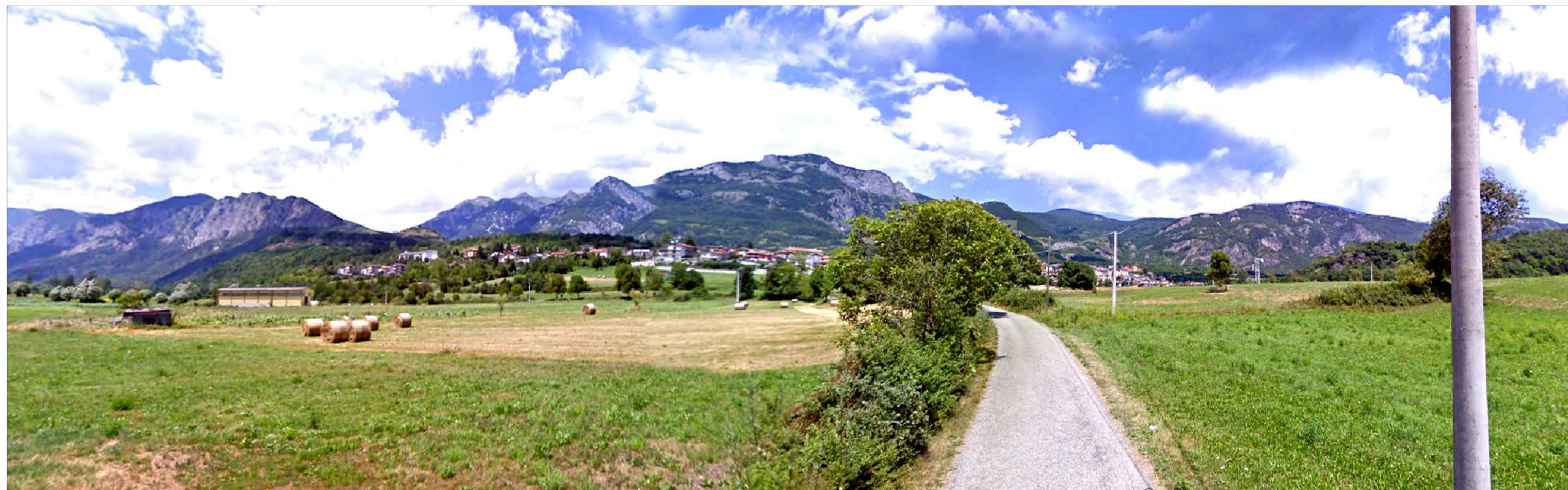
STATO DI PROGETTO MITIGATO