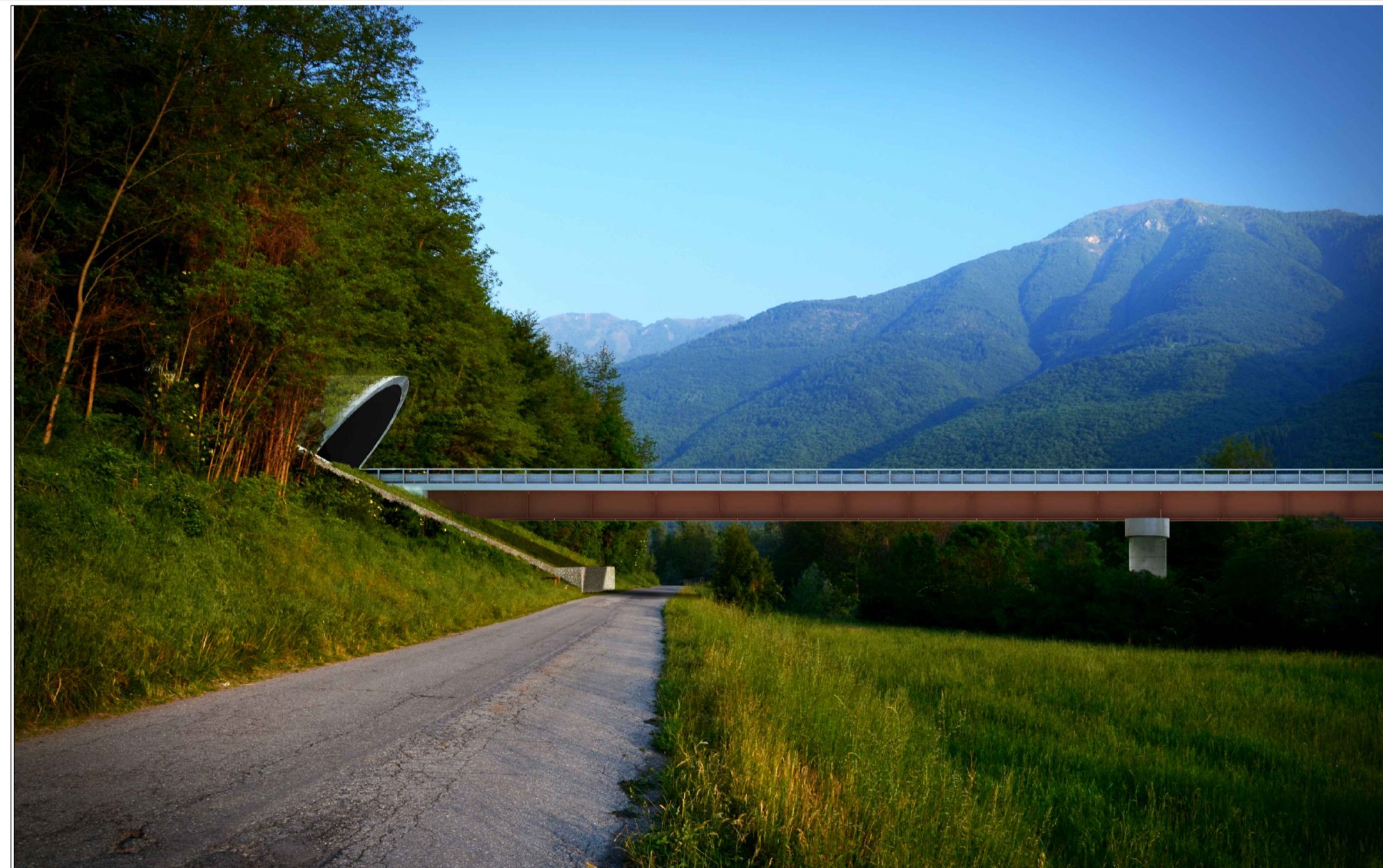
RIPRESA 4 - VISTA DELLA ROTATORIA EST E DELL'IMBOCCO EST DELLA GALLERIA DEMONTE, CON RIPRESA DALLA S.S.21 DEL COLLE DELLA MADDALENA STATO DI FATTO