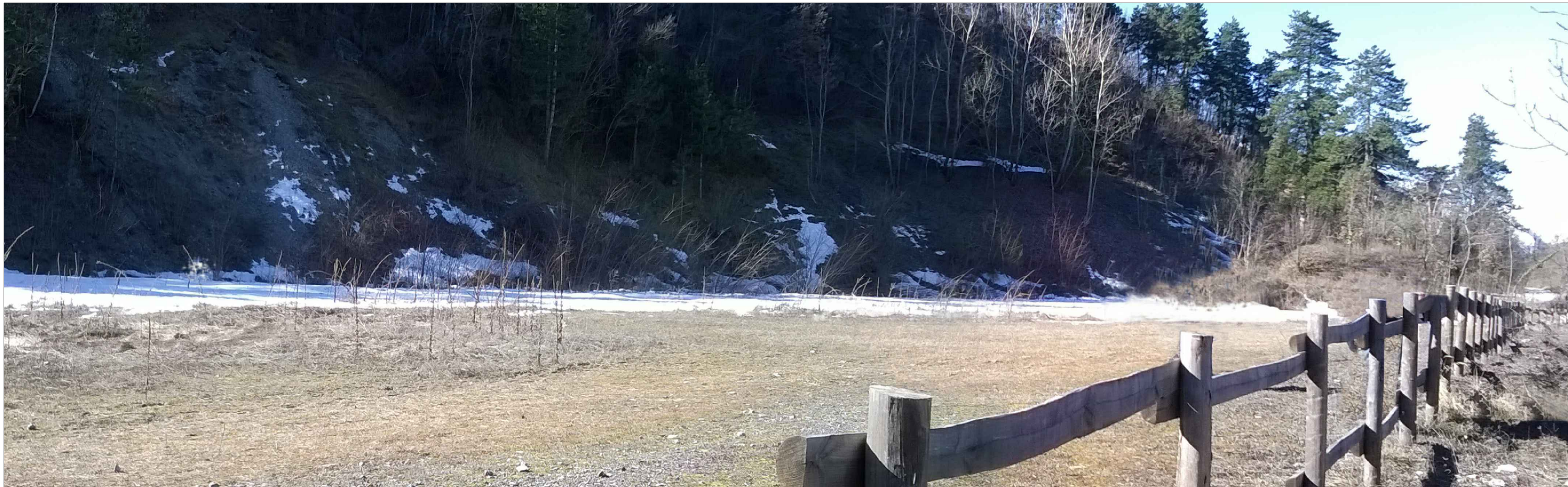
STATO DI PROGETTO MITIGATO