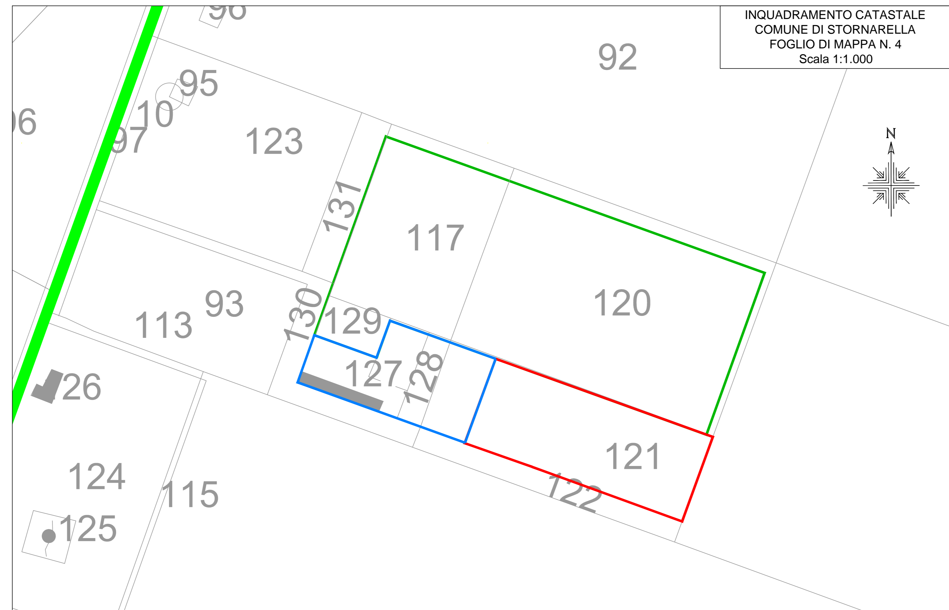
INQUADRAMENTO CATASTALE COMUNE DI STORNARELLA FOGLIO DI MAPPA N. 4 Scala 1:1.000