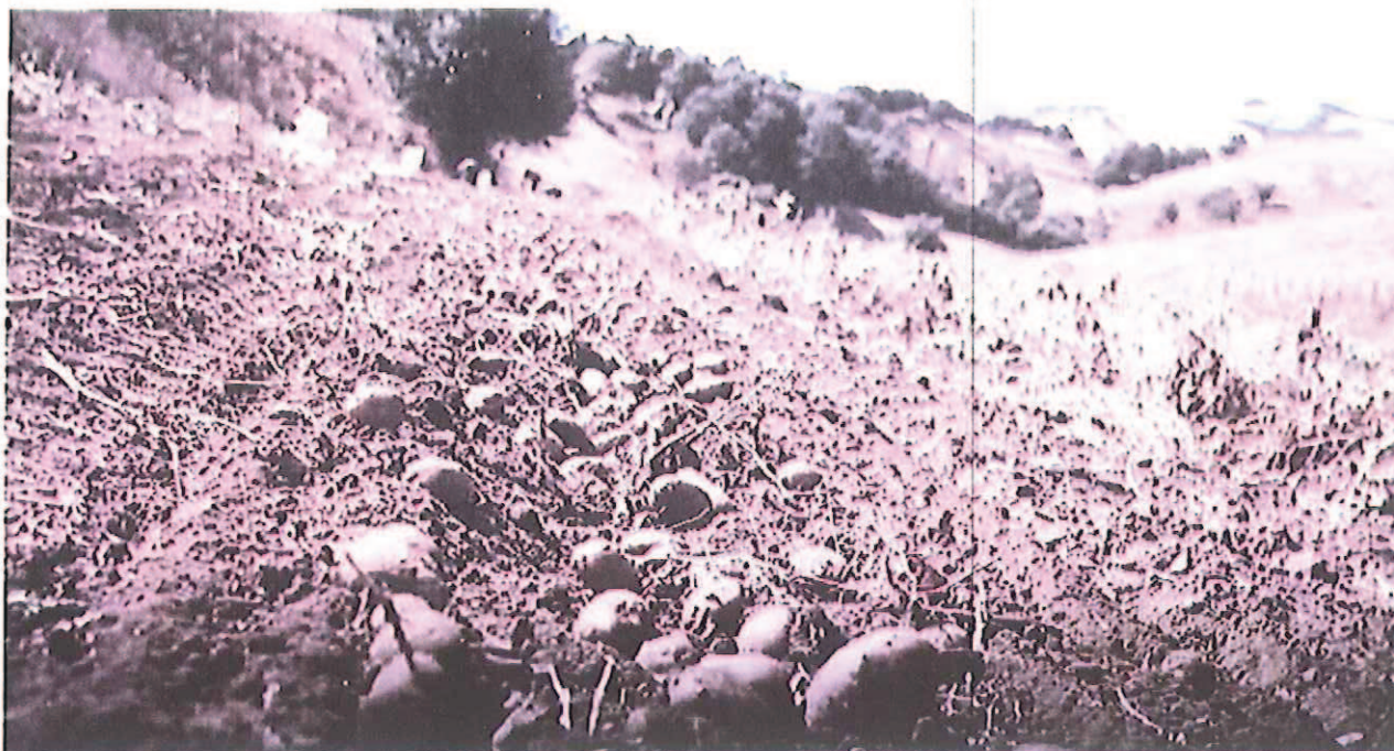
Figura 1 uno dei campi di patate di Muro Lucano