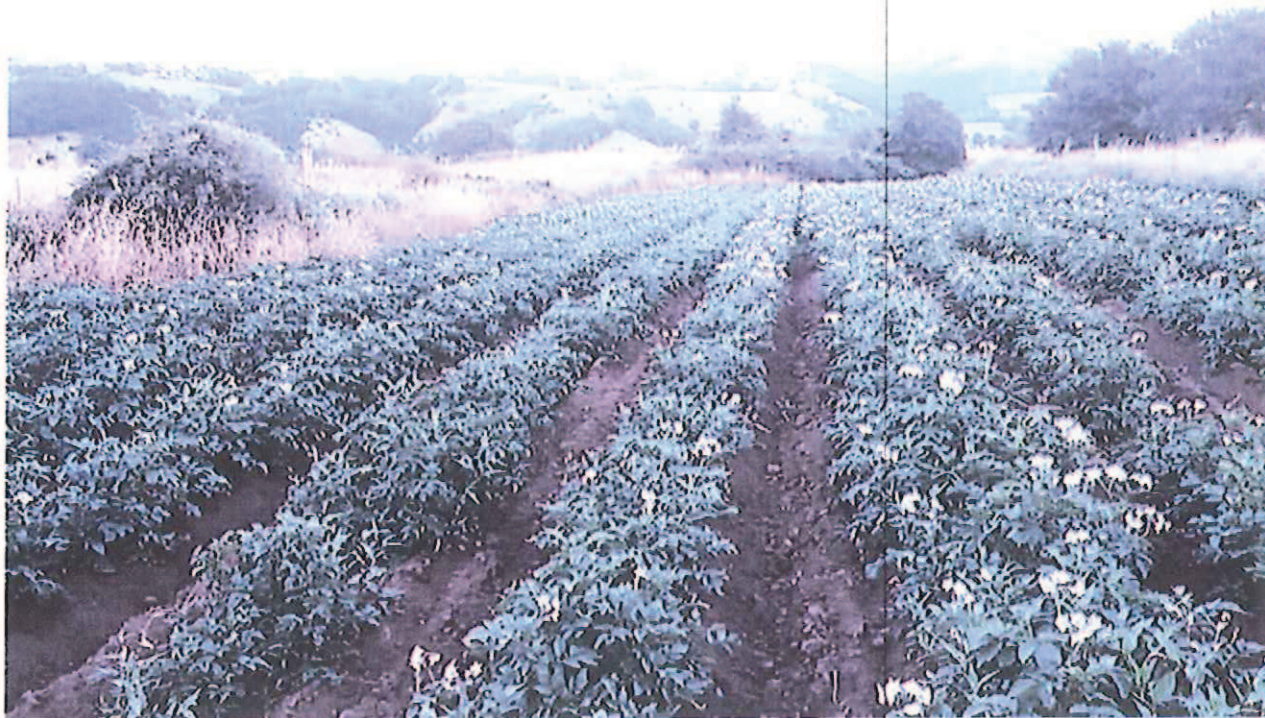
Figura 3 Campo coltivato a patate sulla montagna murese

Sempre nella predetta zona, vi sono numerosi pascoli nei quali in Muro Lucano è possibile far crescere bestiame allo stato naturale, ciò permette di poter usufruire di prodotti provenienti dall'allevamento al fine di concepire prodotti BIO . Tuttavia è noto che la presenza di torri con pale eoliche incide anche sui tragitti degli animali da pascolo.