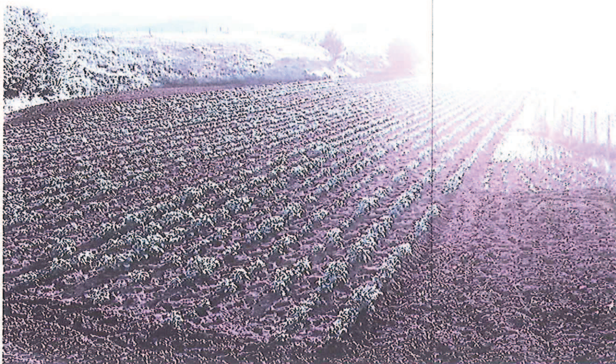
Figura 2 Campi a coltura di patate