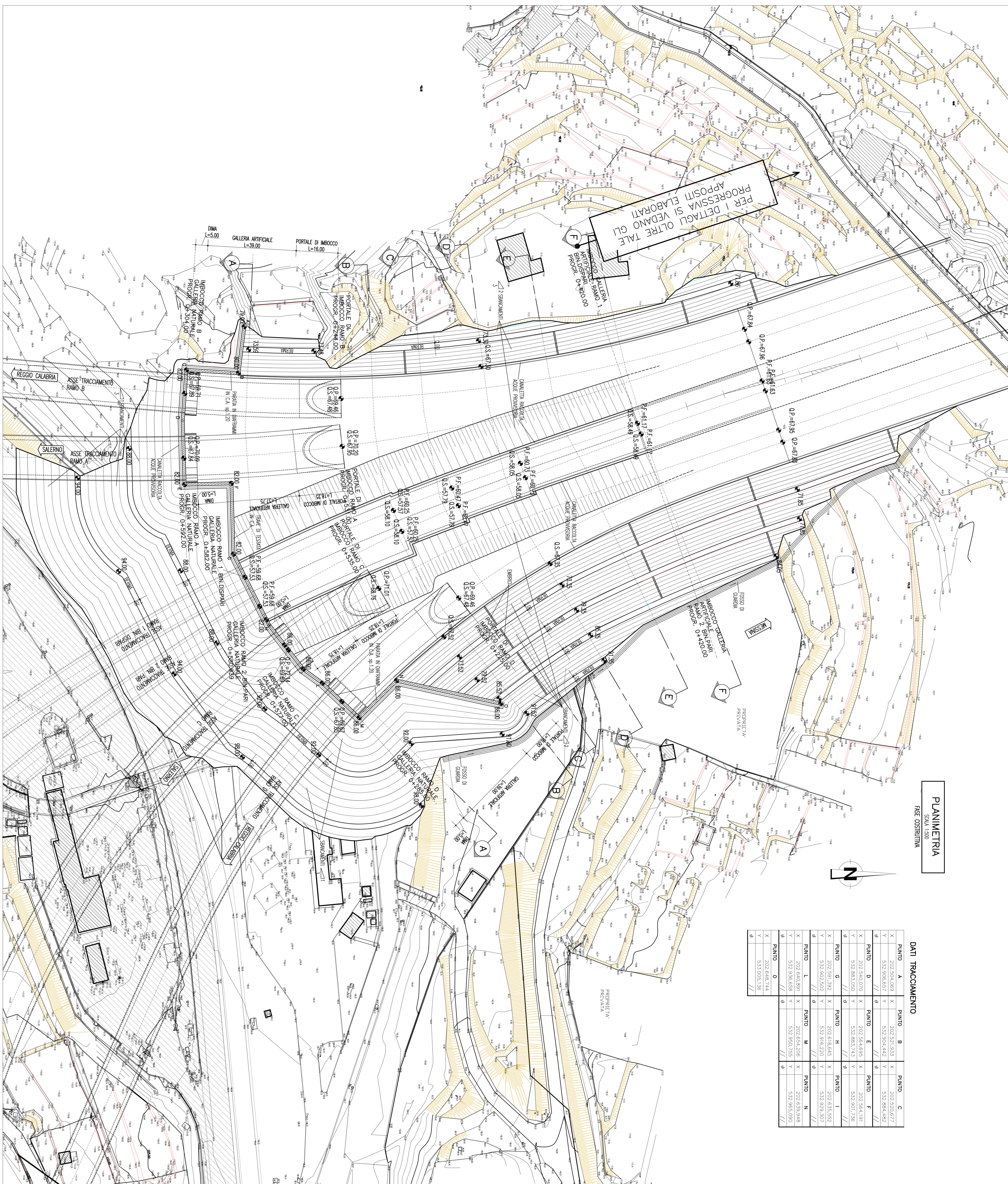
PLANIMETRIA FASE COSTRUTTIVA SCALA 1:500