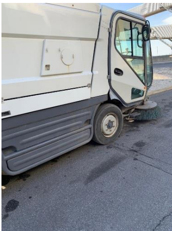
Figura 3 - Mezzo utilizzato per la pulizia strade