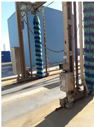
Figura 2- Postazione lavaggio mezzi