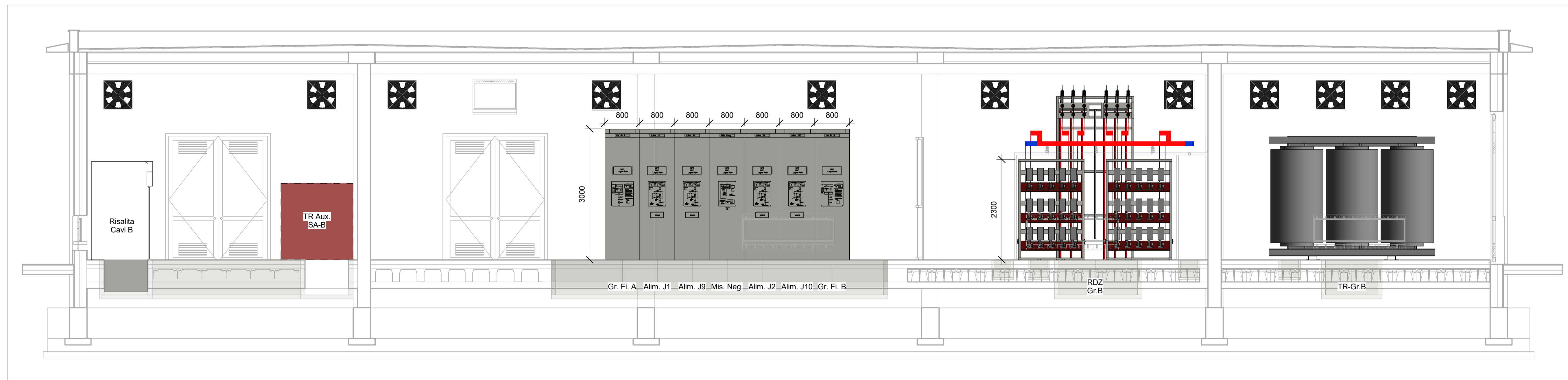
2 B 1 : 50

Note: - Le quote sono espresse in millimetri se non espressamente indicato