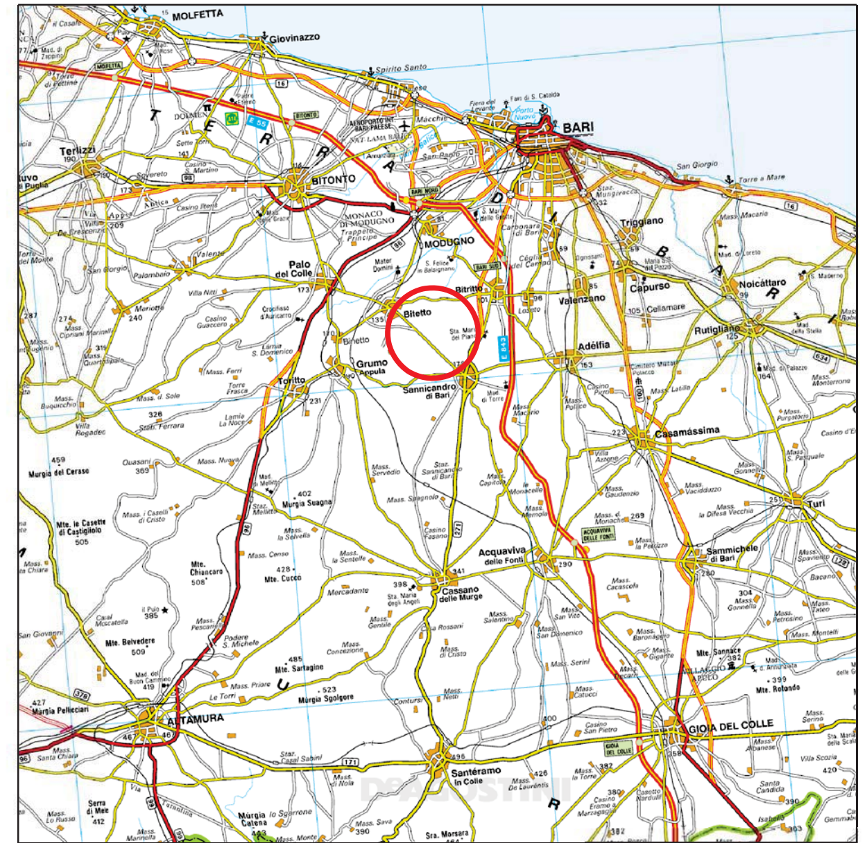
Cartografia IGM Scala 1:250.000